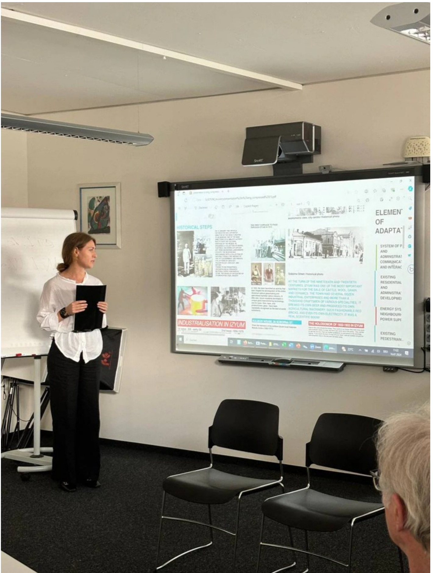
Ескізний проект адаптації житлового кварталу в центральній частині міста Ізюм