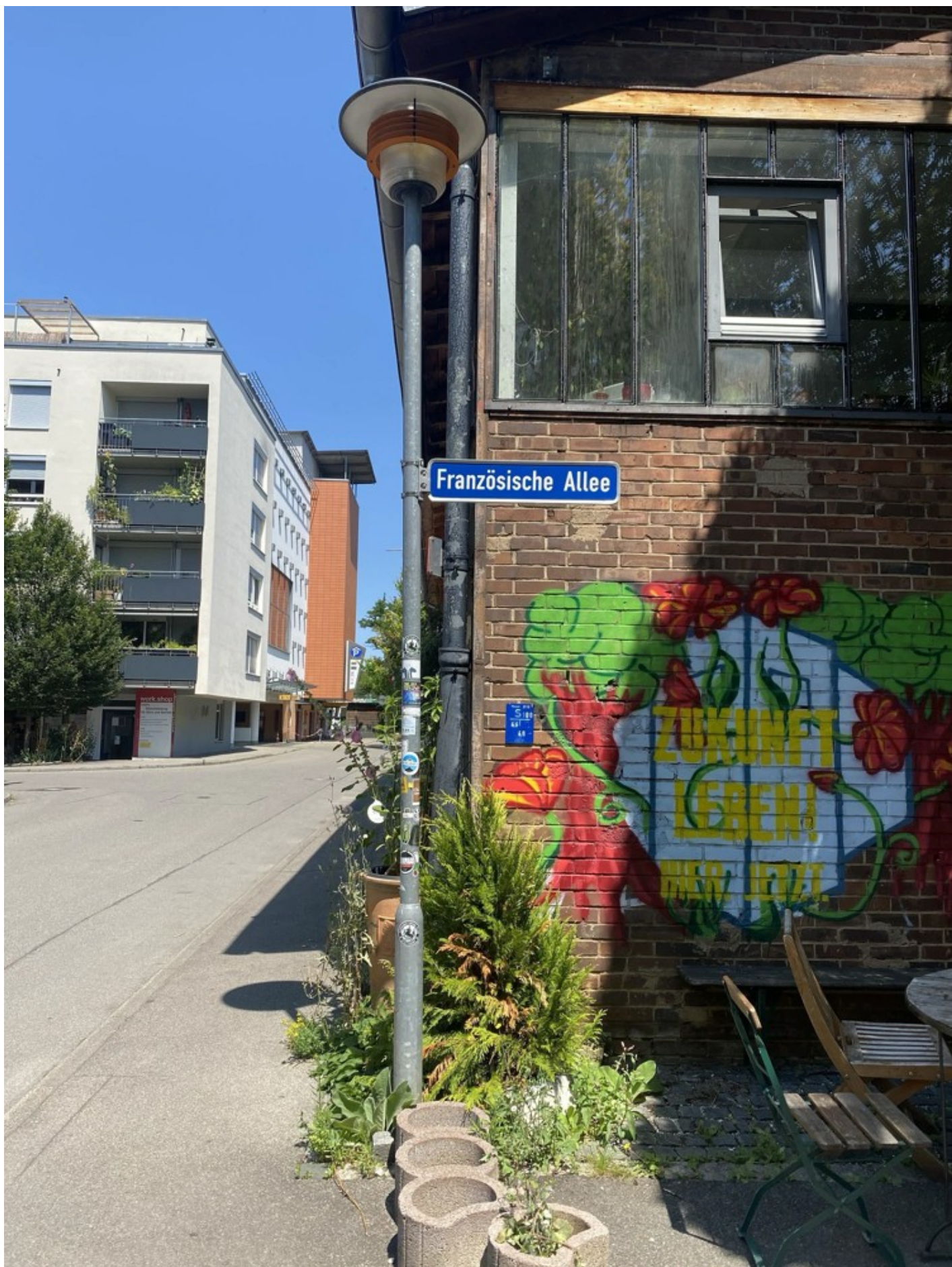
Ескізний проект адаптації житлового кварталу в центральній частині міста Ізюм