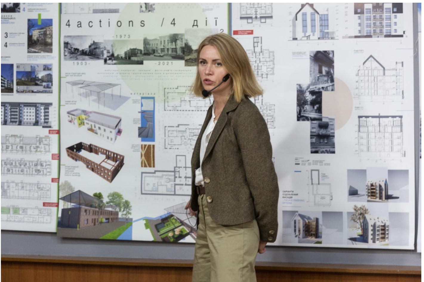
Ескізний проект адаптації житлового кварталу в центральній частині міста Ізюм