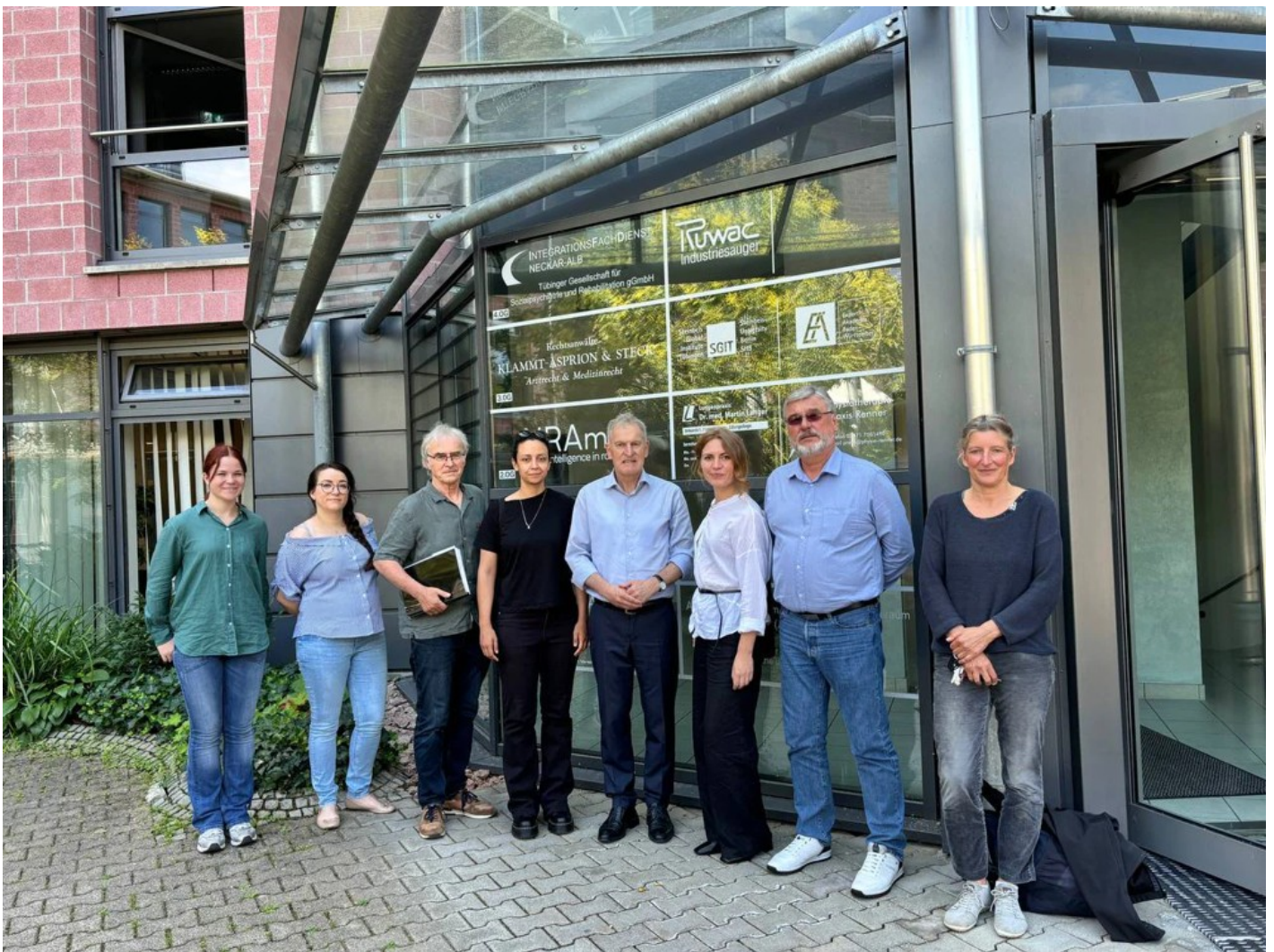
Ескізний проект адаптації житлового кварталу в центральній частині міста Ізіум