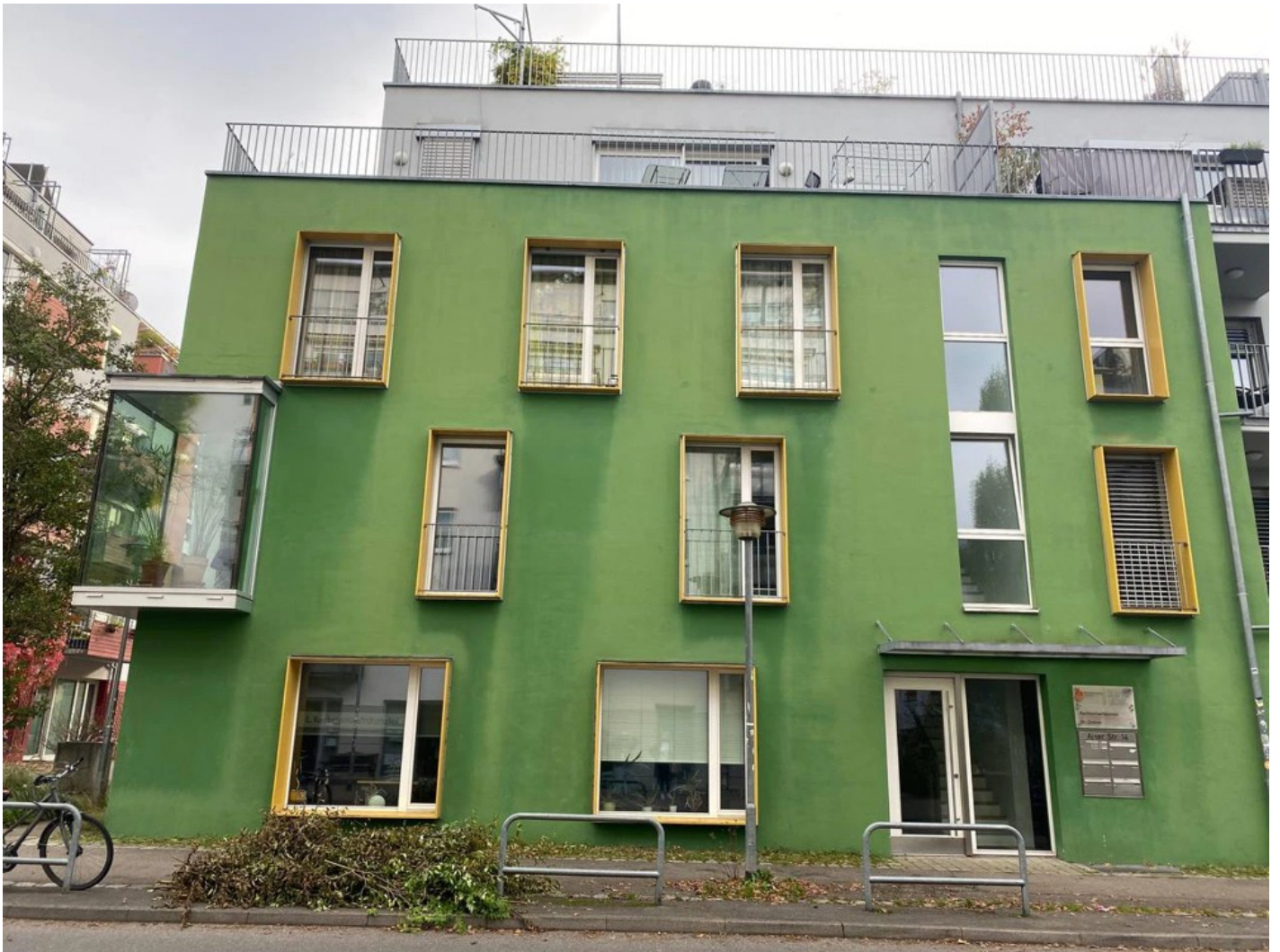
Ескізний проект адаптації житлового кварталу в центральній частині міста Ізюм