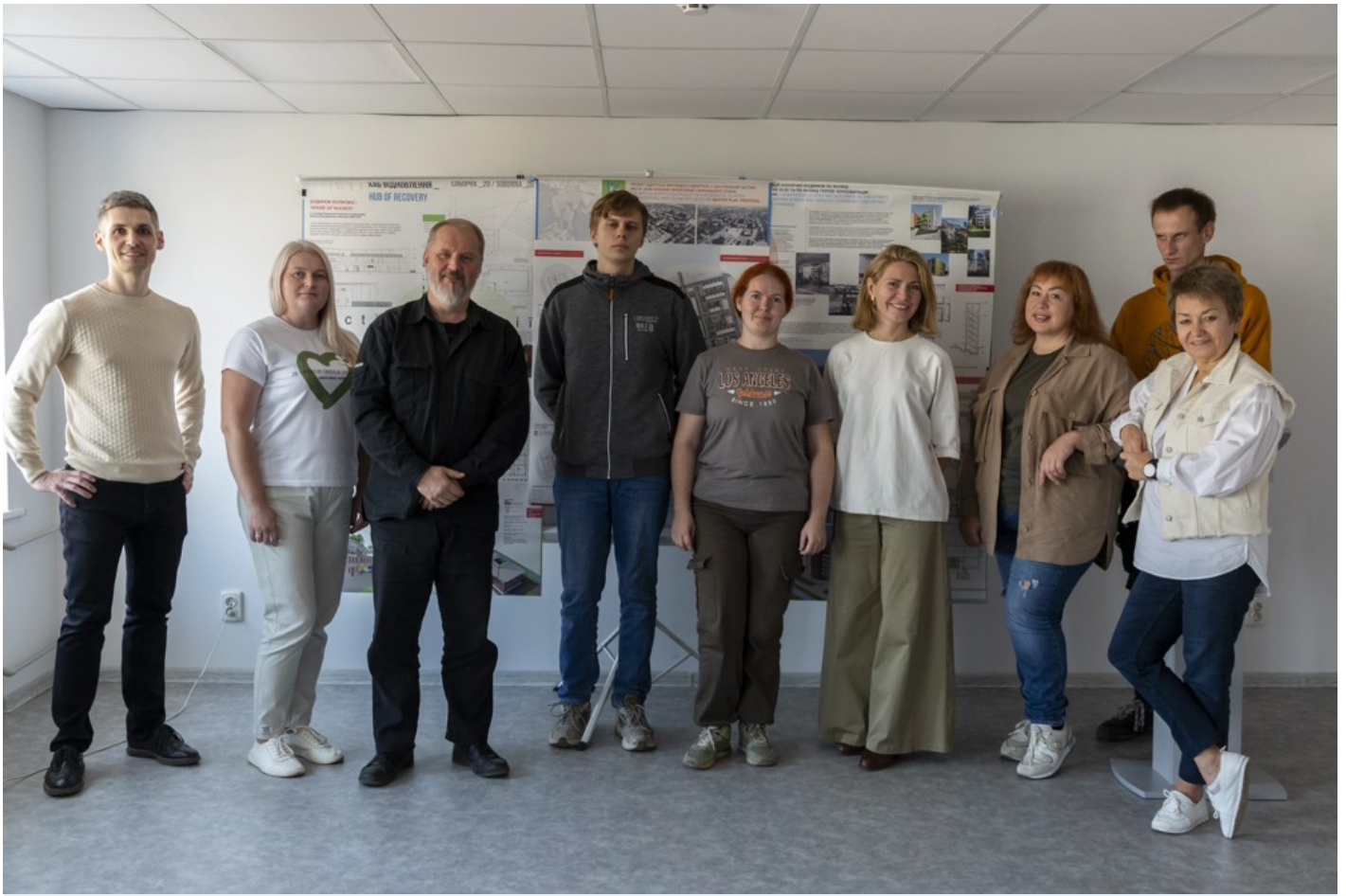
Ескізний проєкт адаптації житлового кварталу в центральній частині міста Ізюм