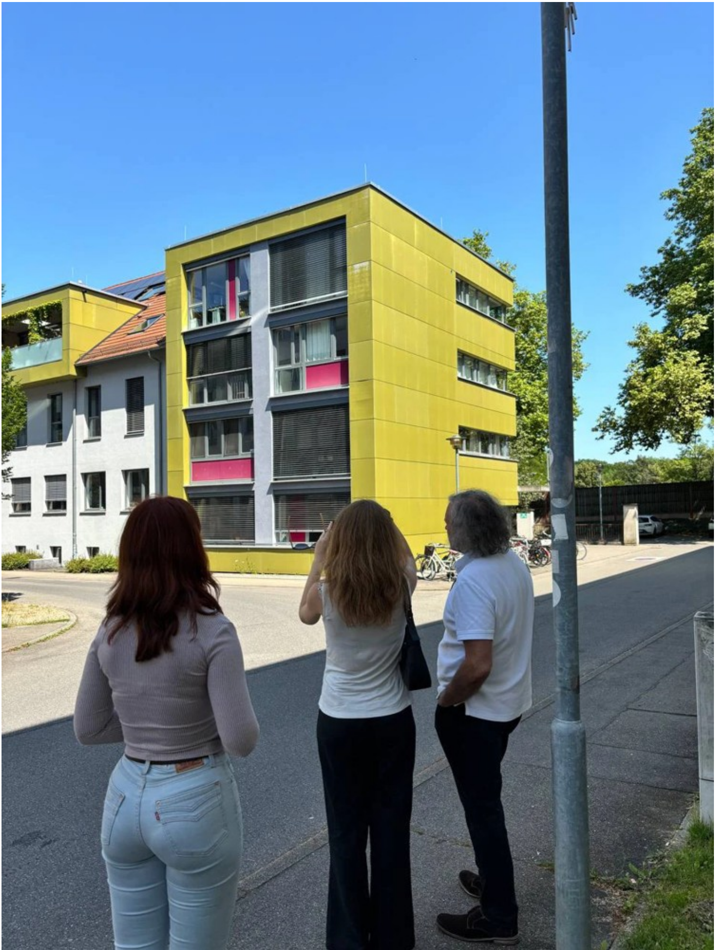
Ескізний проект адаптації житлового кварталу в центральній частині міста Ізюм