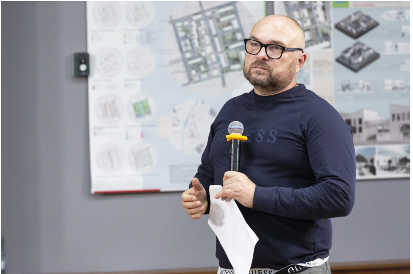
Ескізний проект адаптації житлового кварталу в центральній частині міста Ізюм