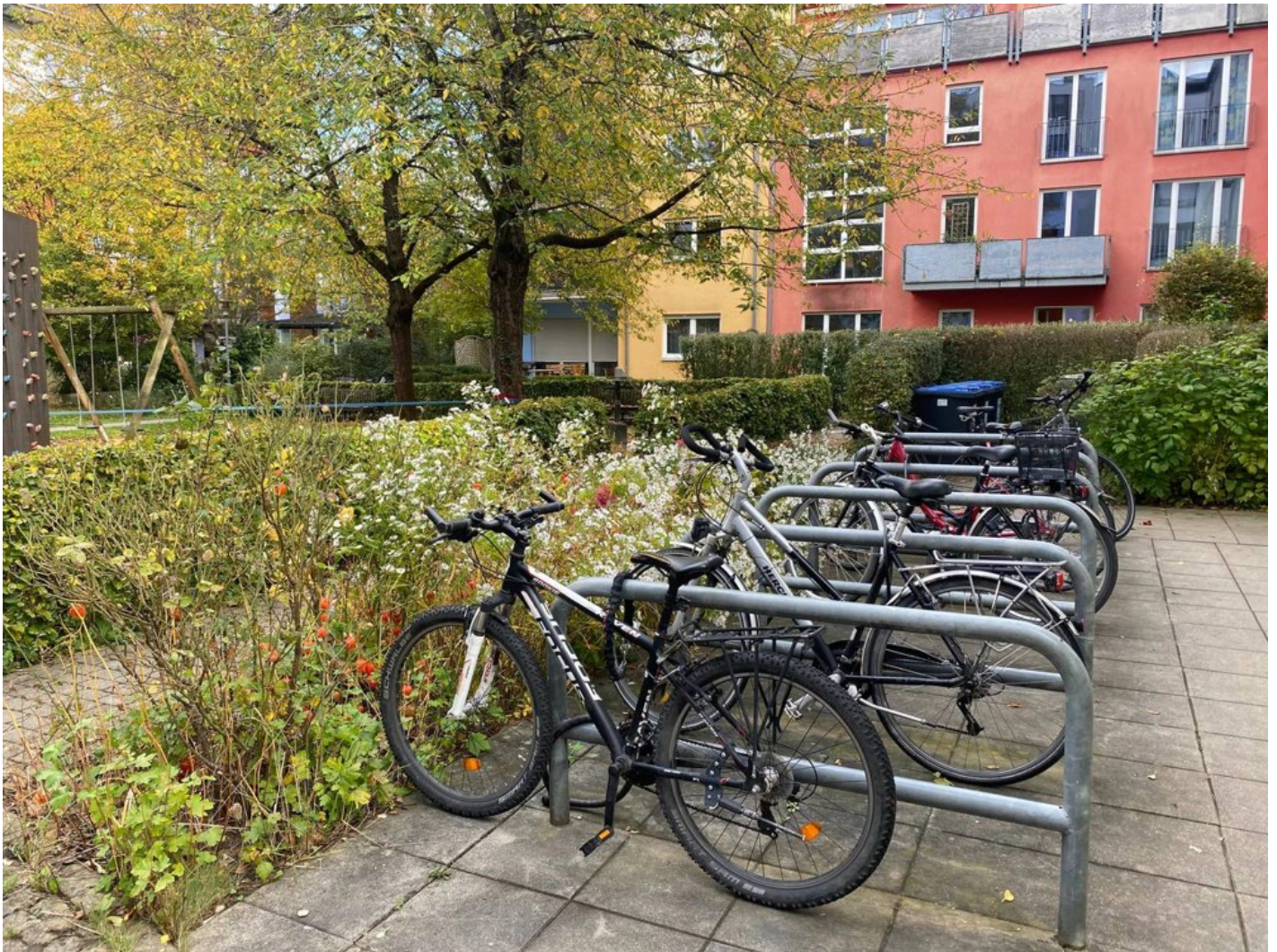
Ескізний проект адаптації житлового кварталу в центральній частині міста Ізюм