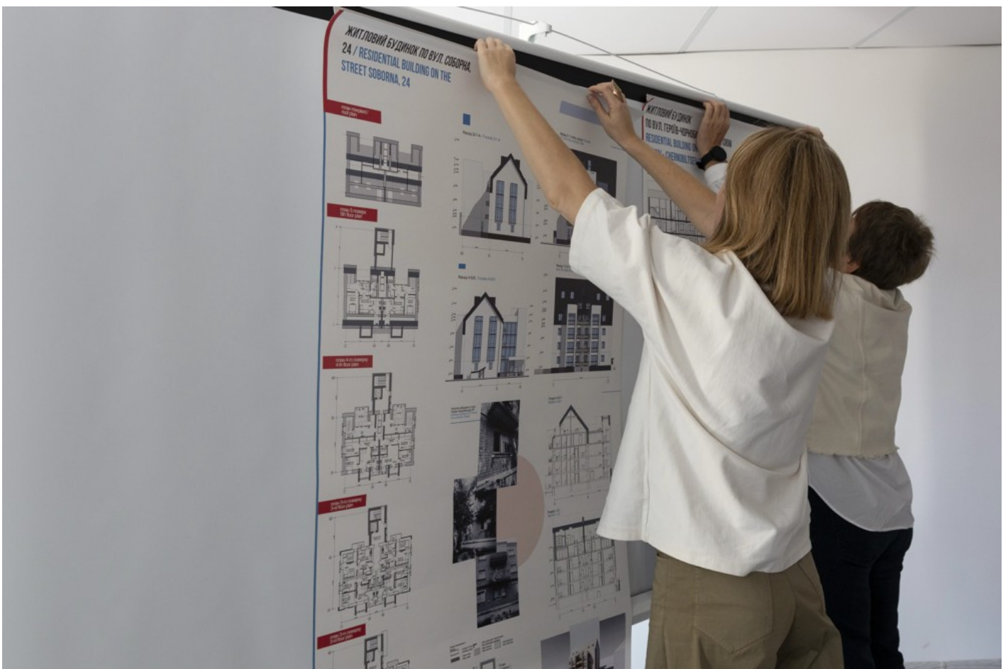
Ескізний проект адаптації житлового кварталу в центральній частині міста Ізіум