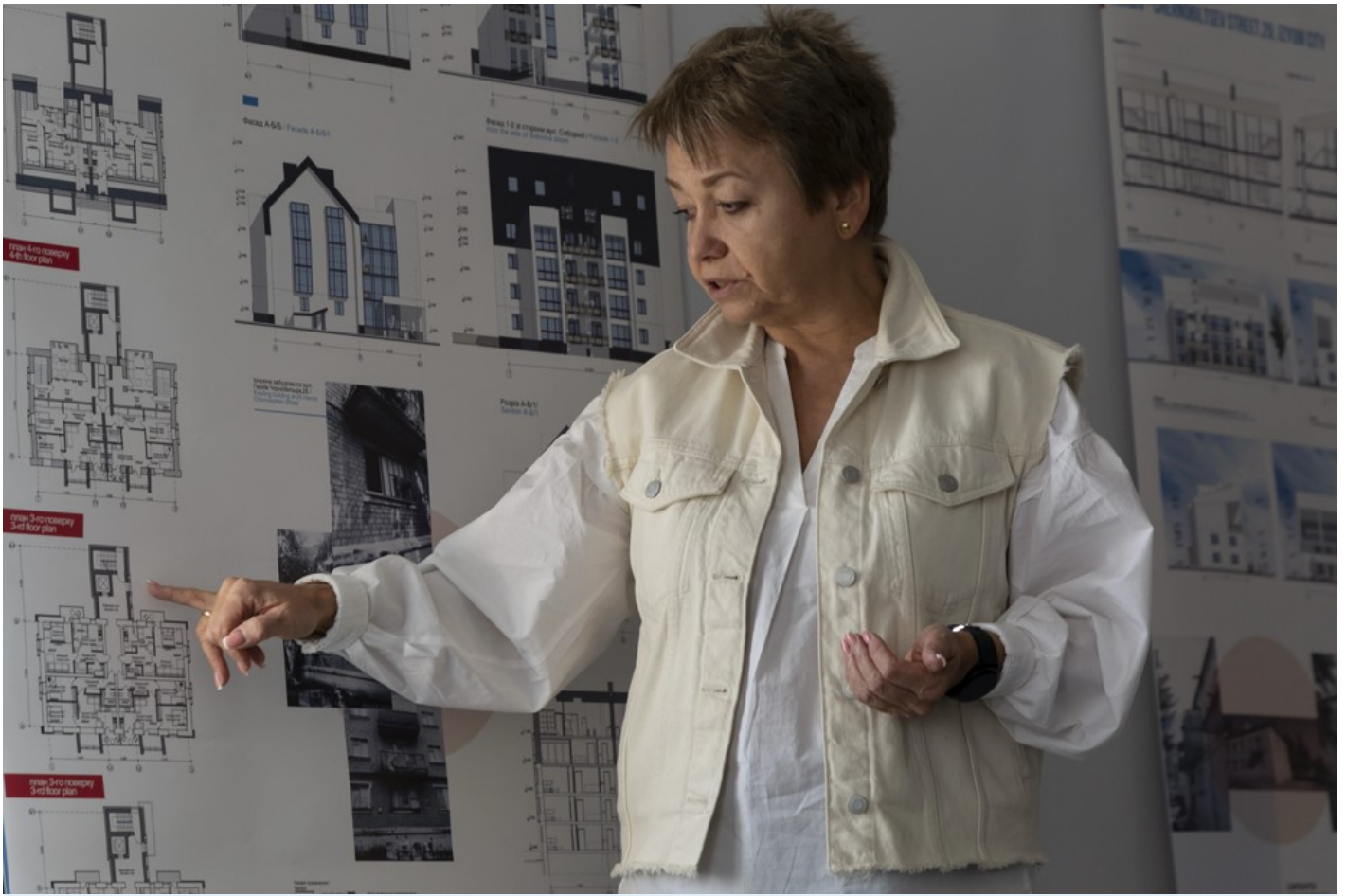
Ескізний проєкт адаптації житлового кварталу в центральній частині міста Ізюм