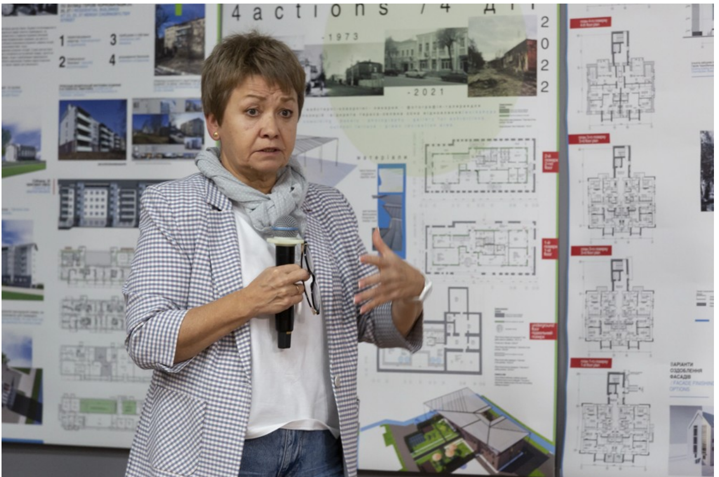
Ескізний проект адаптації житлового кварталу в центральній частині міста Ізюм