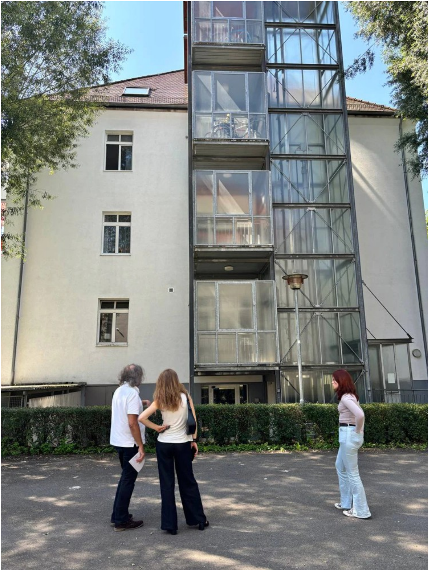
Ескізний проєкт адаптації житлового кварталу в центральній частині міста Ізюм