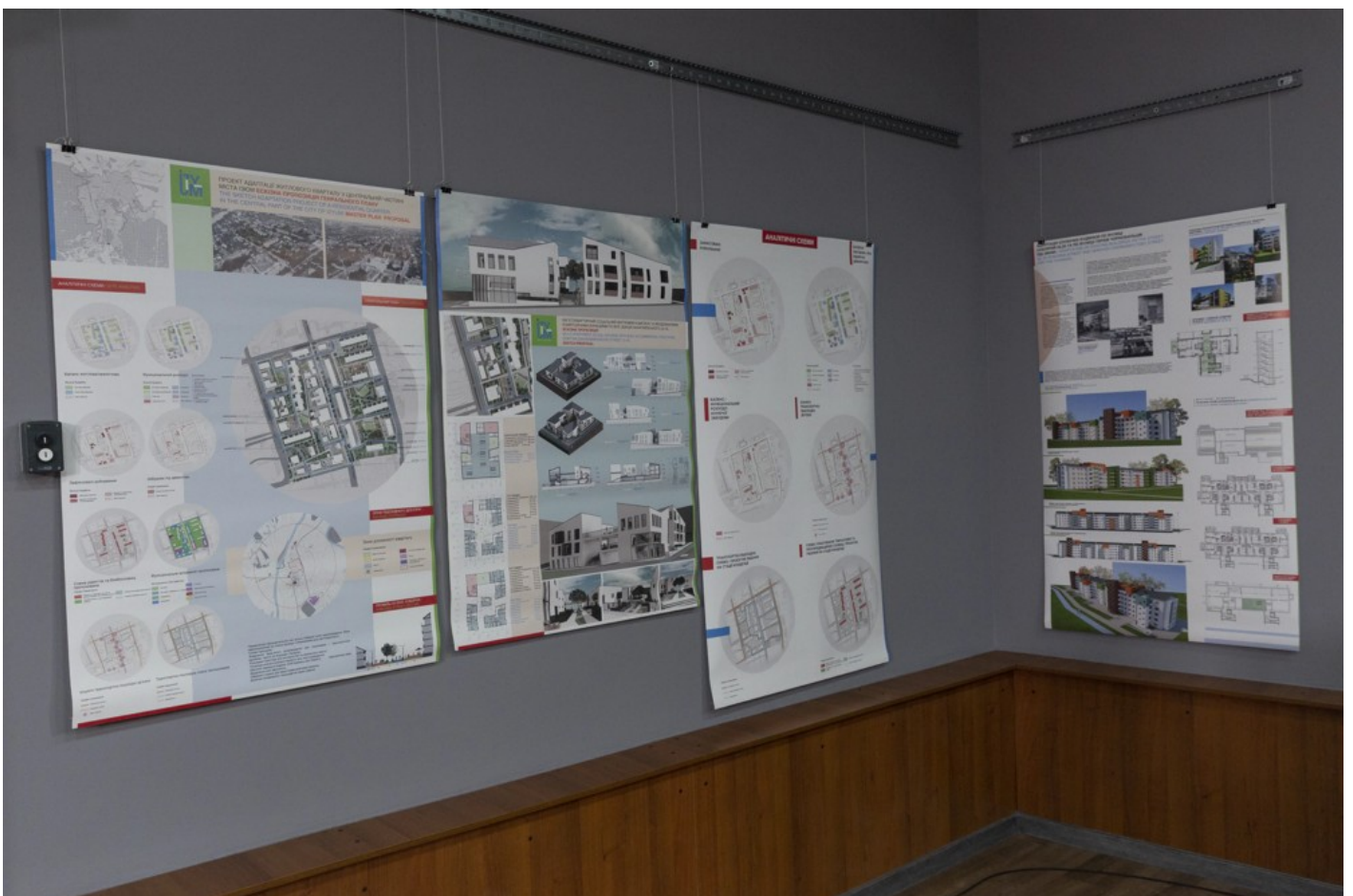
Ескізний проект адаптації житлового кварталу в центральній частині міста Ізюм