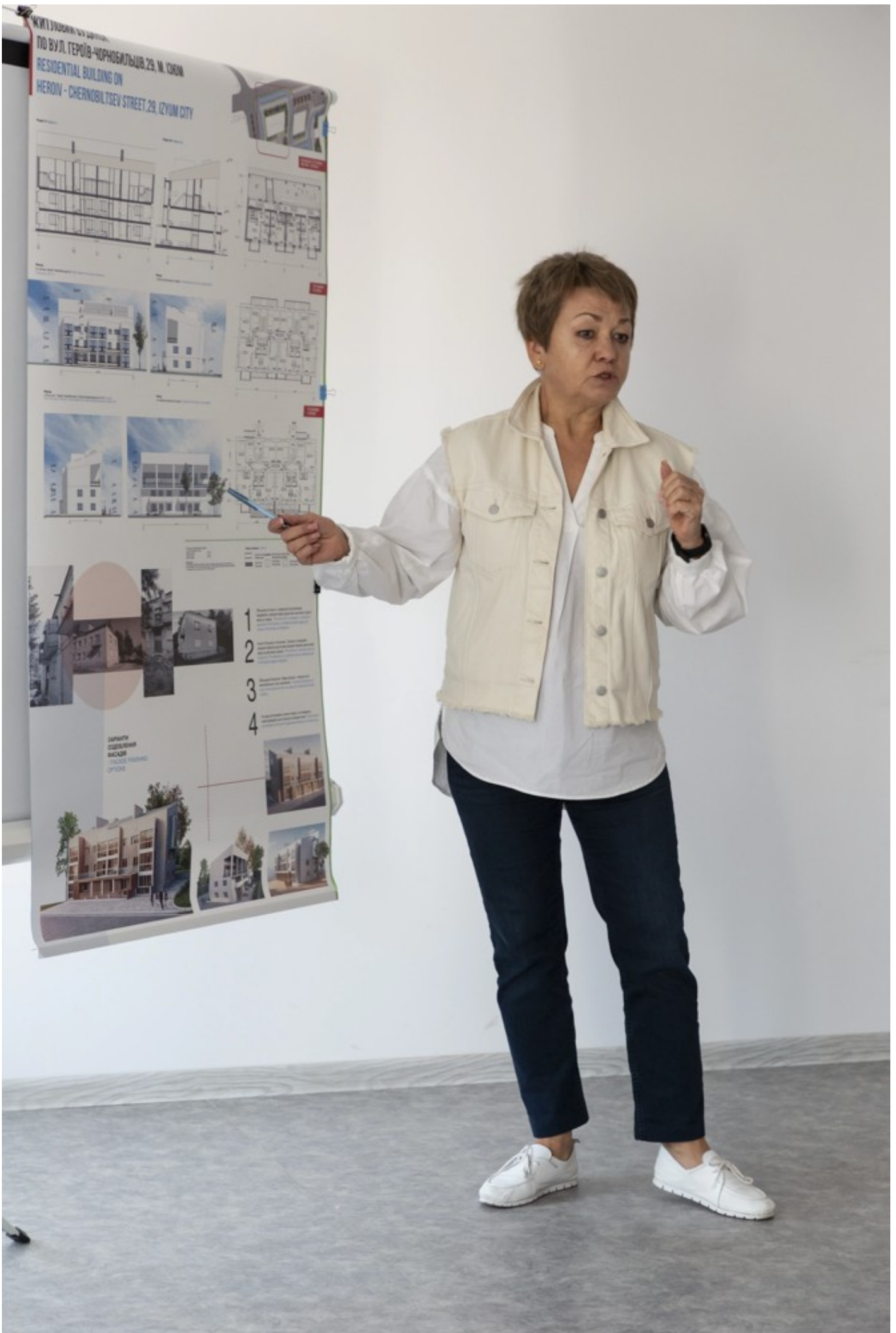
Ескізний проект адаптації житлового кварталу в центральній частині міста Ізюм