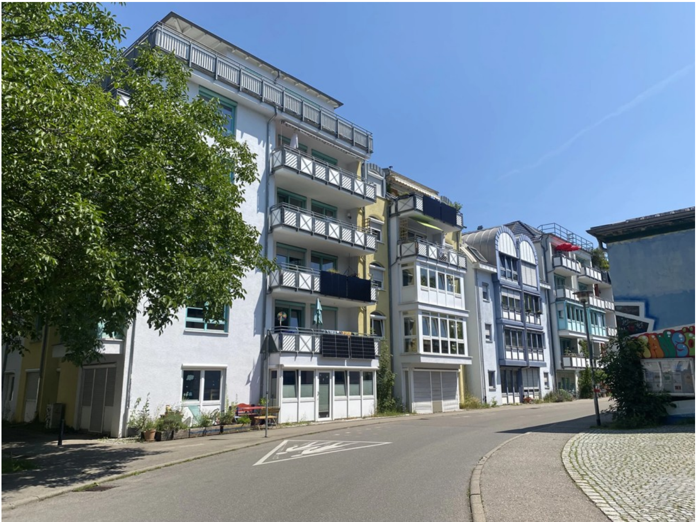
Ескізний проект адаптації житлового кварталу в центральній частині міста Ізюм