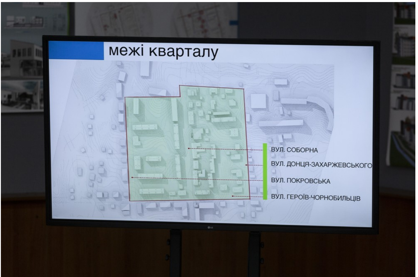
Ескізний проєкт адаптації житлового кварталу в центральній частині міста Ізюм