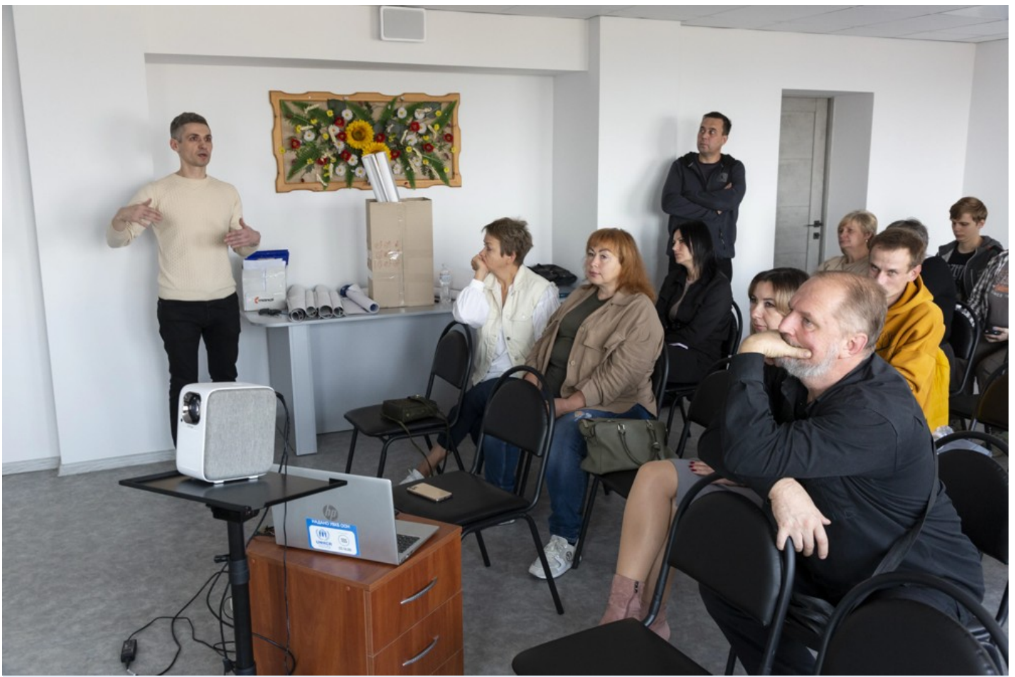
Ескізний проект адаптації житлового кварталу в центральній частині міста Ізюм