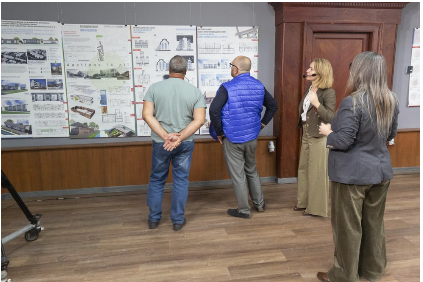
Ескізний проєкт адаптації житлового кварталу в центральній частині міста Ізюм