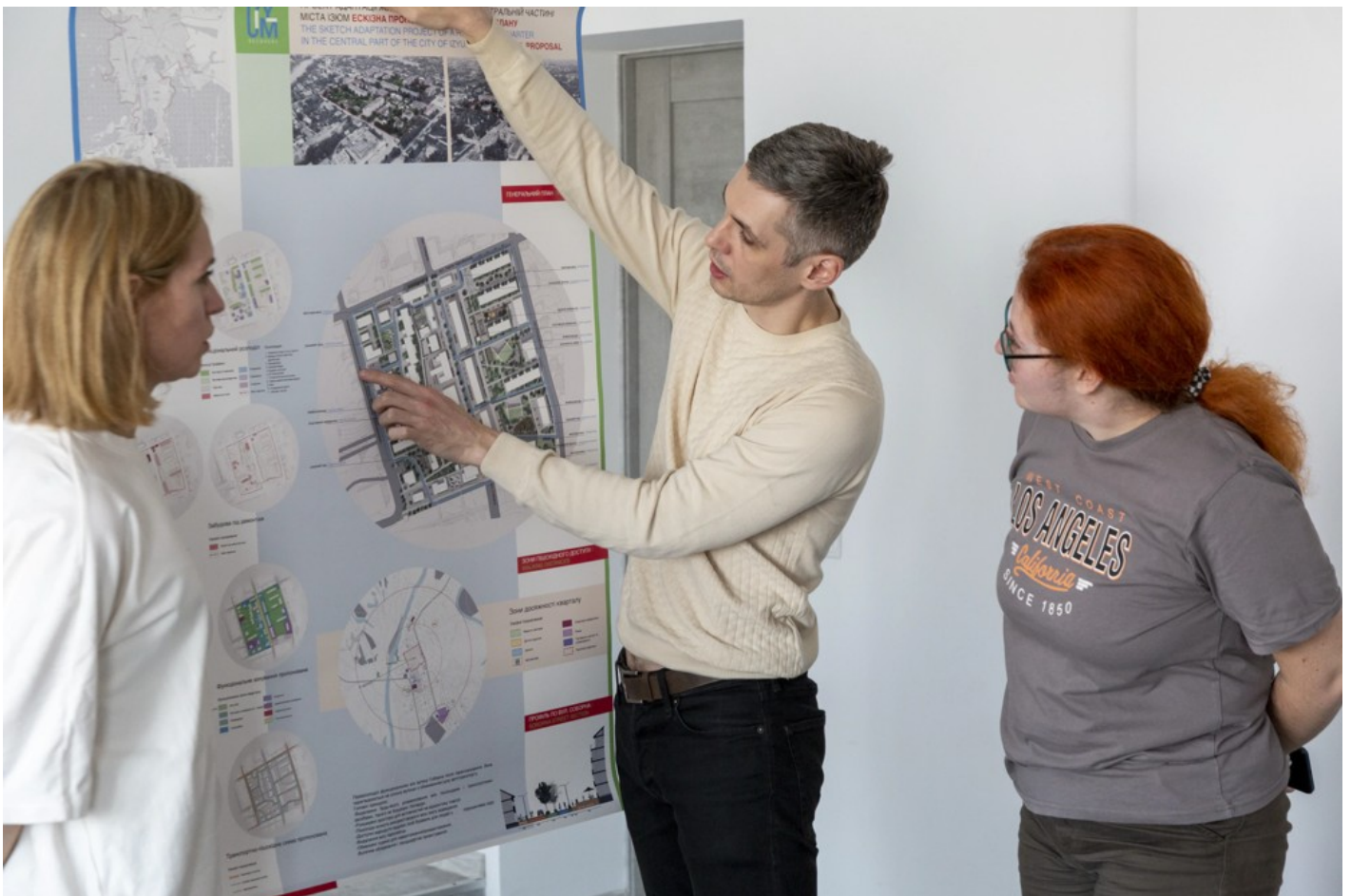
Ескізний проект адаптації житлового кварталу в центральній частині міста Ізюм