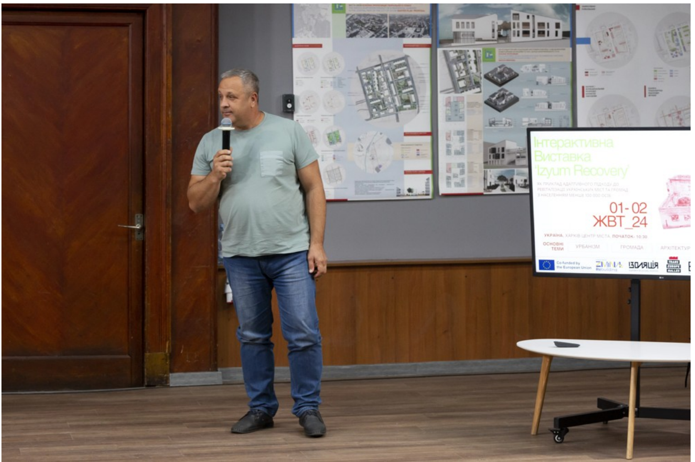
Ескізний проєкт адаптації житлового кварталу в центральній частині міста Ізюм