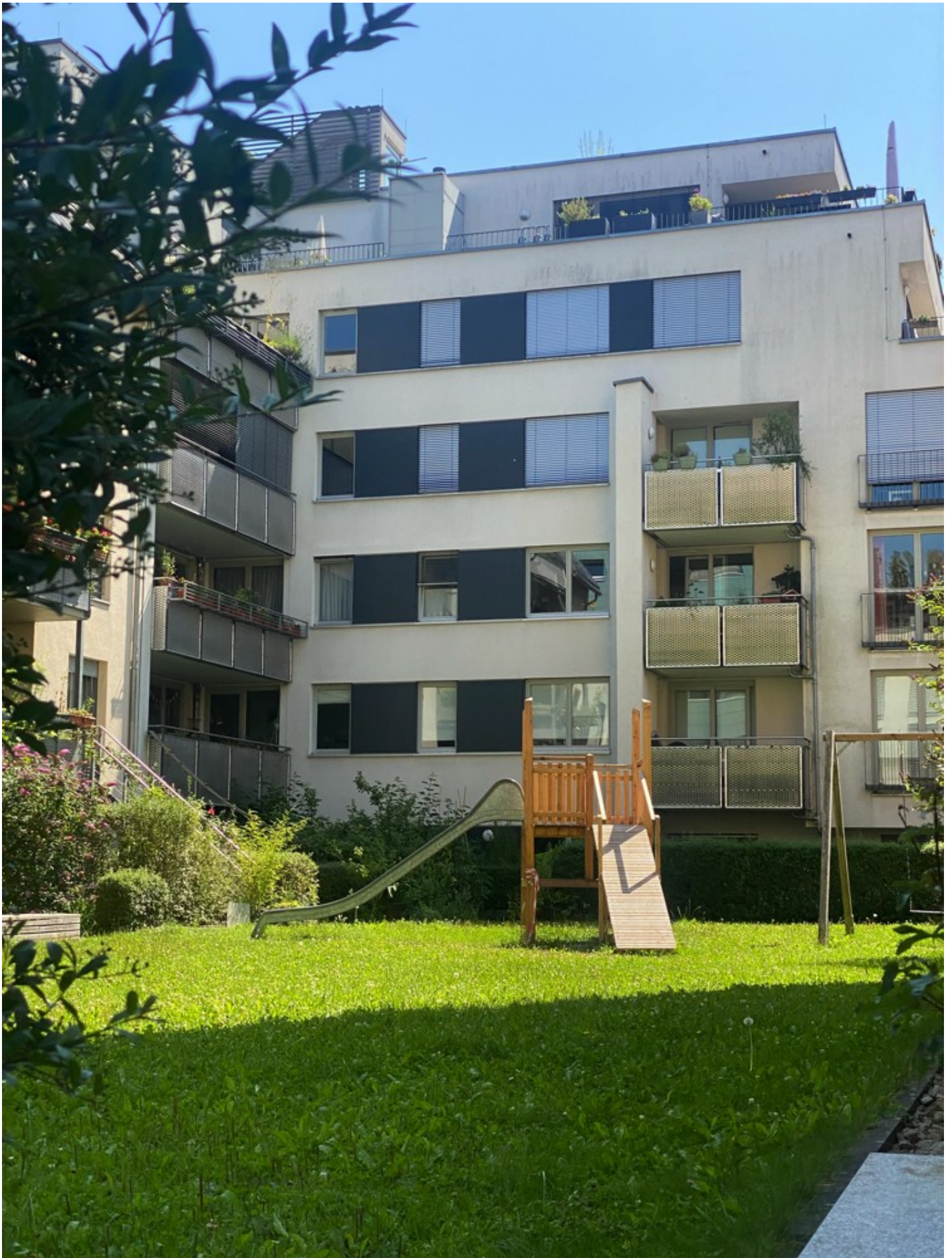
Ескізний проект адаптації житлового кварталу в центральній частині міста Ізюм