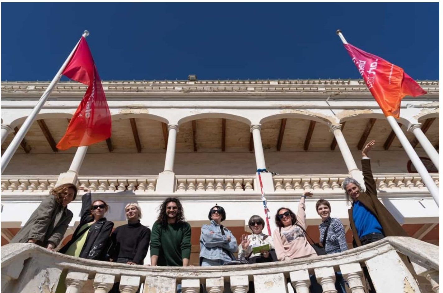
Український павільйон на Мальтійській бієнале 2024