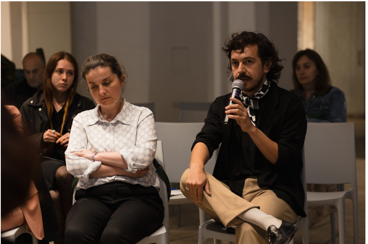
Український павільйон на Мальтійській бієнале 2024