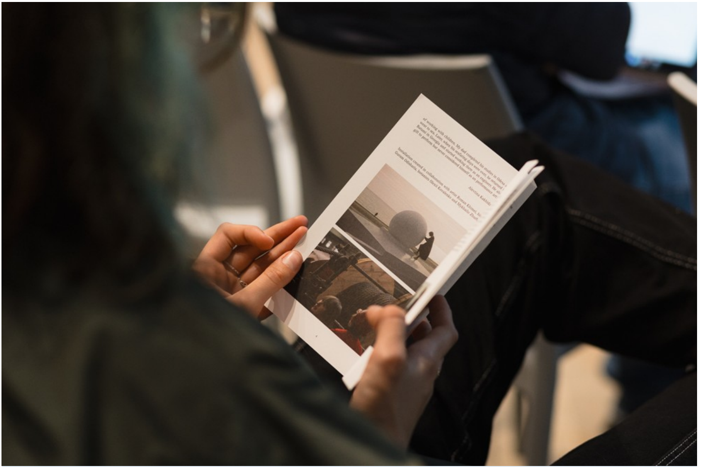
Український павільйон на Мальтійській бієнале 2024