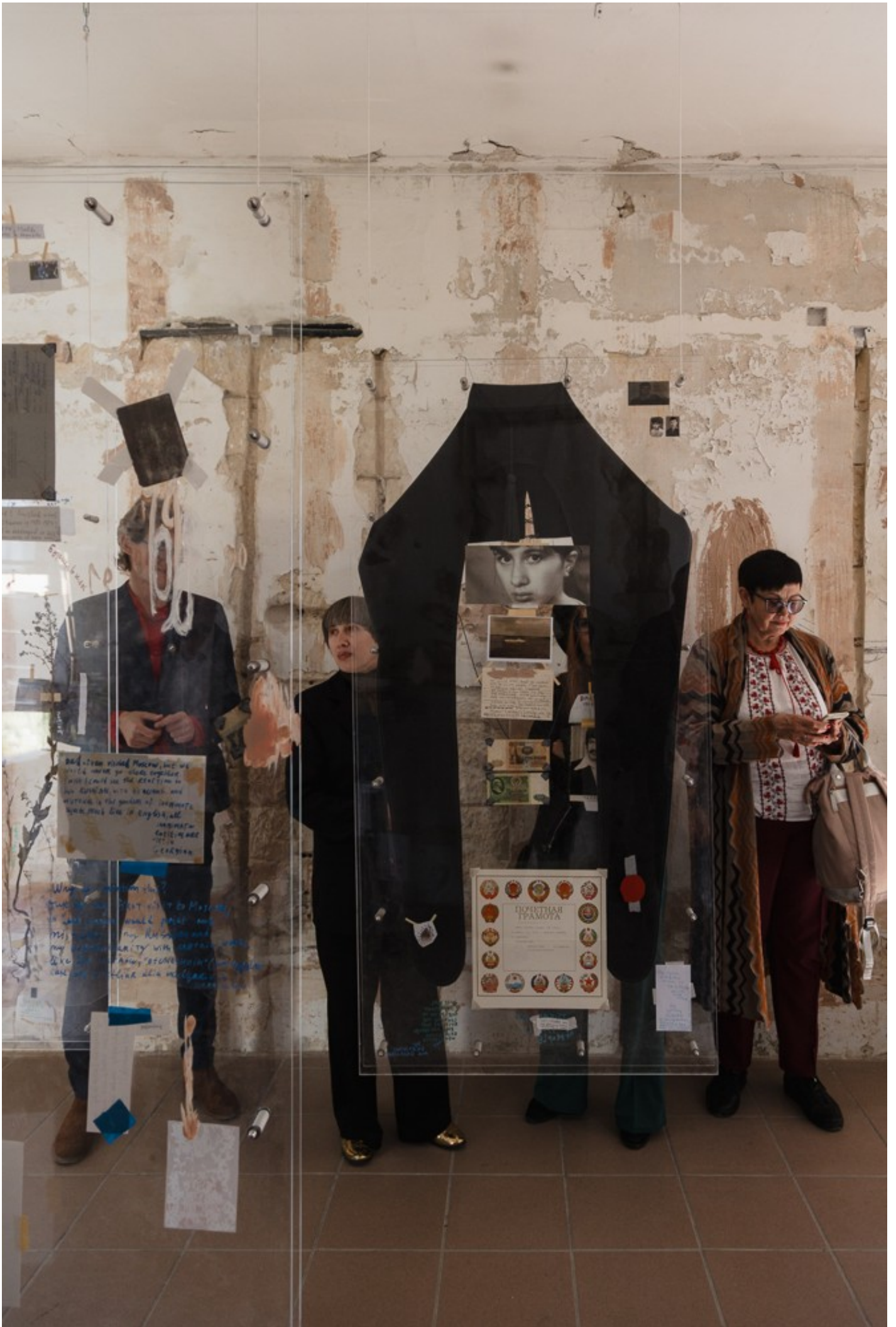
Український павільйон на Мальтійській бієнале 2024