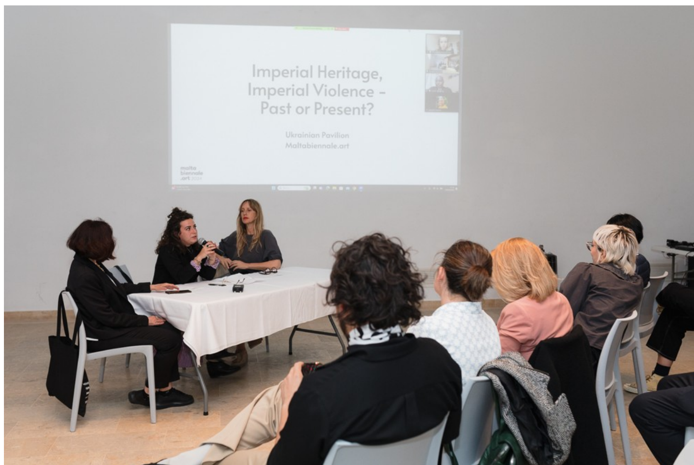
Український павільйон на Мальтійській бієнале 2024