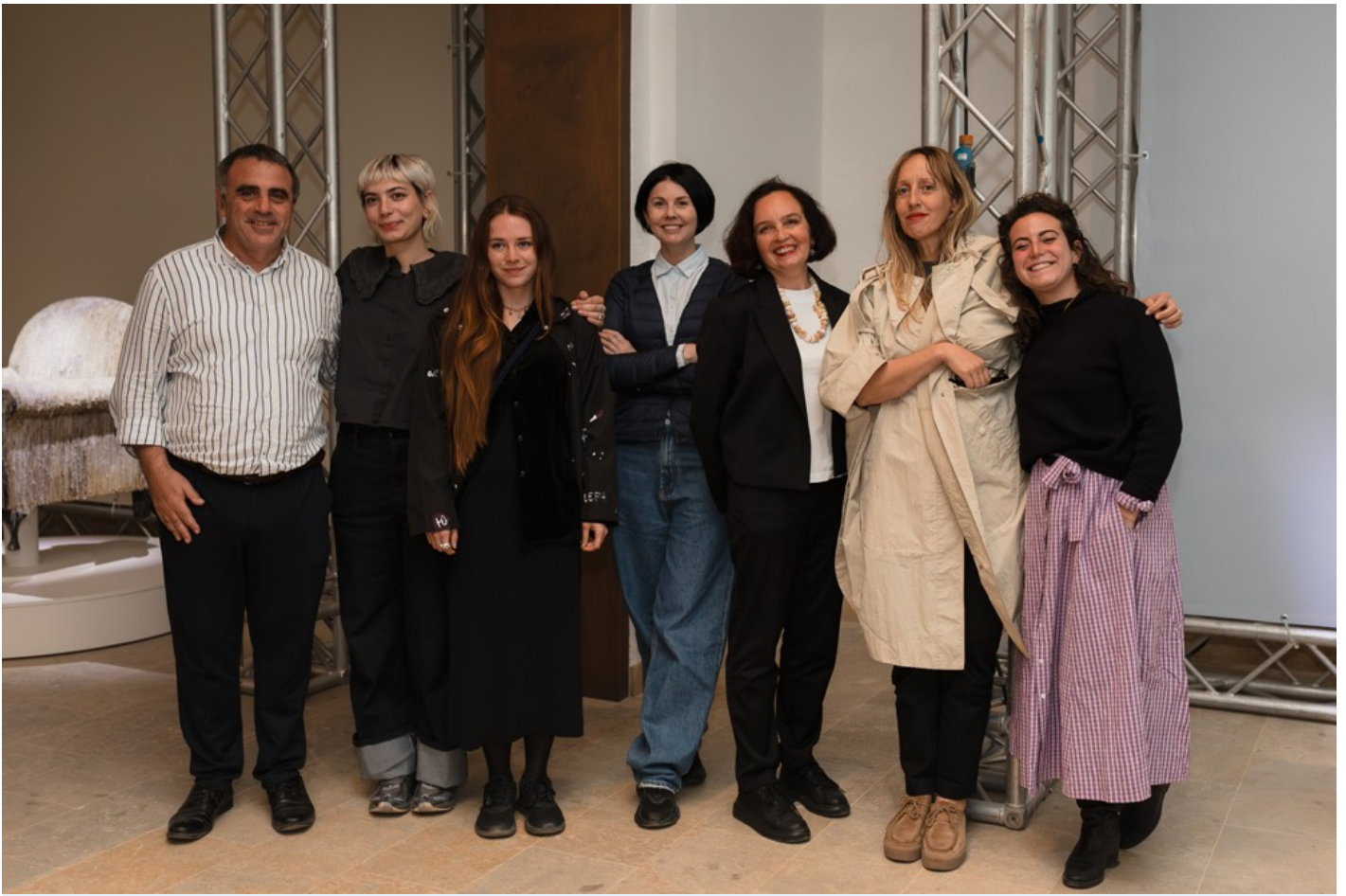
Український павільон на Мальтійській бієнале 2024