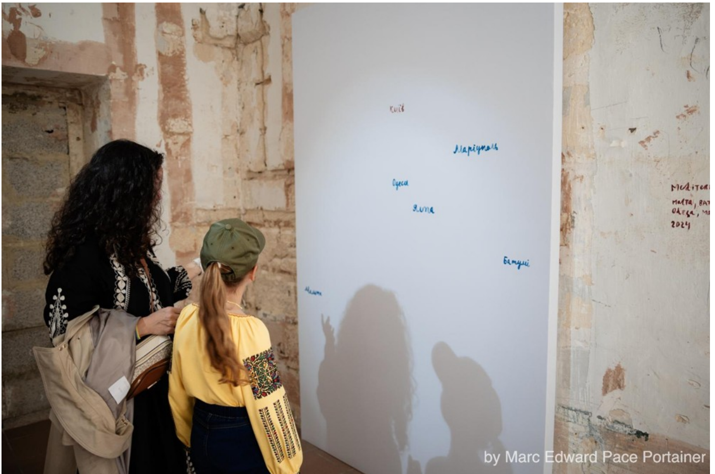
Український павільйон на Мальтійській бієнале 2024