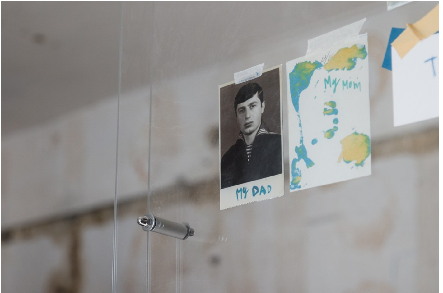
Український павільйон на Мальтійській бієнале 2024