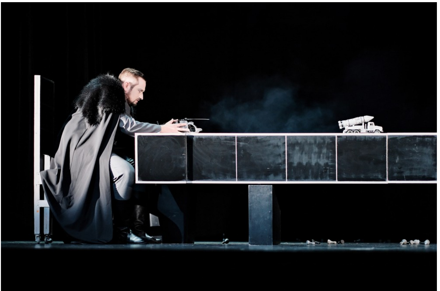
"Біла пошесть": Фантастичний реалізм воєнного часу