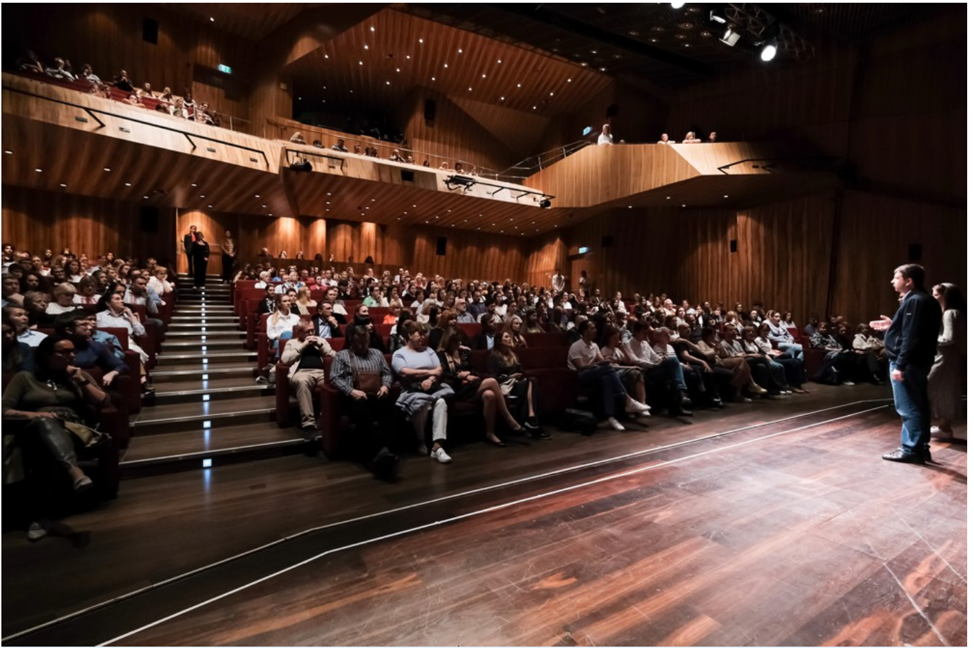
"Біла пошесть": Фантастичний реалізм воєнного часу