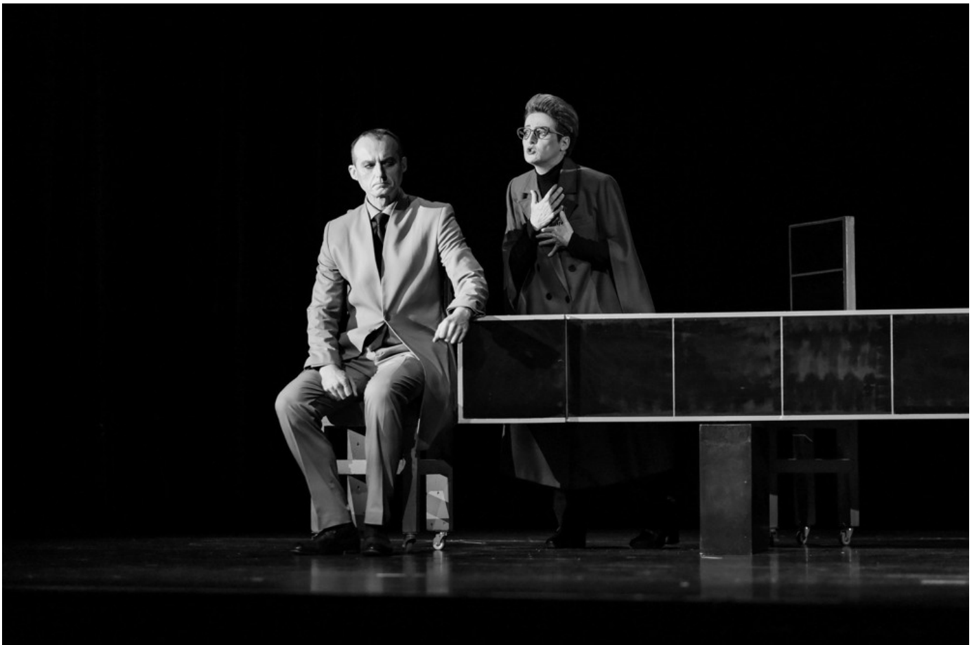
"Біла пошесть": Фантастичний реалізм воєнного часу