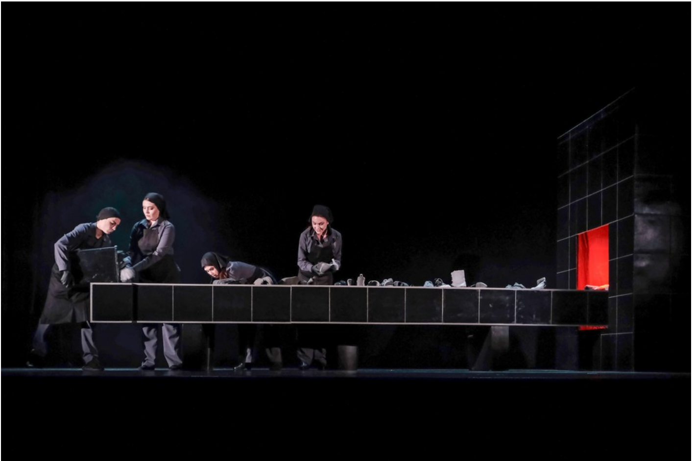
"Біла пошесть": Фантастичний реалізм воєнного часу