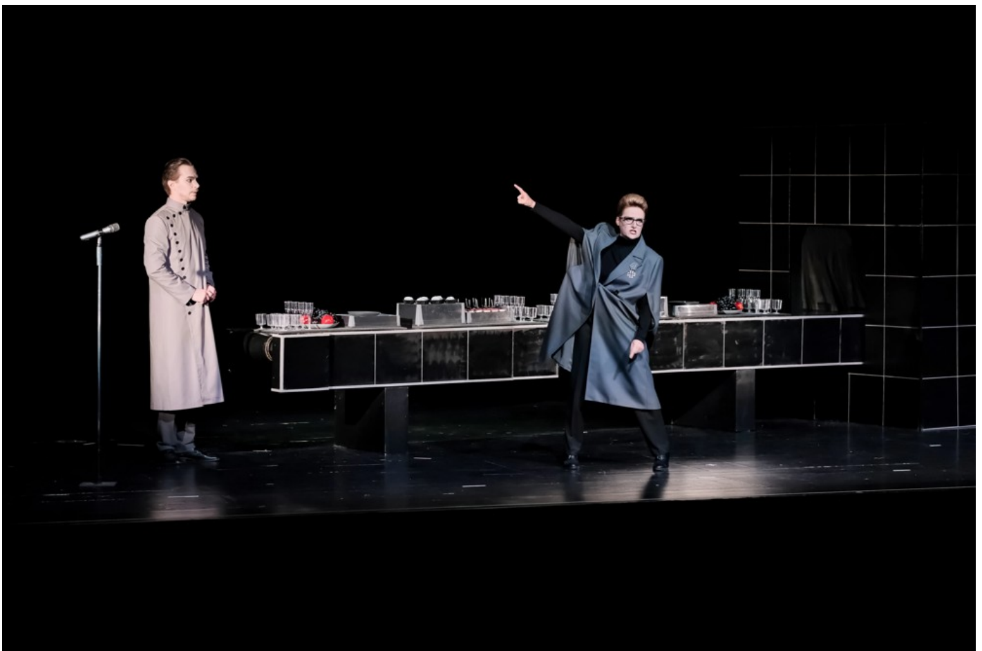
"Біла пошесть": Фантастичний реалізм воєнного часу