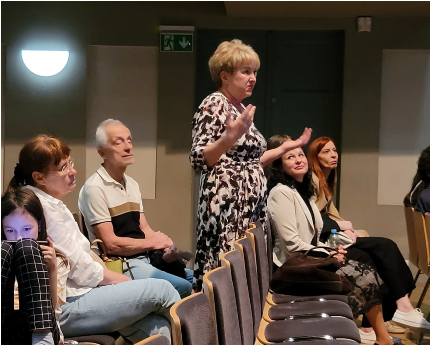
"Біла пошесть": Фантастичний реалізм воєнного часу