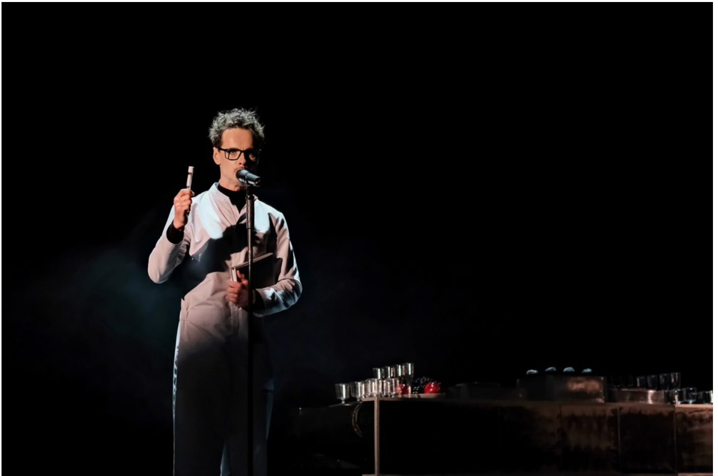
"Біла пошесть": Фантастичний реалізм воєнного часу