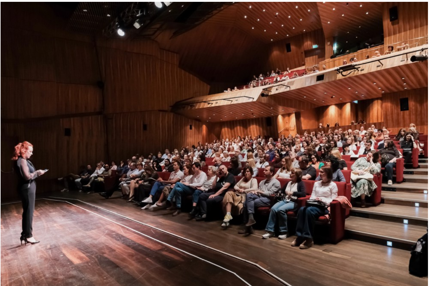
"Біла пошесть": Фантастичний реалізм воєнного часу