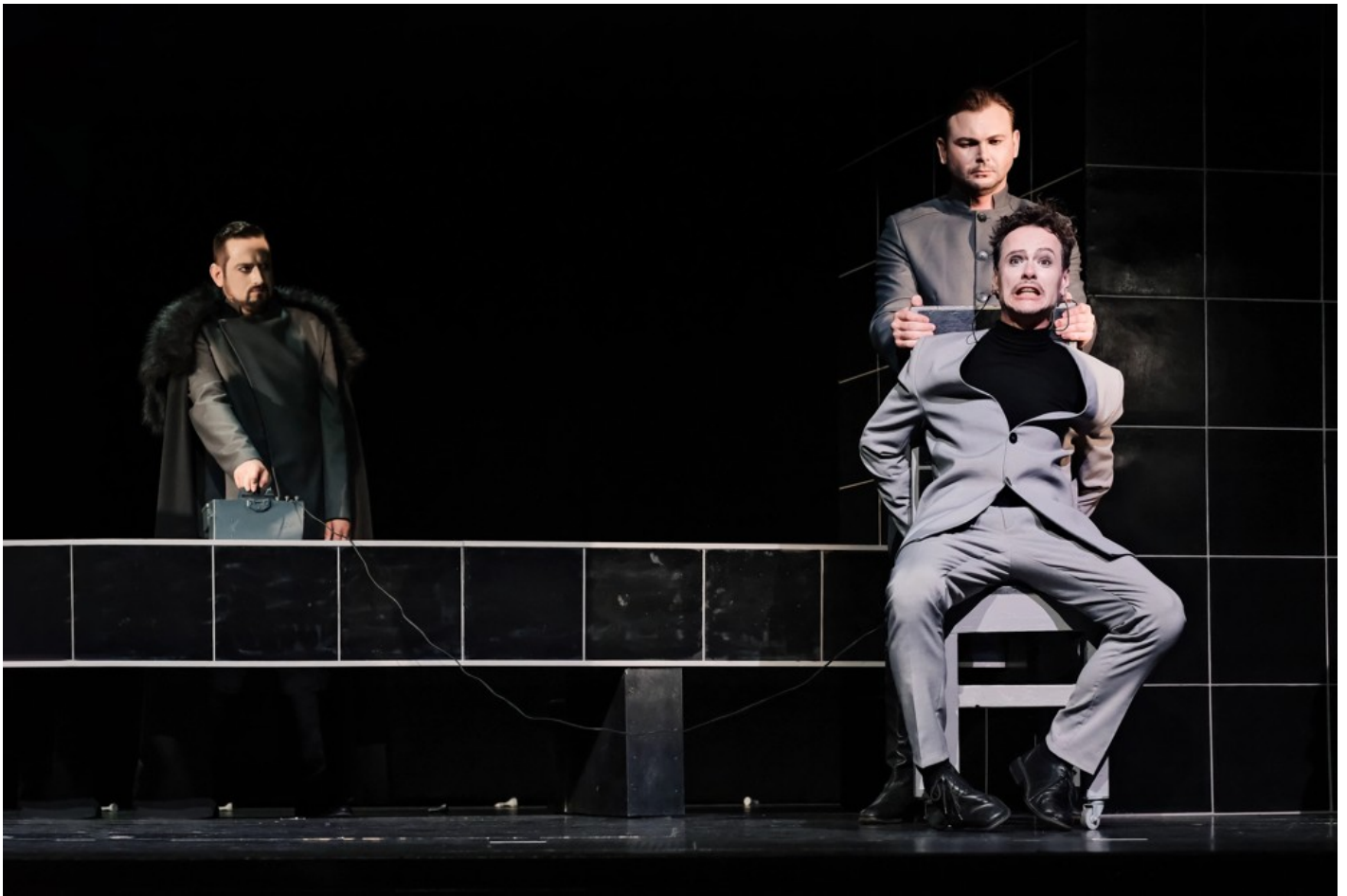
"Біла пошесть": Фантастичний реалізм воєнного часу