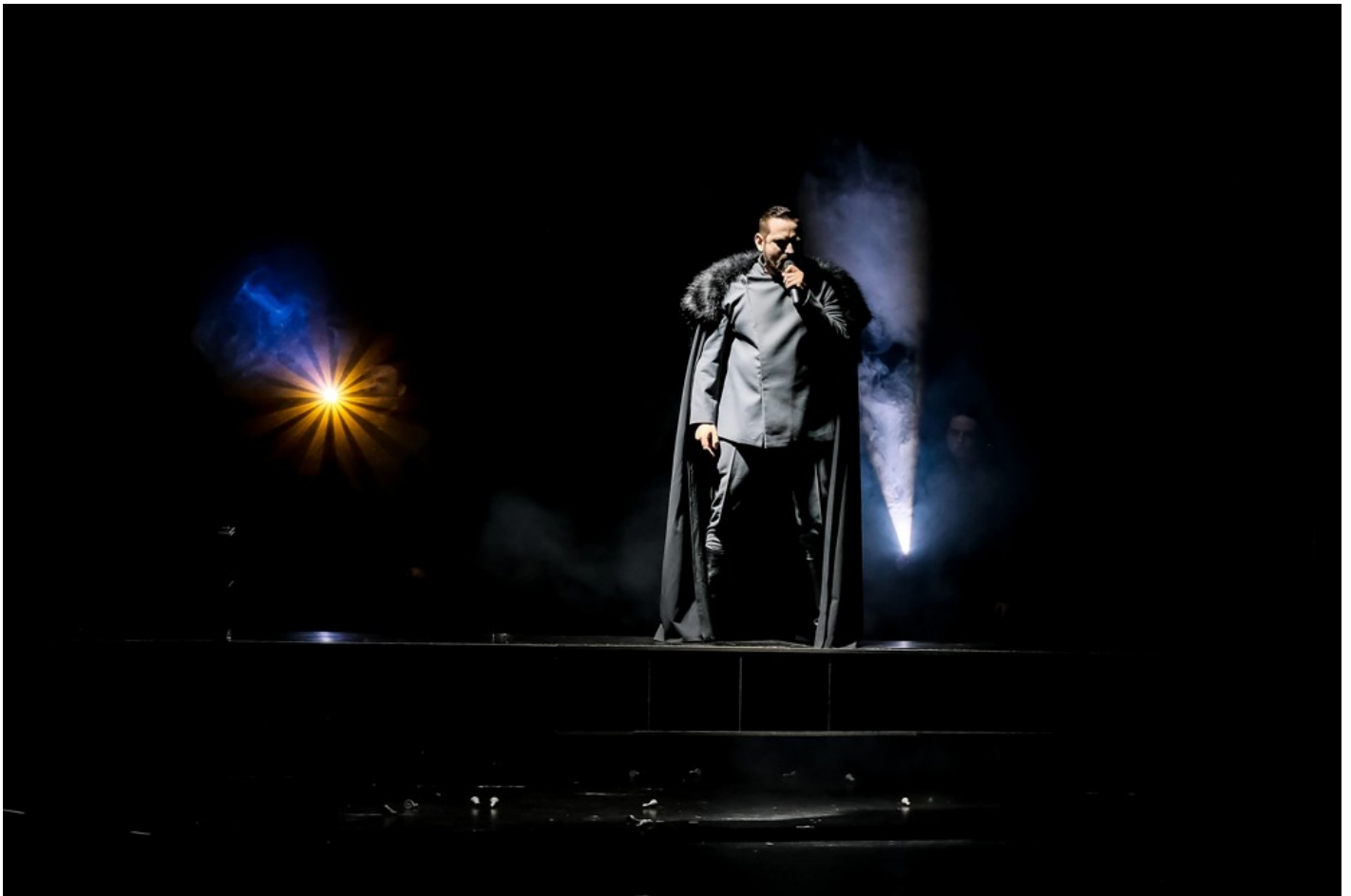
"Біла пошесть": Фантастичний реалізм воєнного часу