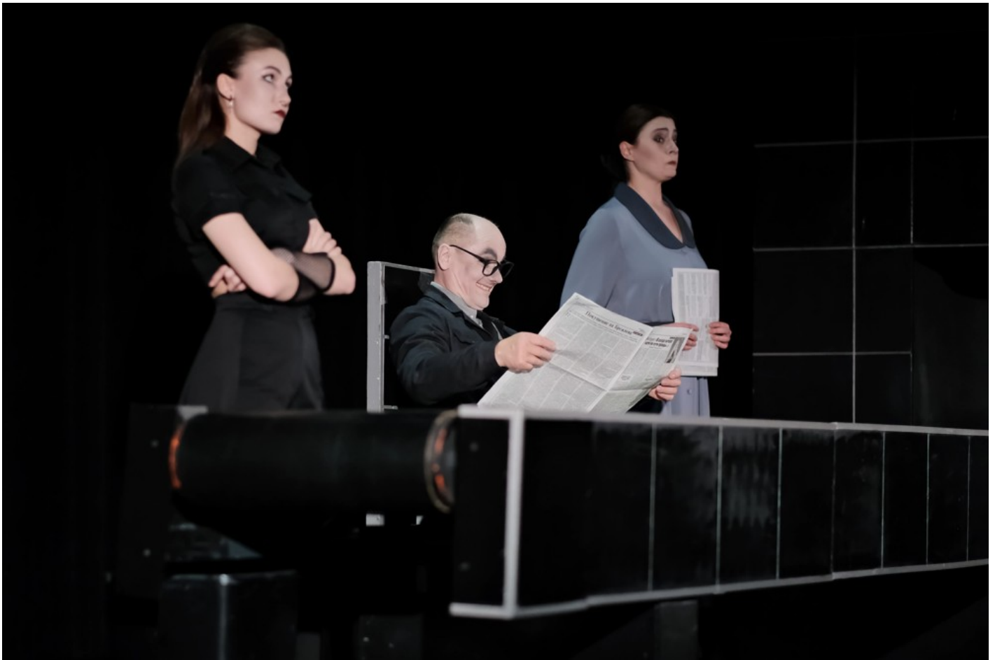
"Біла пошесть": Фантастичний реалізм воєнного часу