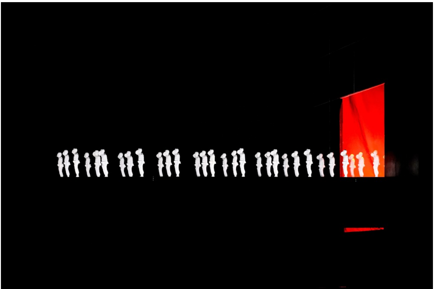
"Біла пошесть": Фантастичний реалізм воєнного часу