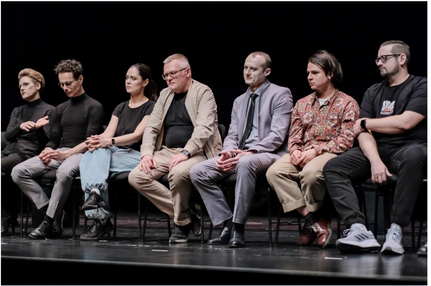
"Біла пошесть": Фантастичний реалізм воєнного часу