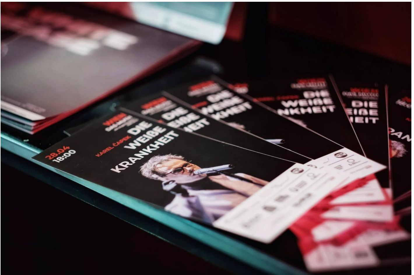
"Біла пошесть": Фантастичний реалізм воєнного часу