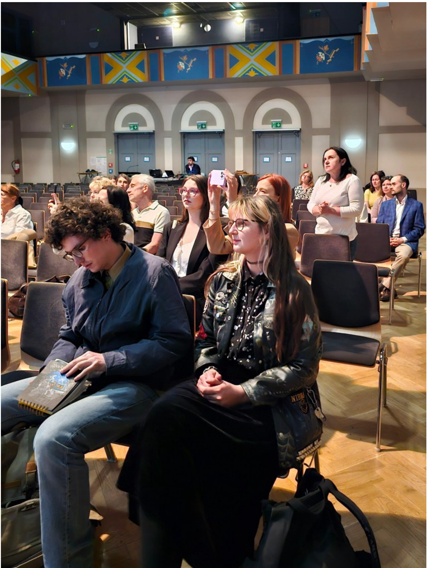
"Біла пошесть": Фантастичний реалізм воєнного часу