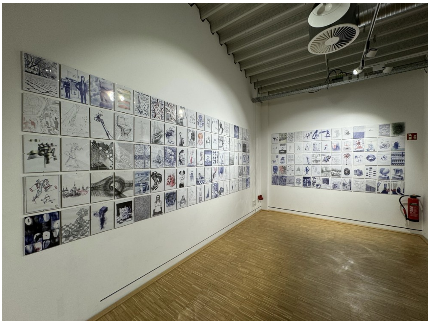
The Ukrainian Diary