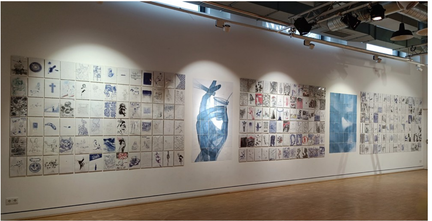
The Ukrainian Diary