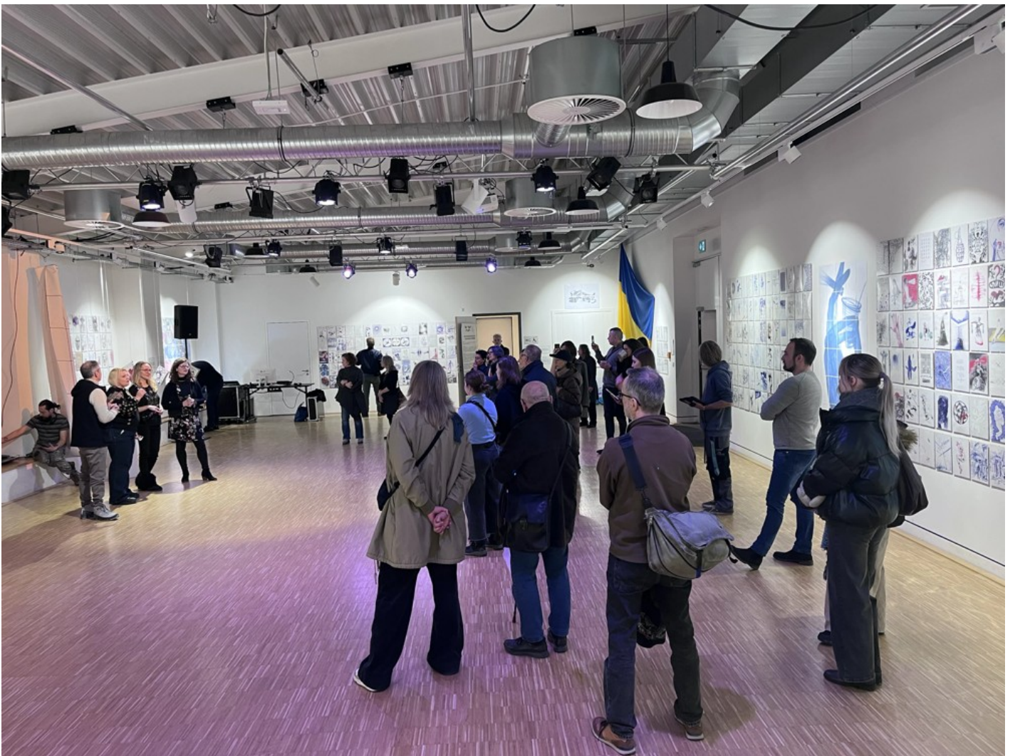
The Ukrainian Diary