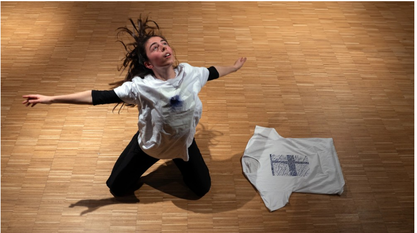
The Ukrainian Diary