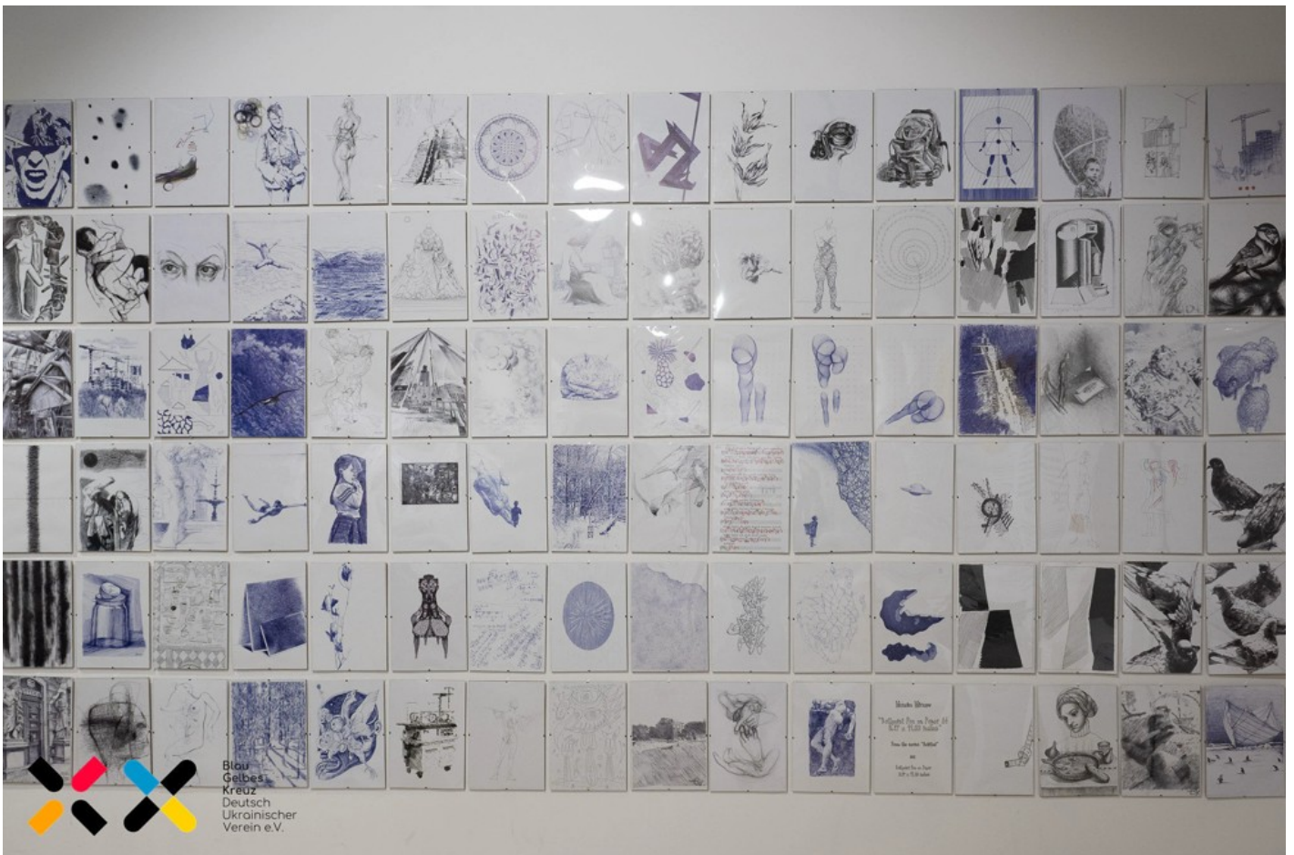
The Ukrainian Diary