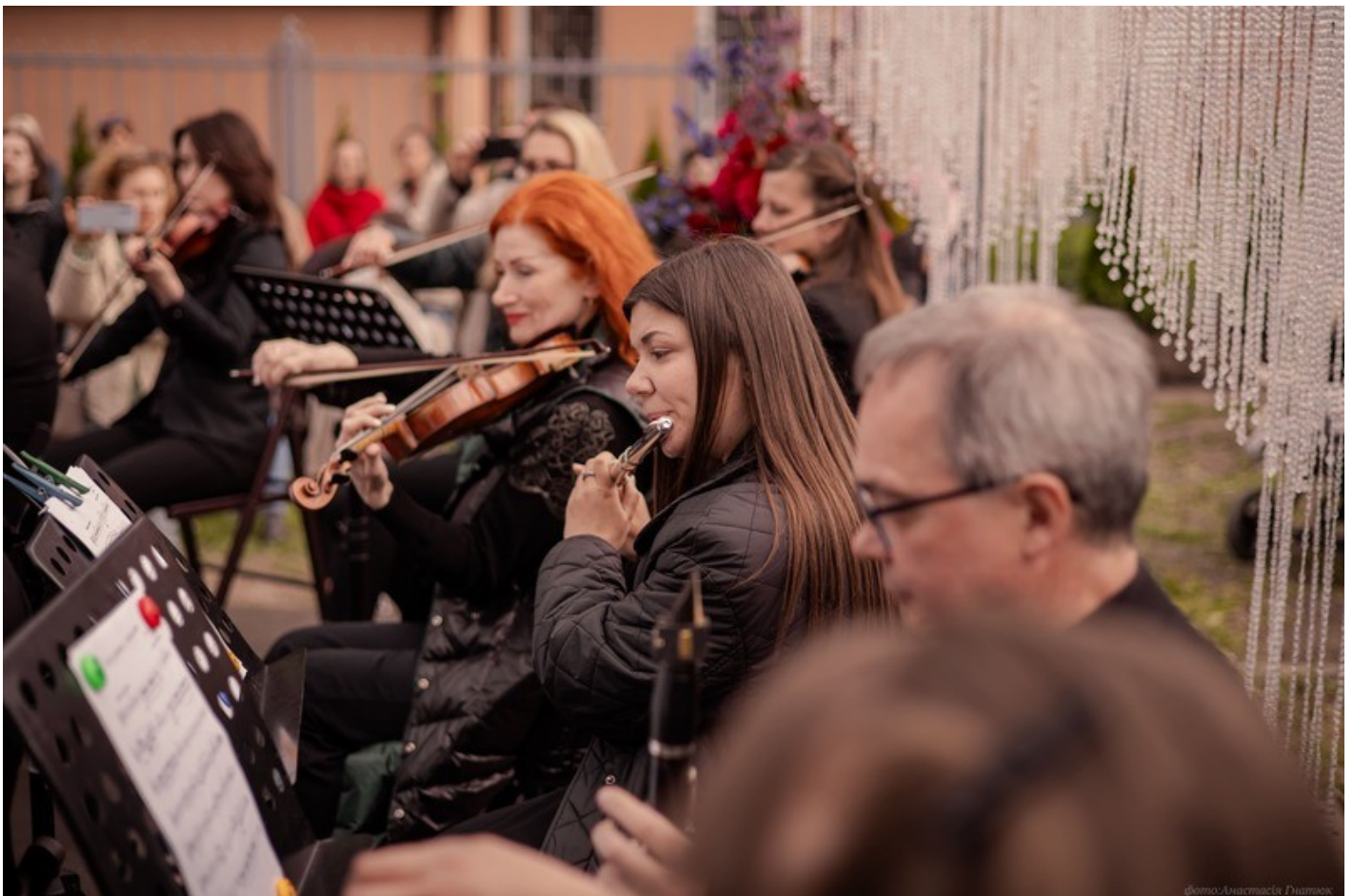
The Gothic Garden of the Organ Hall - a new cultural space in Rivne as an ecological renovation of the territory of the architectural monument