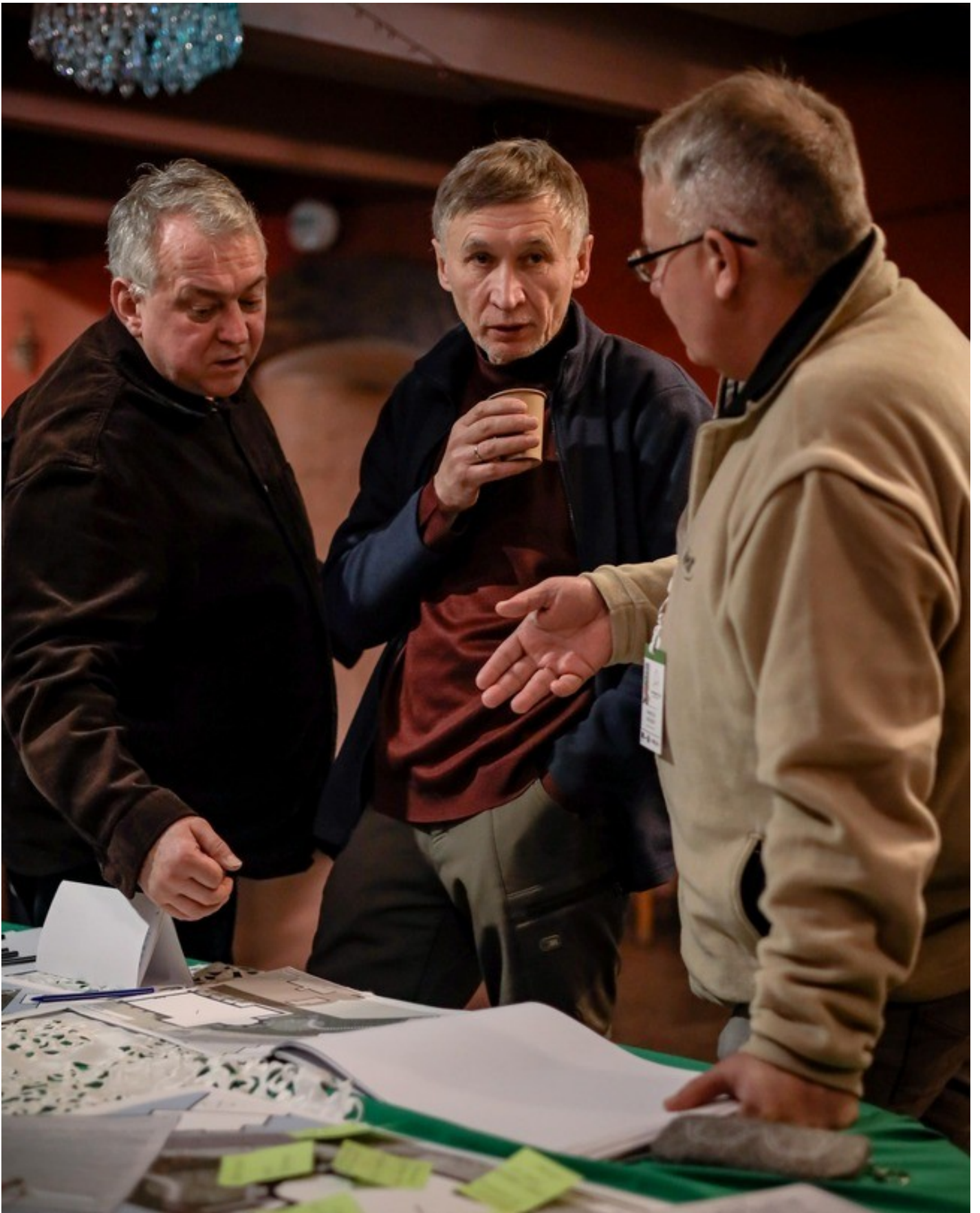
The Gothic Garden of the Organ Hall - a new cultural space in Rivne as an ecological renovation of the territory of the architectural monument