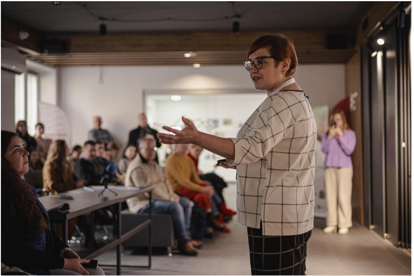
The Gothic Garden of the Organ Hall - a new cultural space in Rivne as an ecological renovation of the territory of the architectural monument