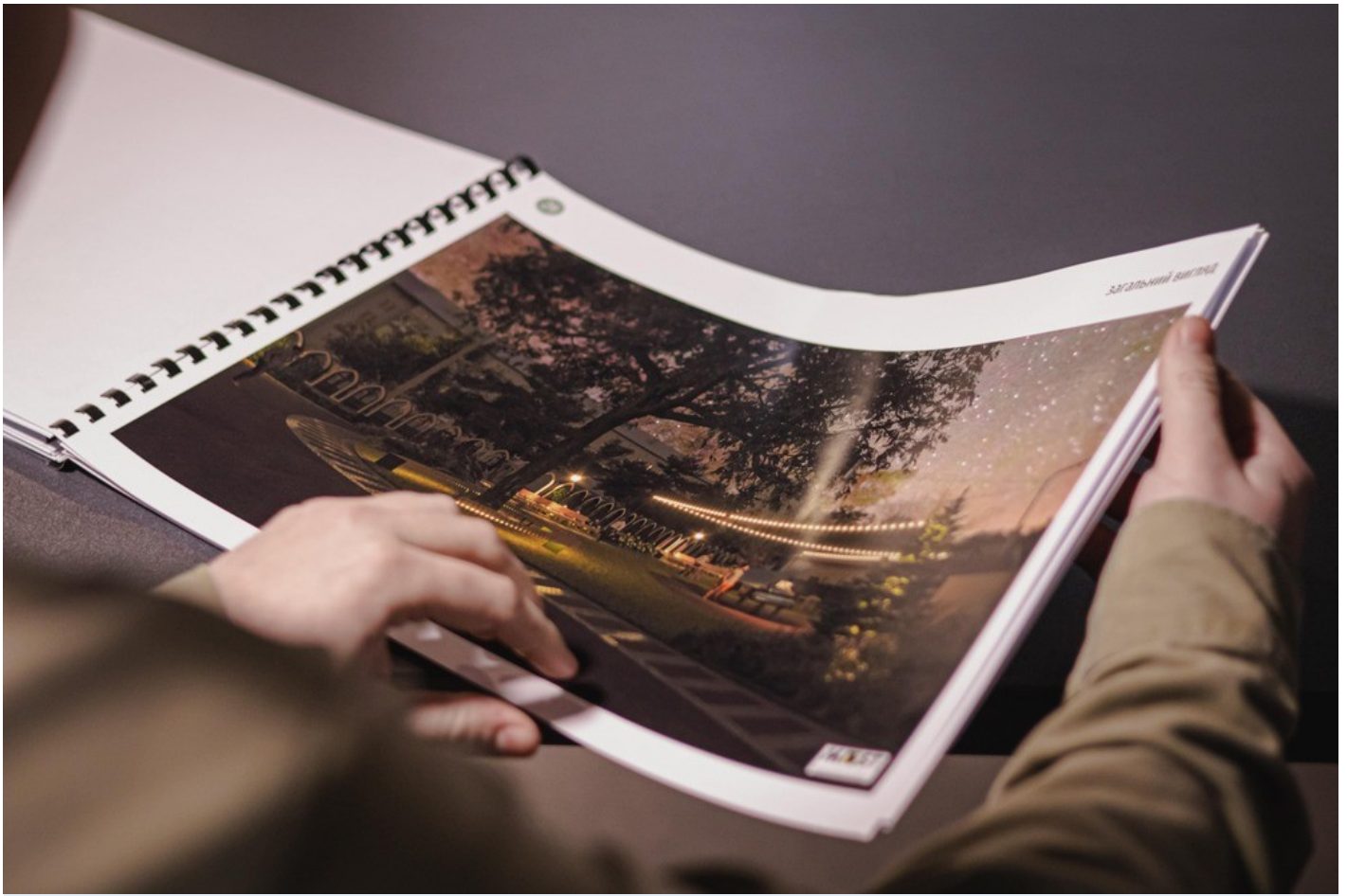
The Gothic Garden of the Organ Hall - a new cultural space in Rivne as an ecological renovation of the territory of the architectural monument