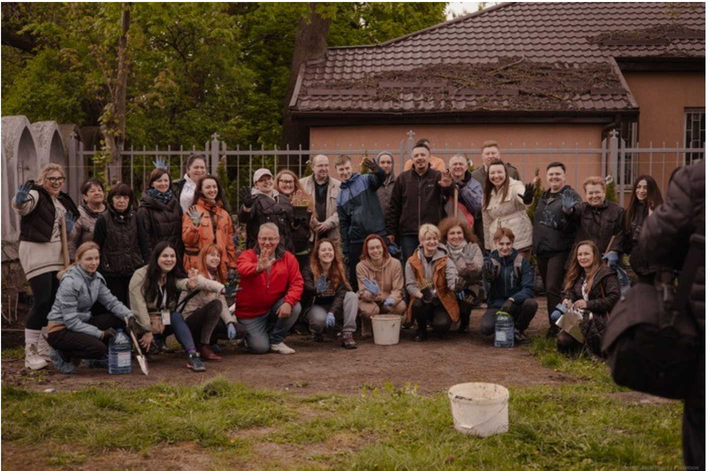
The Gothic Garden of the Organ Hall - a new cultural space in Rivne as an ecological renovation of the territory of the architectural monument