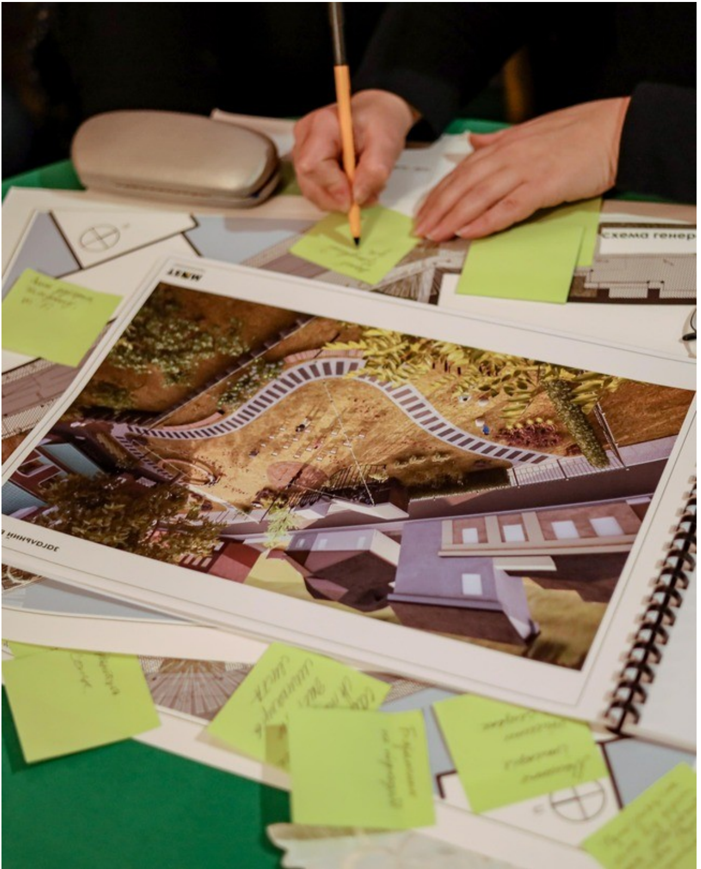
The Gothic Garden of the Organ Hall - a new cultural space in Rivne as an ecological renovation of the territory of the architectural monument