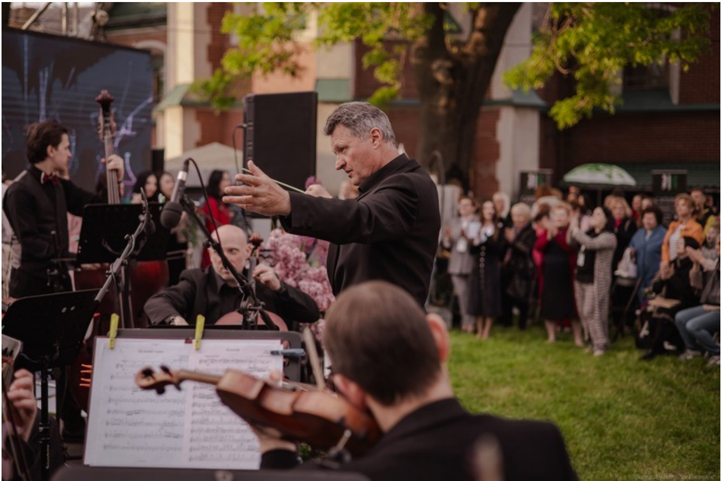
The Gothic Garden of the Organ Hall - a new cultural space in Rivne as an ecological renovation of the territory of the architectural monument