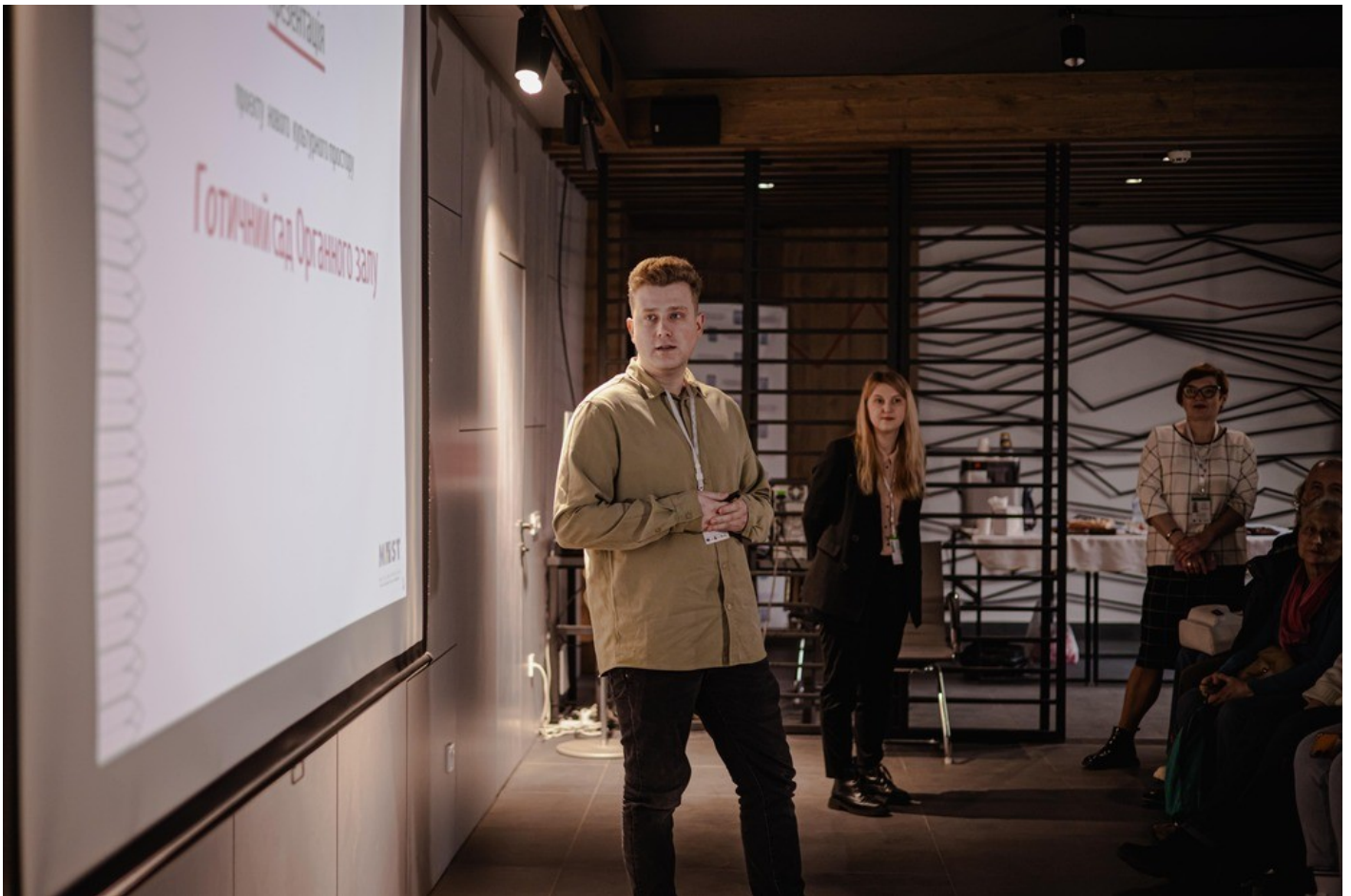
The Gothic Garden of the Organ Hall - a new cultural space in Rivne as an ecological renovation of the territory of the architectural monument