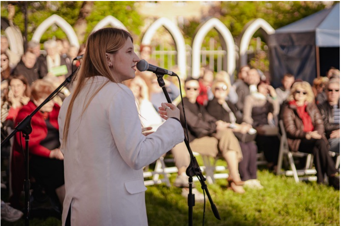
The Gothic Garden of the Organ Hall - a new cultural space in Rivne as an ecological renovation of the territory of the architectural monument