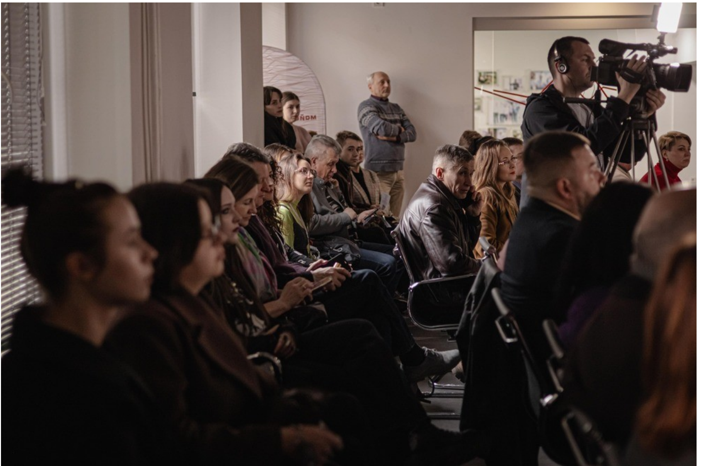
The Gothic Garden of the Organ Hall - a new cultural space in Rivne as an ecological renovation of the territory of the architectural monument