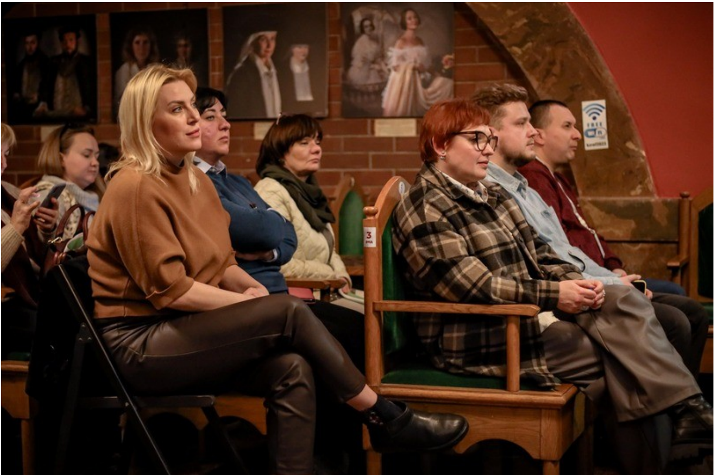
The Gothic Garden of the Organ Hall - a new cultural space in Rivne as an ecological renovation of the territory of the architectural monument