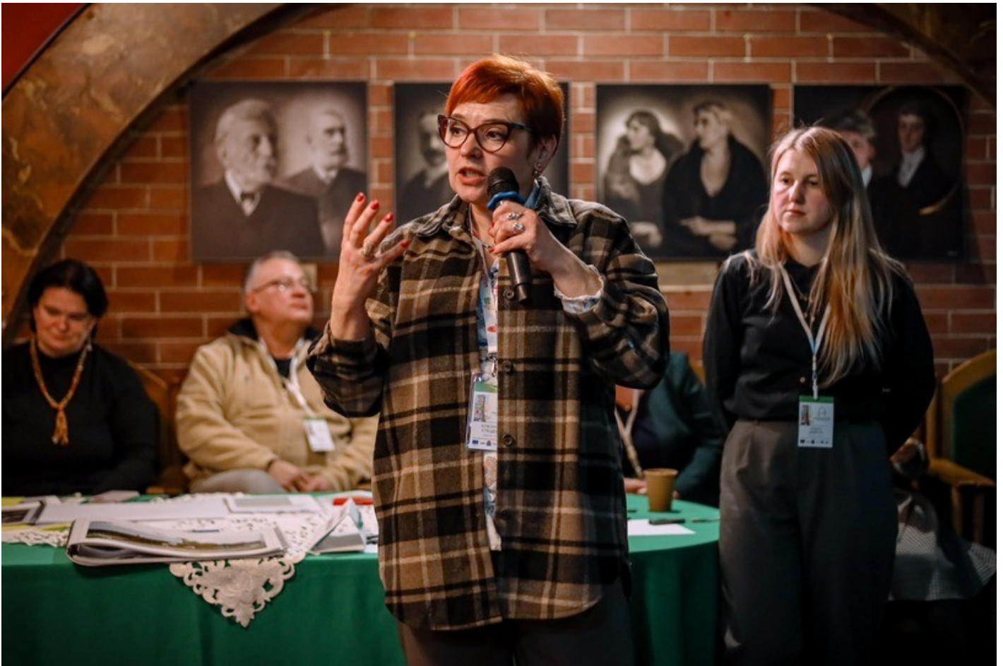
The Gothic Garden of the Organ Hall - a new cultural space in Rivne as an ecological renovation of the territory of the architectural monument