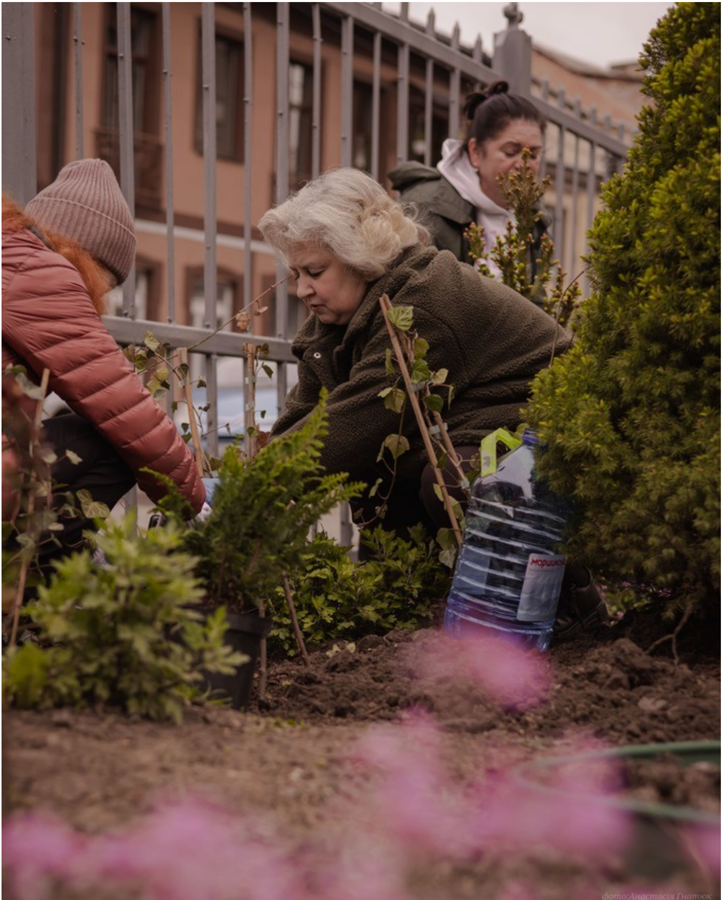
фото: Анастасія Гнатюк