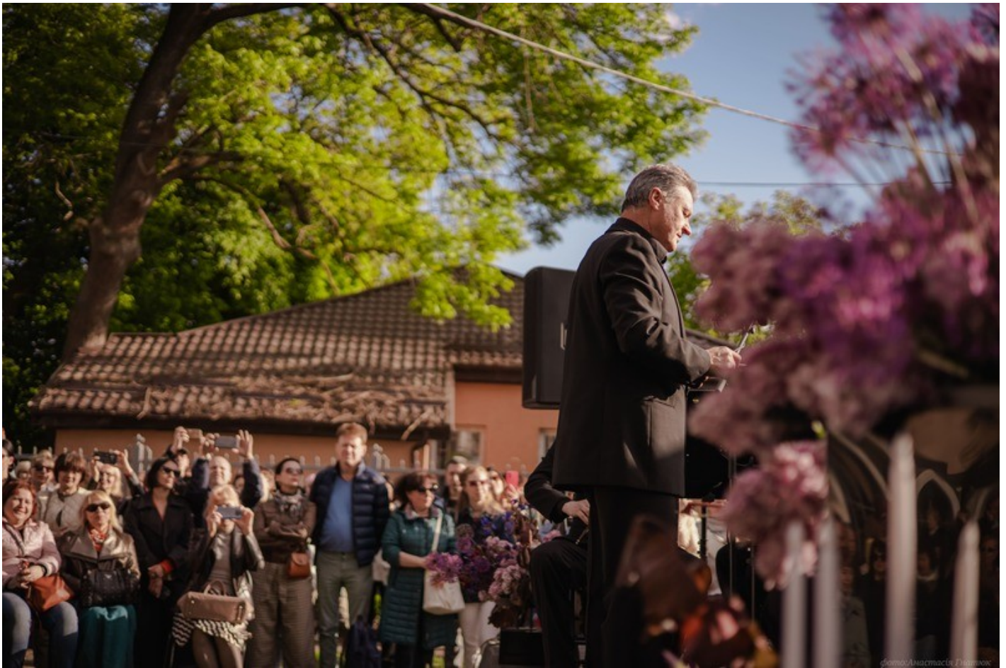
The Gothic Garden of the Organ Hall - a new cultural space in Rivne as an ecological renovation of the territory of the architectural monument