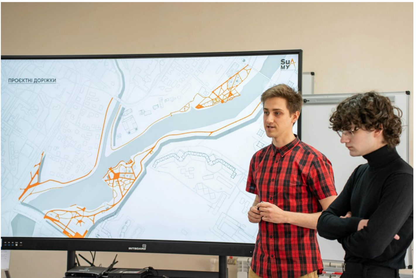
Річка в місті