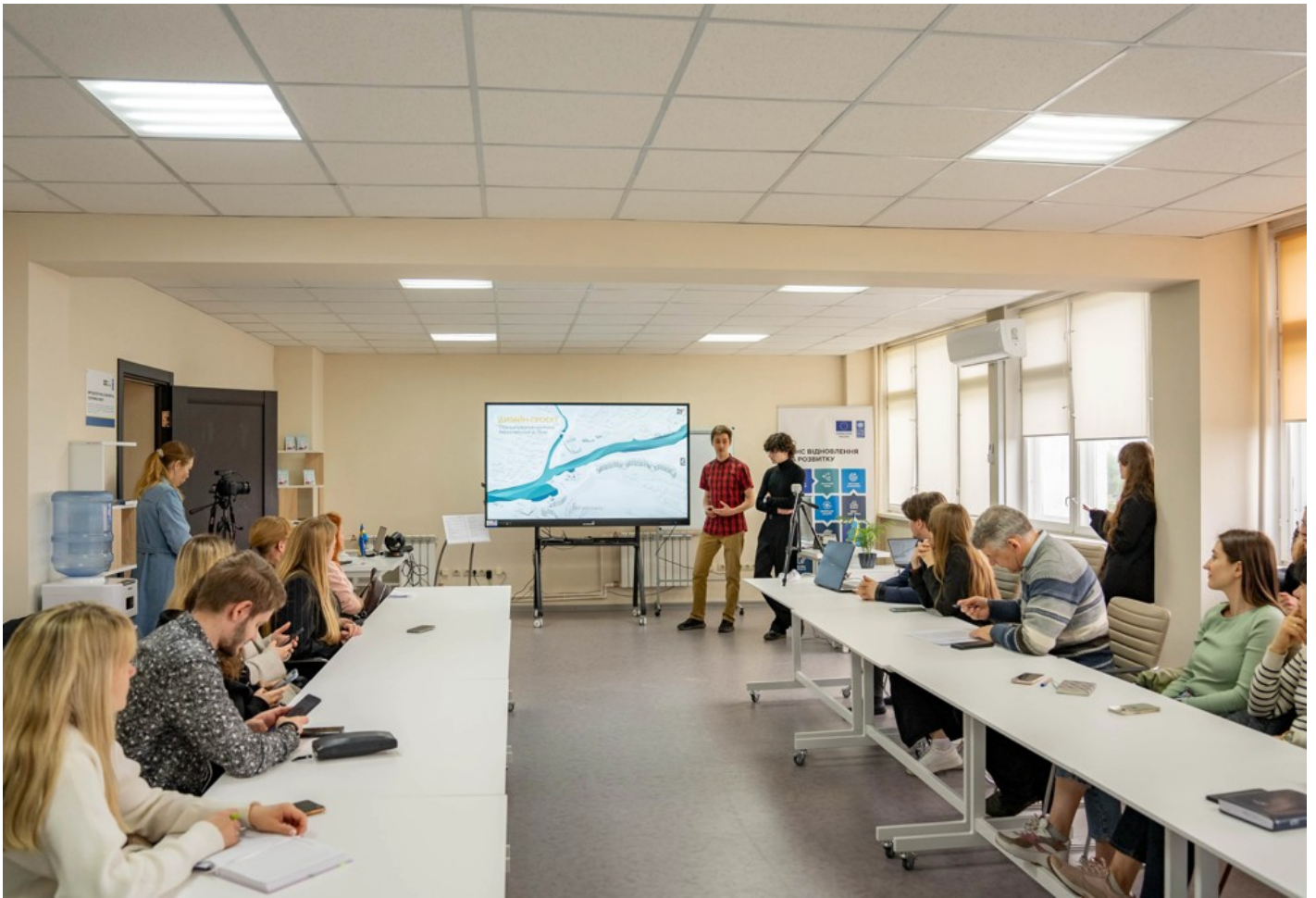
Річка в місті