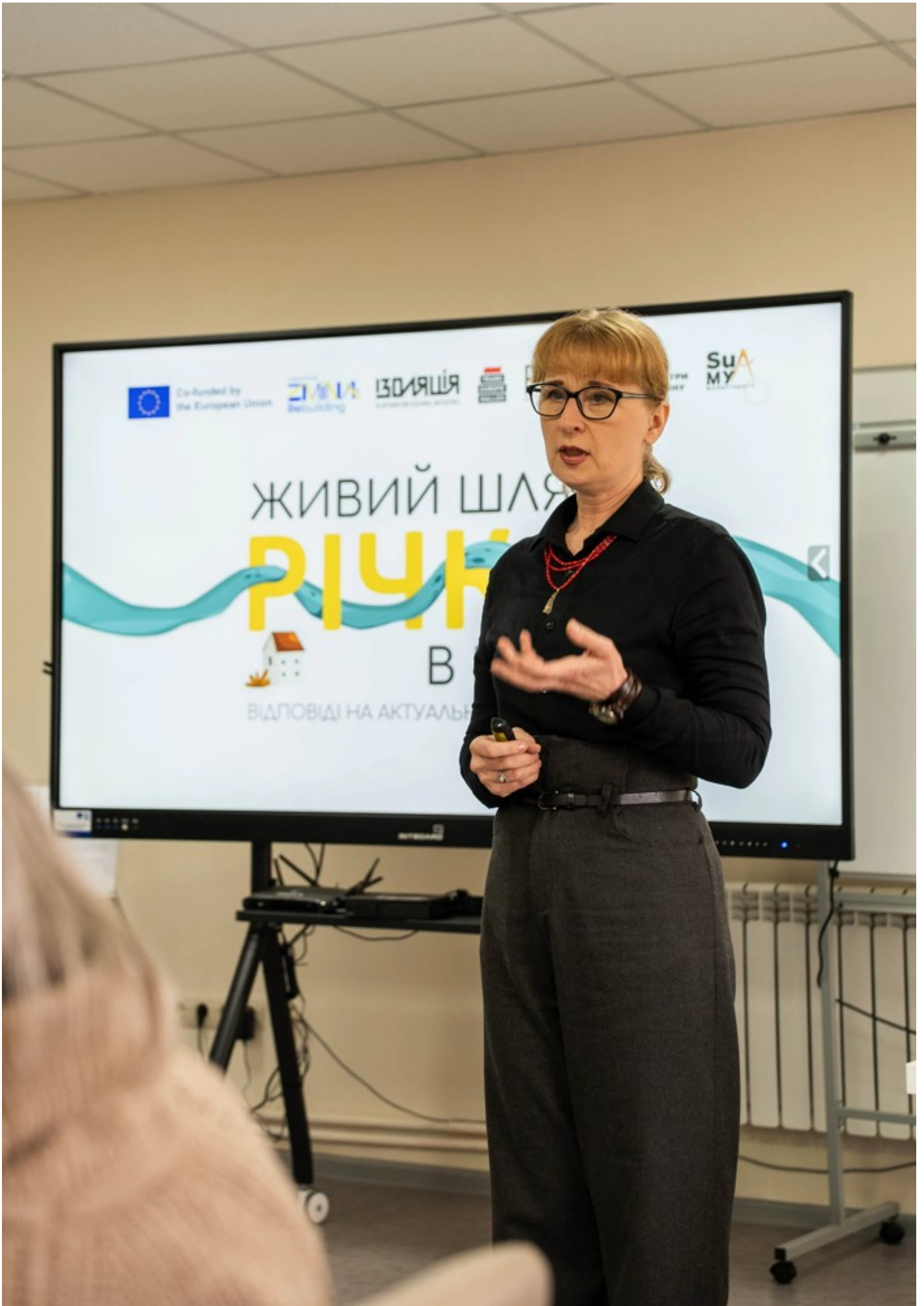
Річка в місті