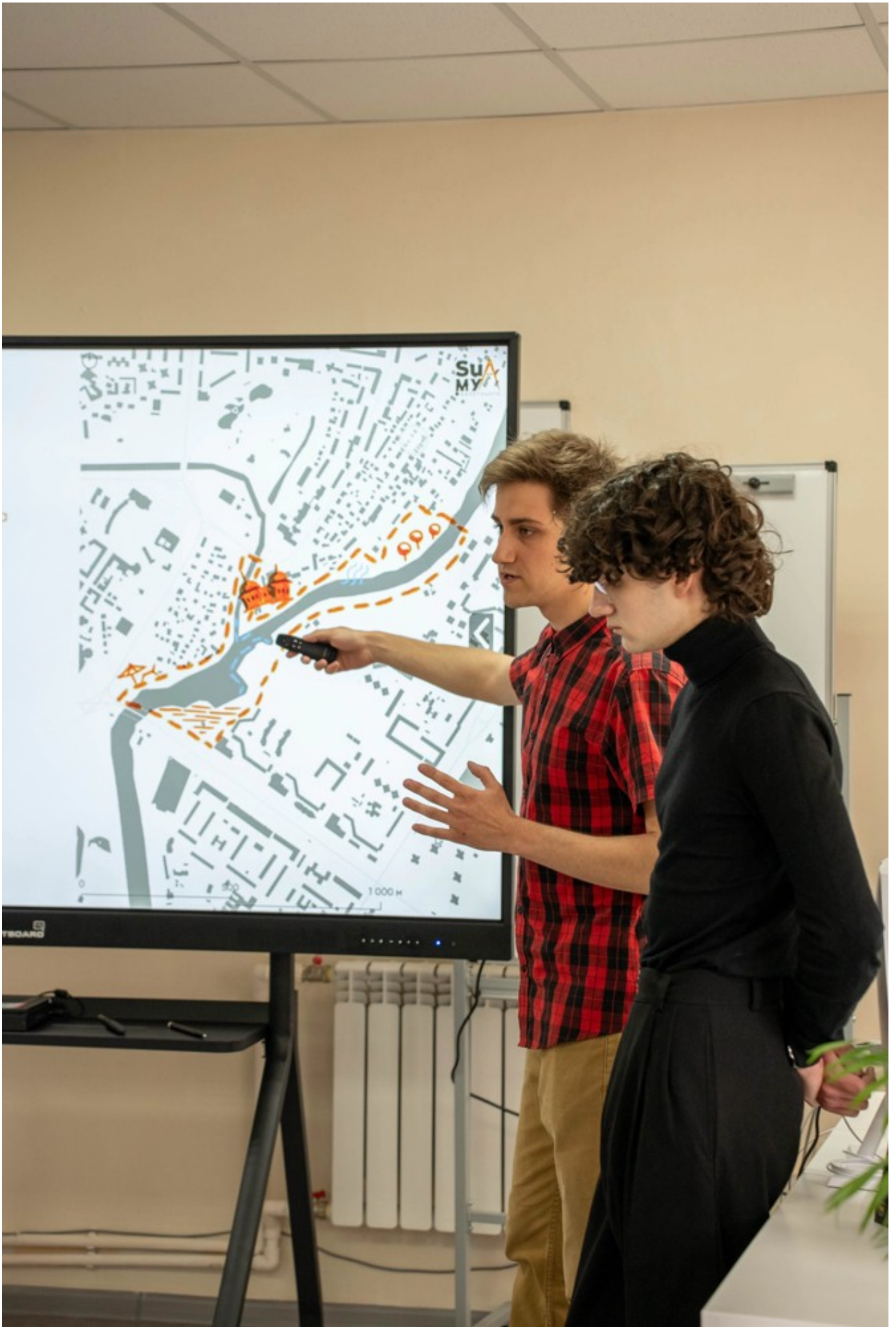
Річка в місті