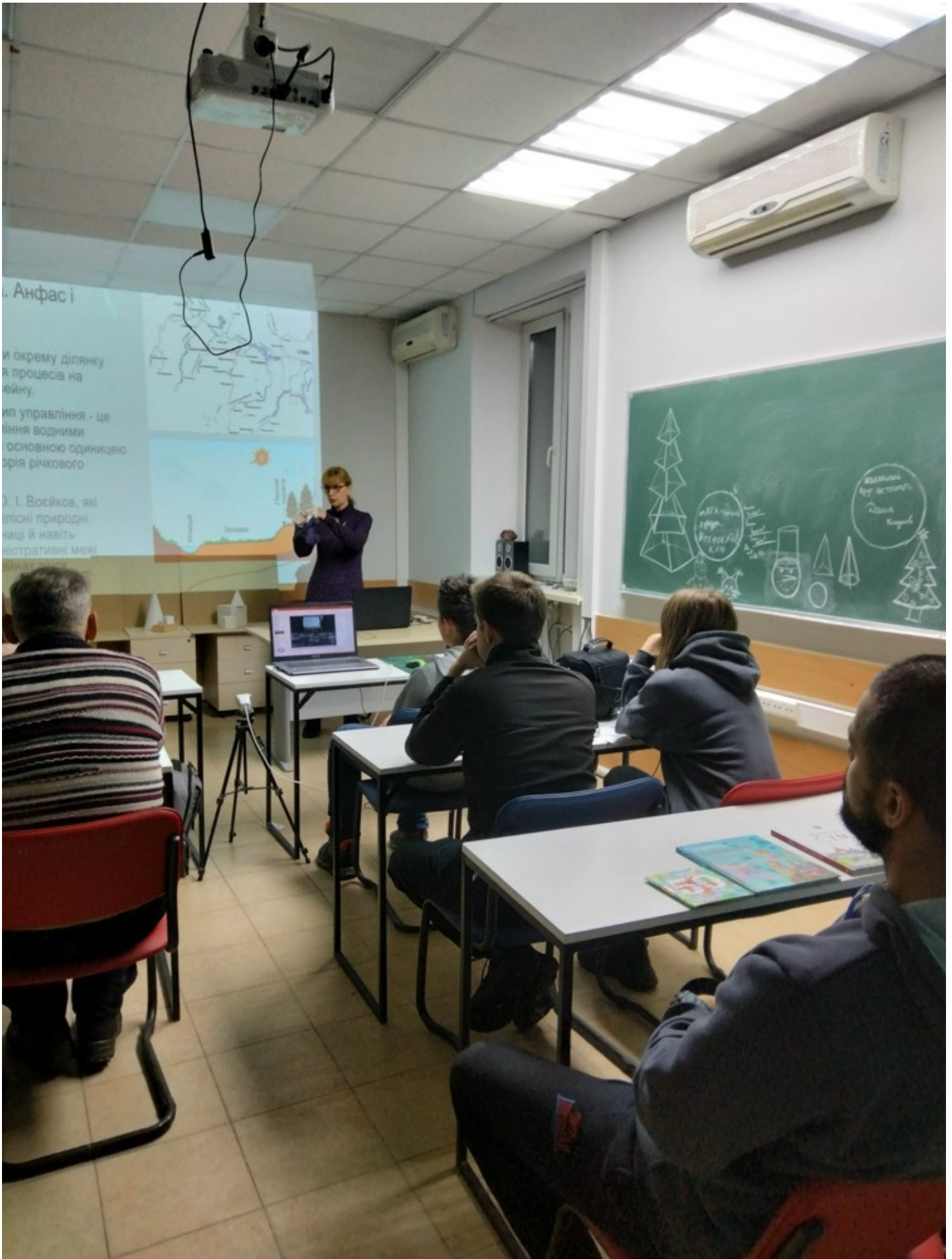
Річка в місті