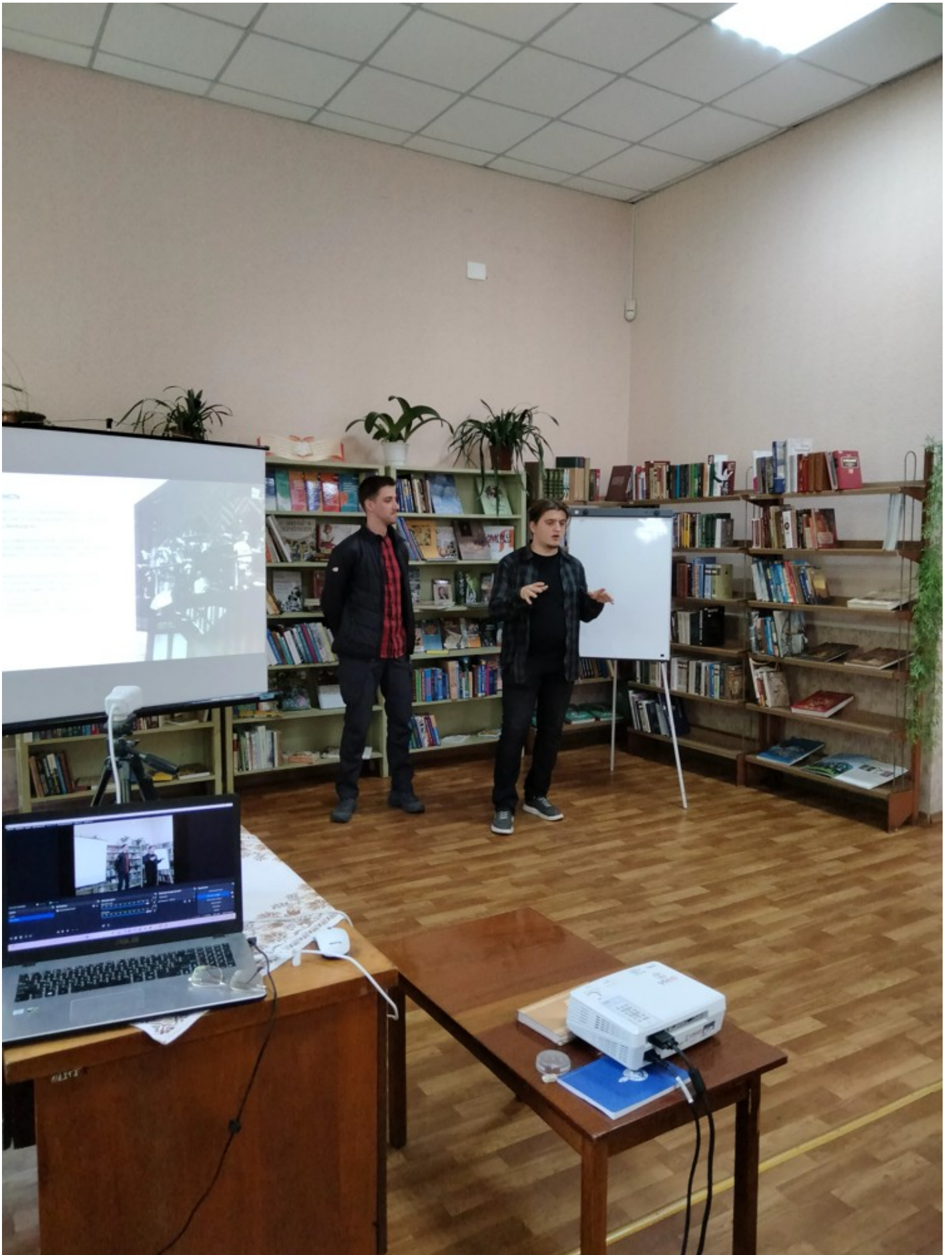
Річка в місті