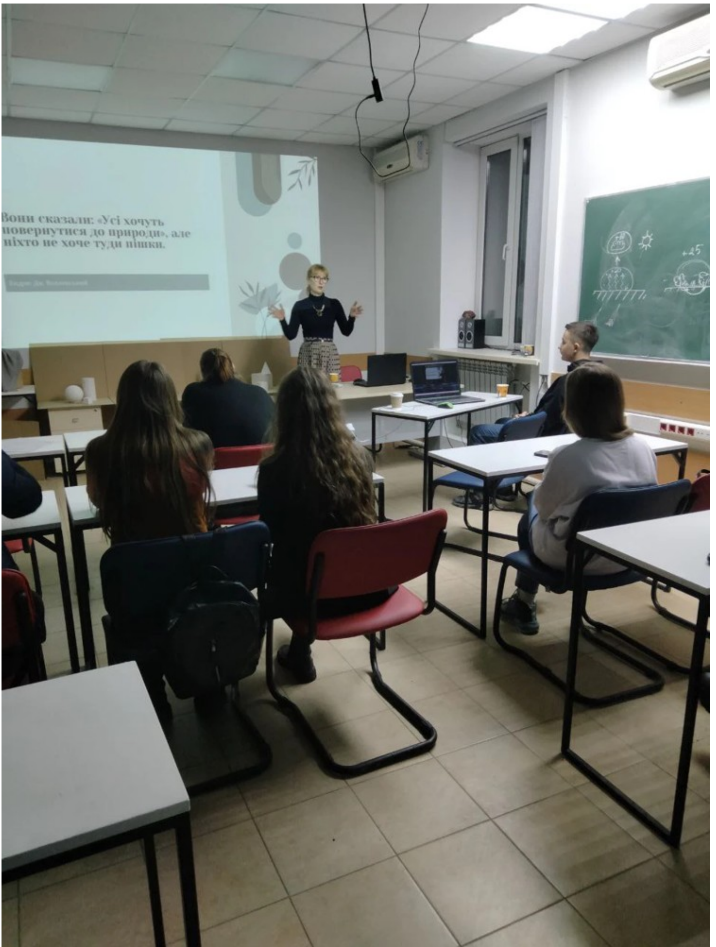
Річка в місті