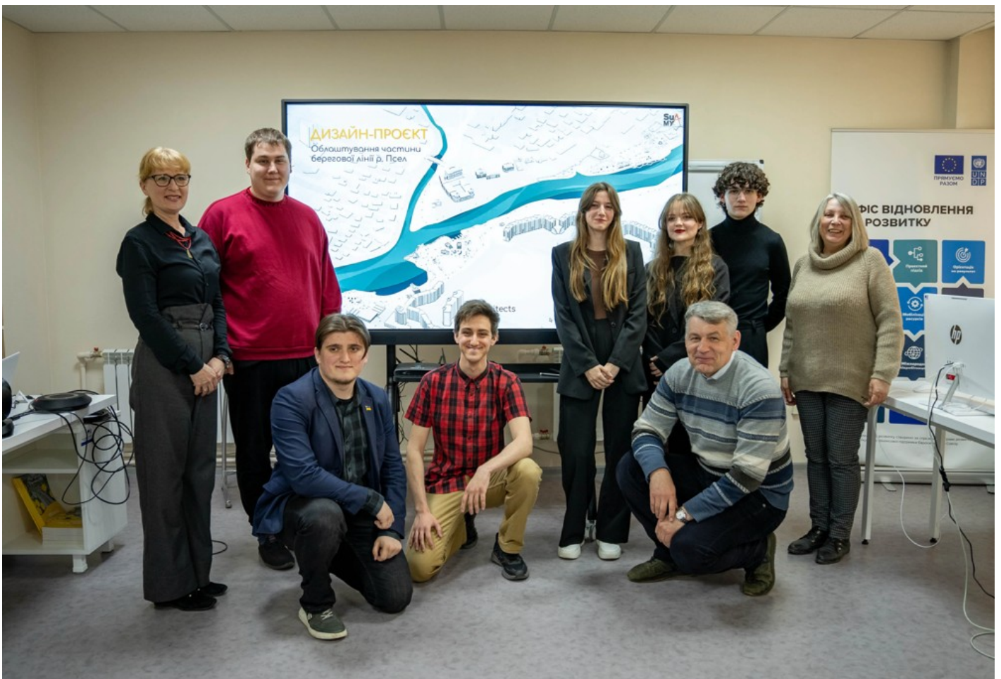
Річка в місті