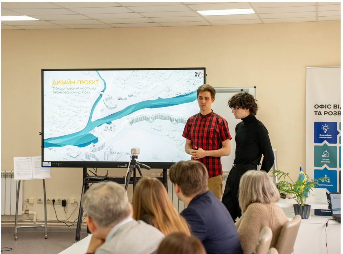
Річка в місті