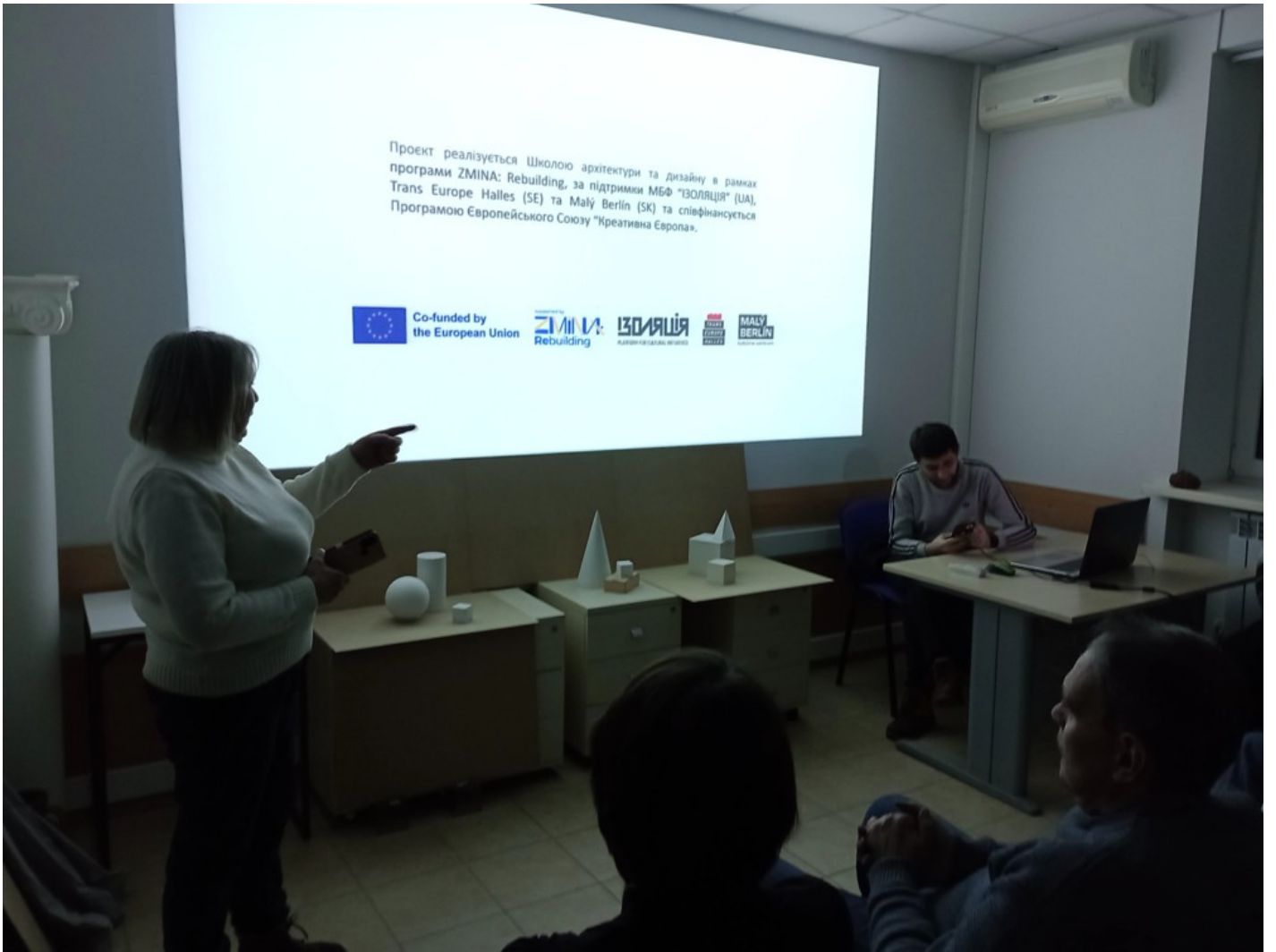
Річка в місті