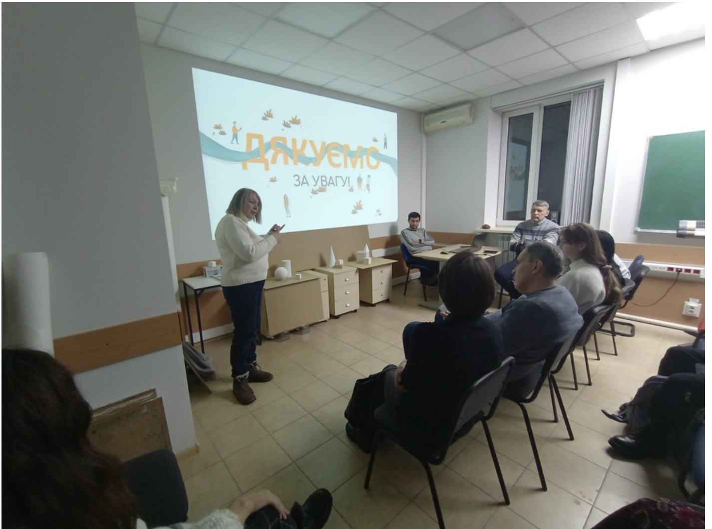
Річка в місті