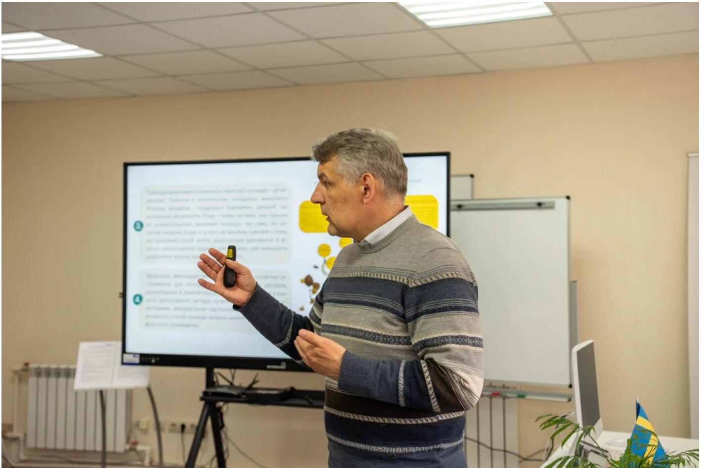
Річка в місті