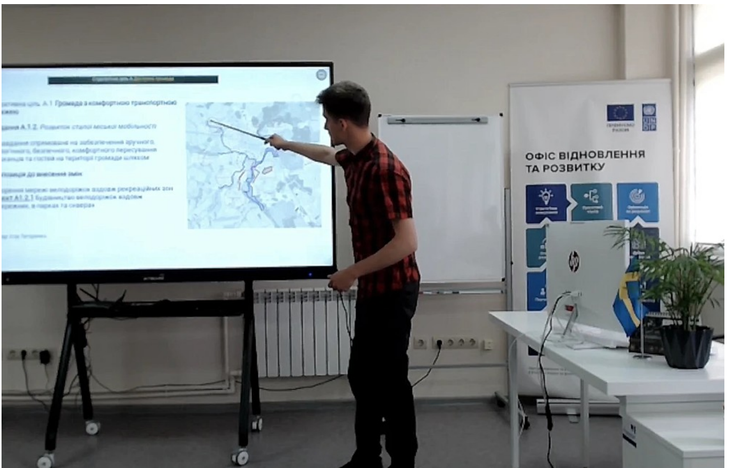
Річка в місті