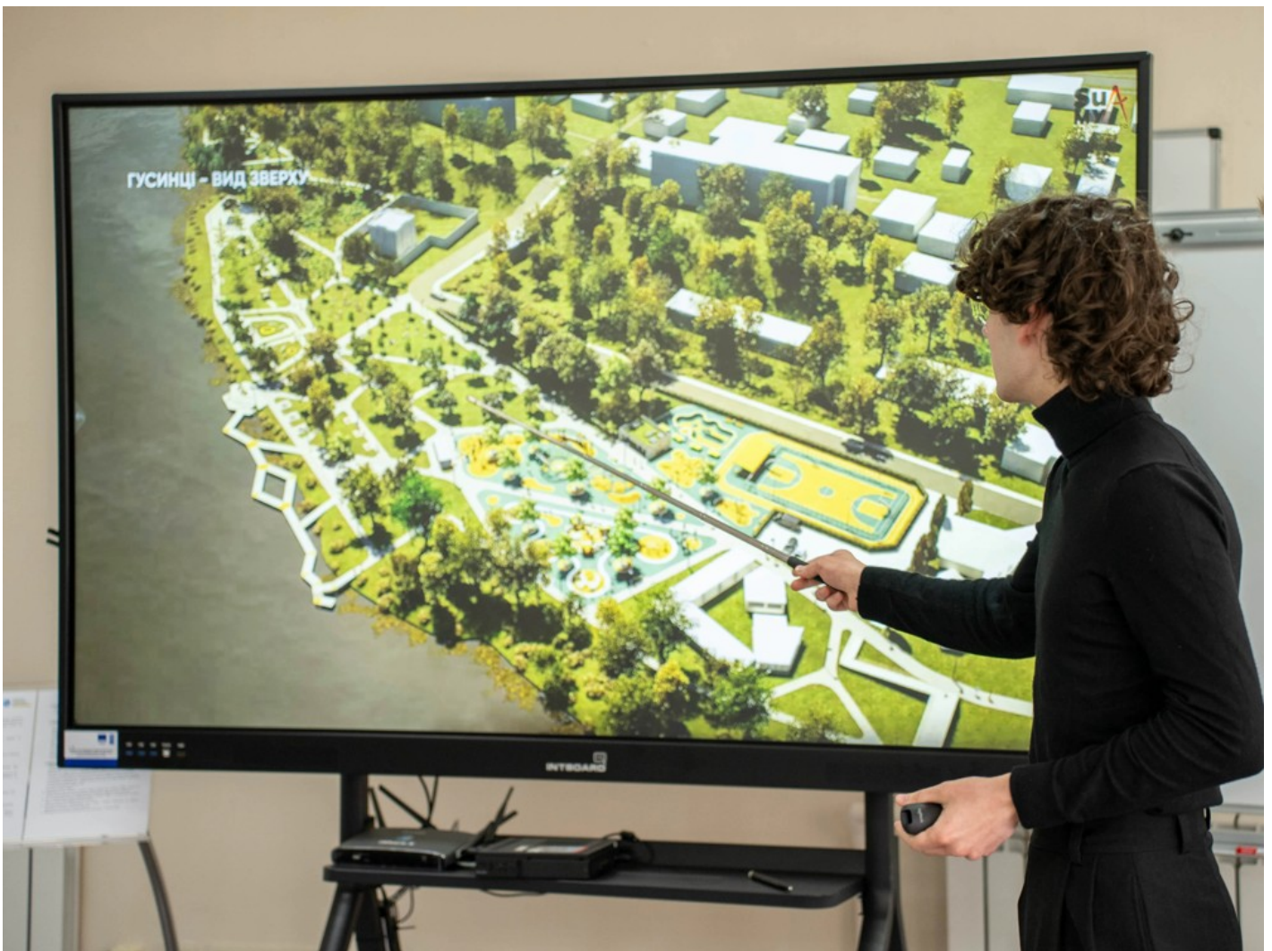
Річка в місті