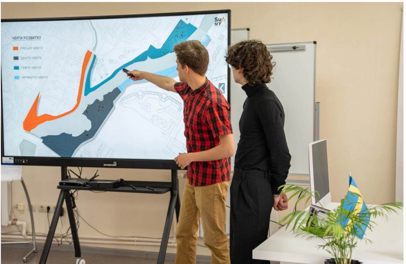
Річка в місті