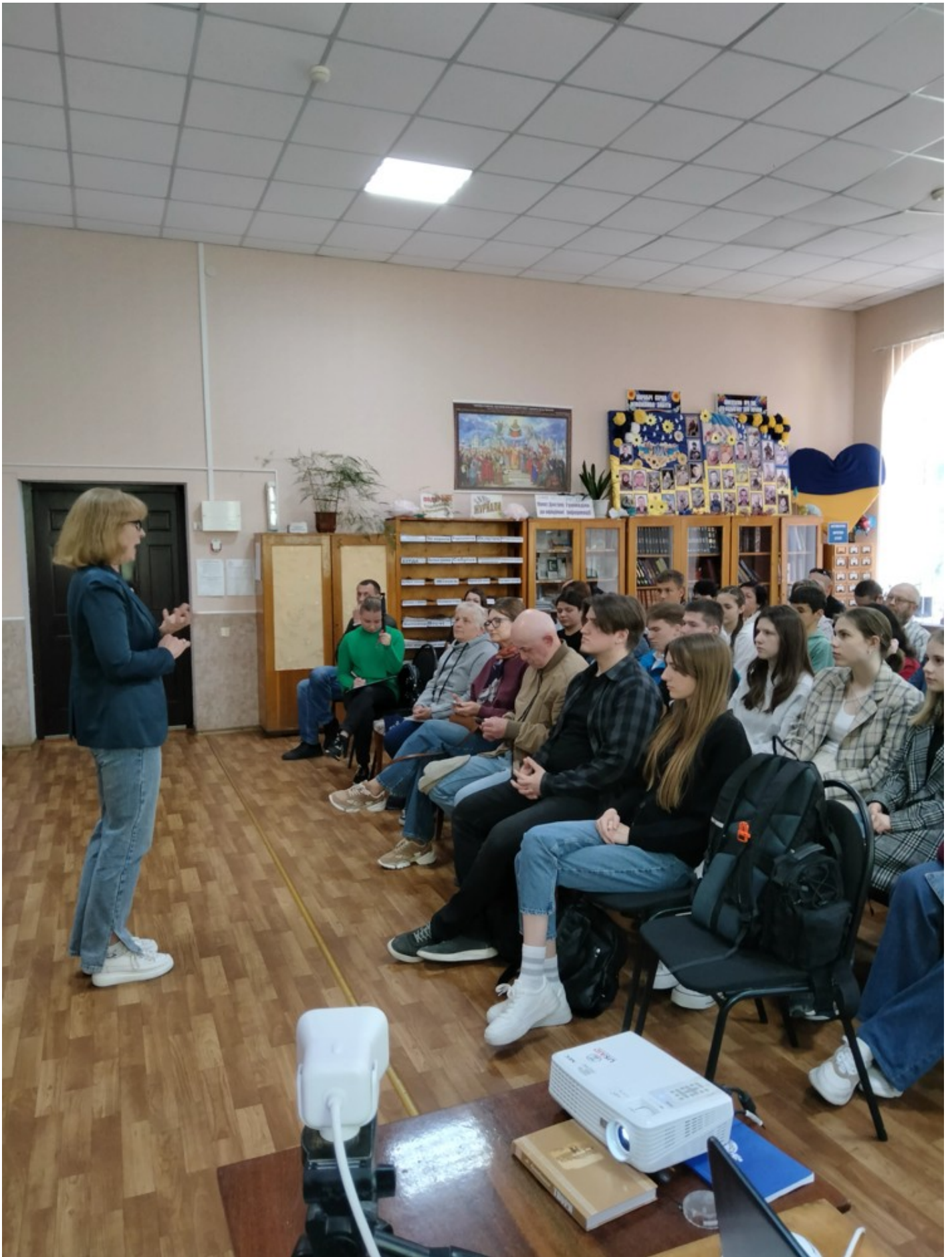
Річка в місті