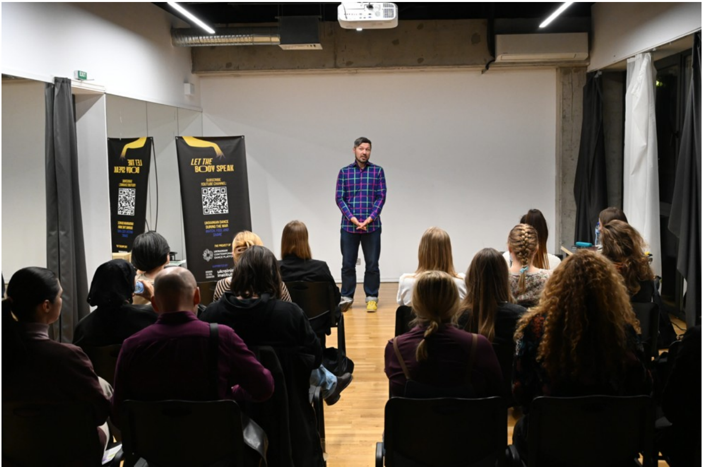
Нехай тіло говорить: відновлення громади