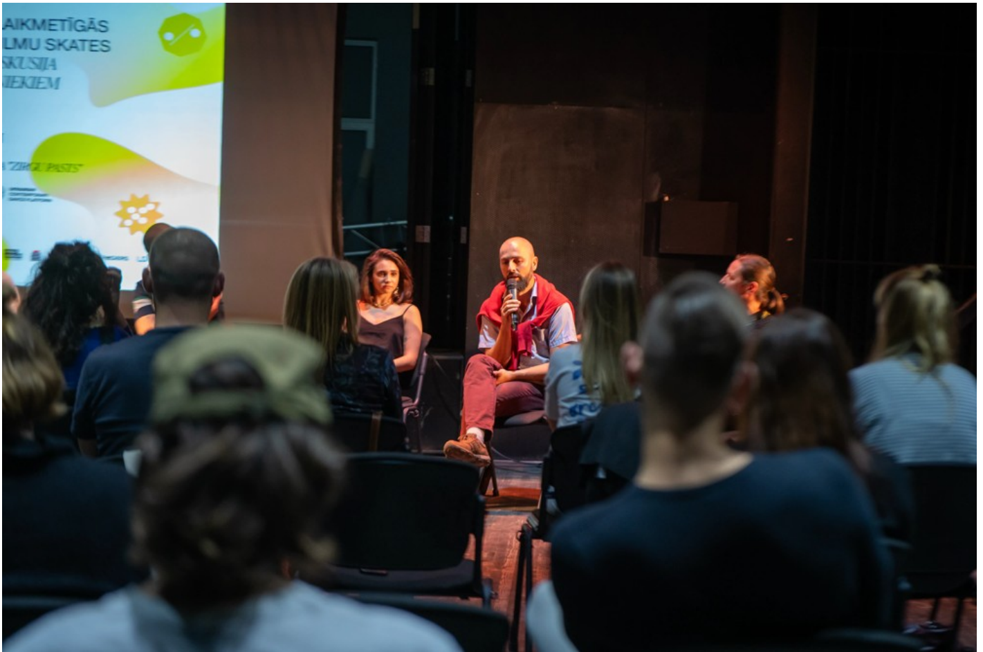
Нехай тіло говорить: відновлення громади