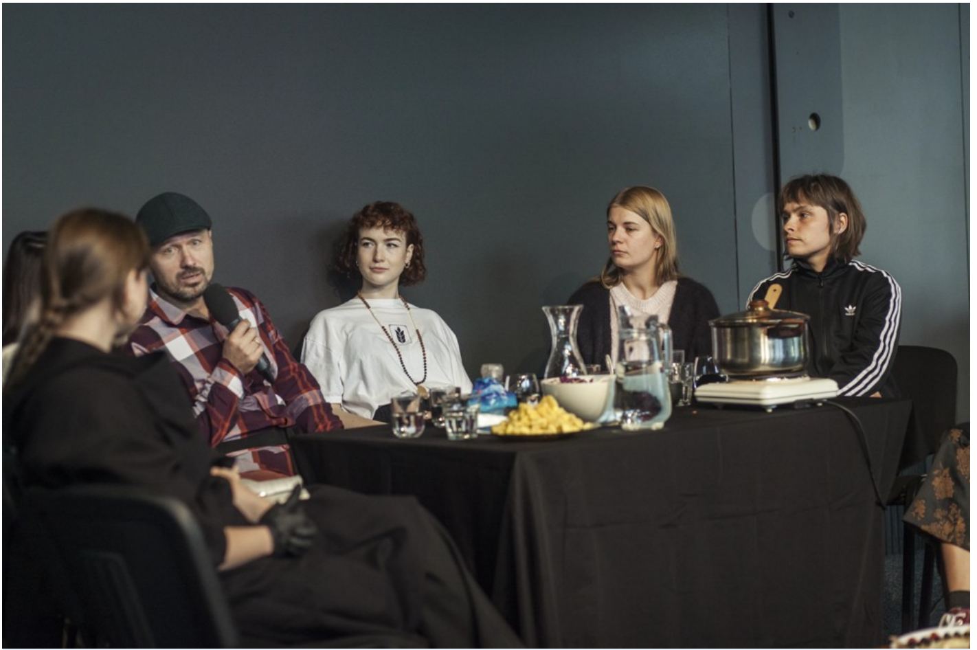
Нехай тіло говорить: відновлення громади