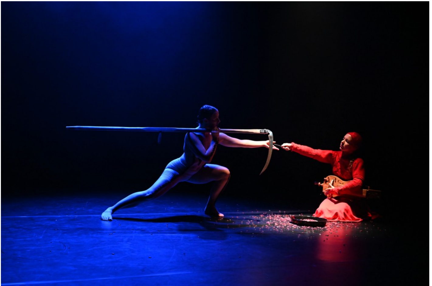
Нехай тіло говорить: відновлення громади