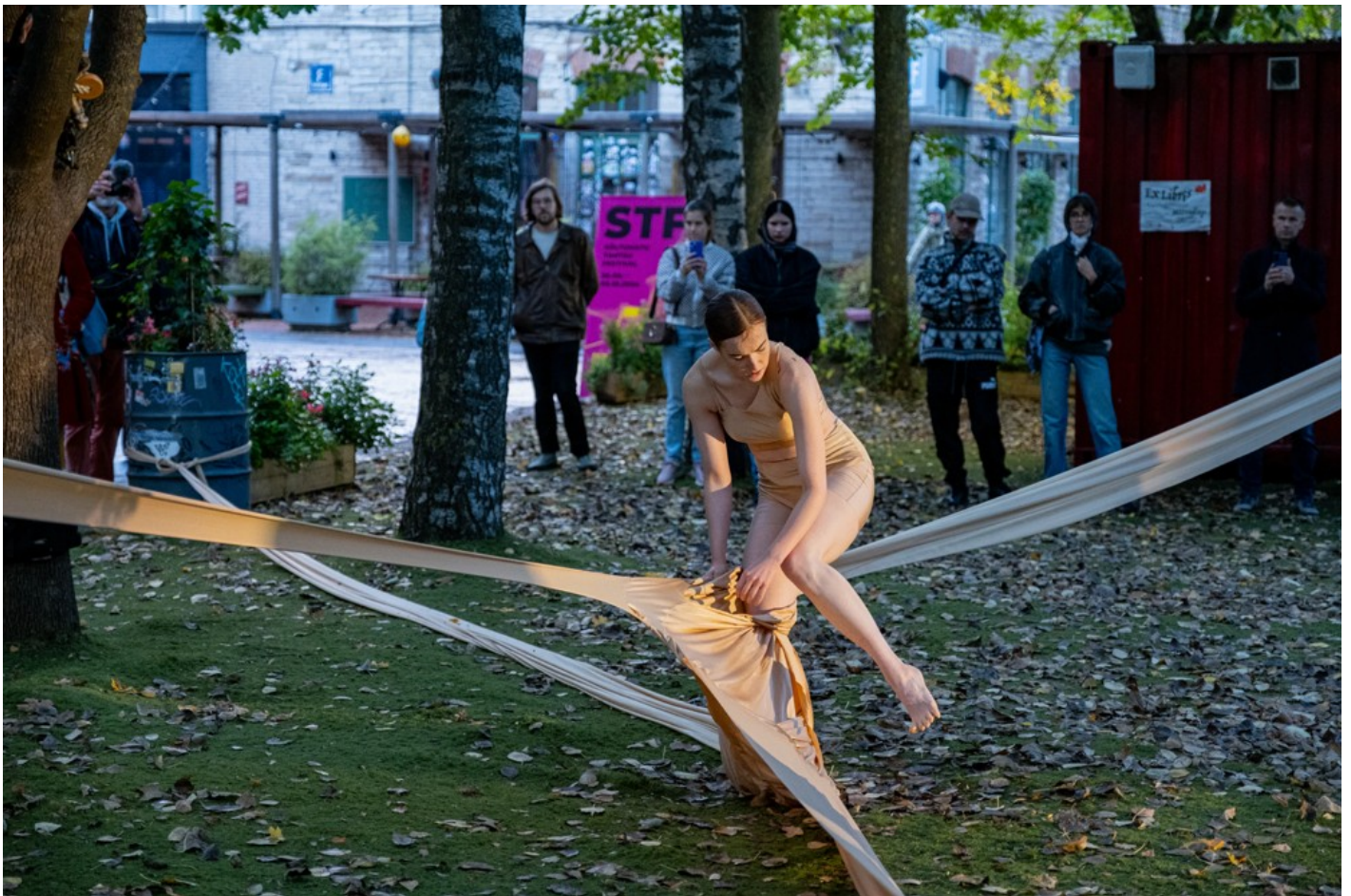
Нехай тіло говорить: відновлення громади