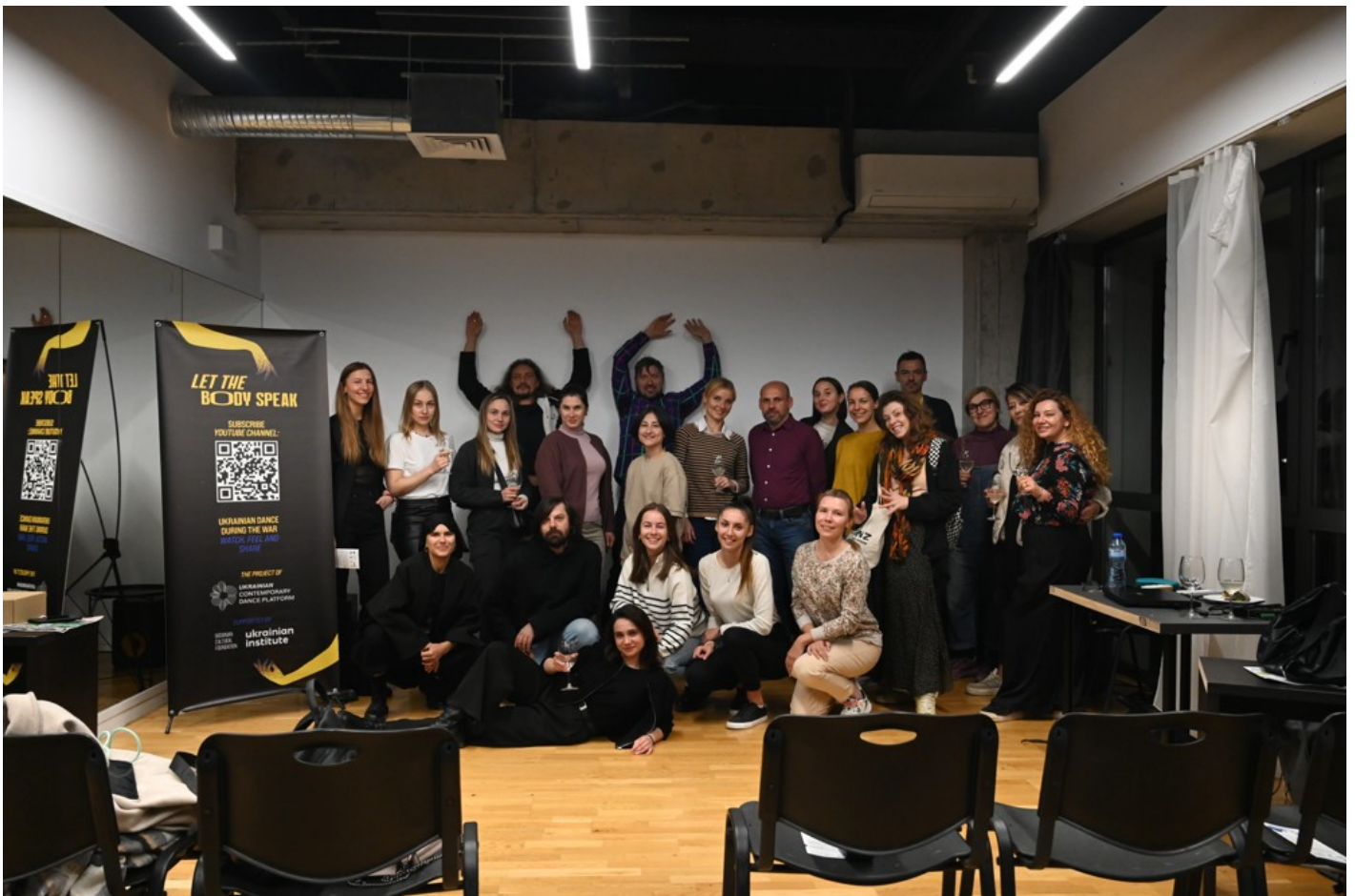
Нехай тіло говорить: відновлення громади