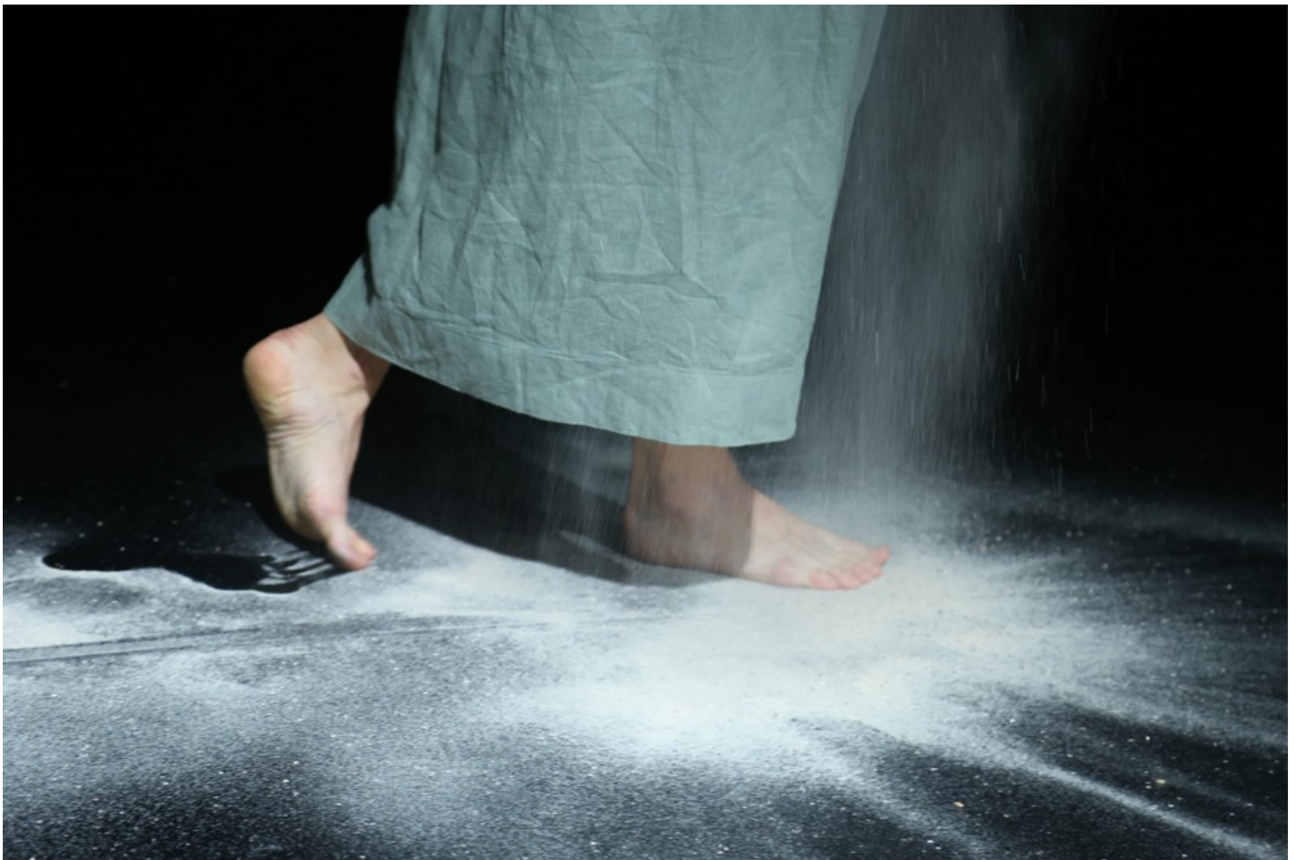
Нехай тіло говорить: відновлення громади