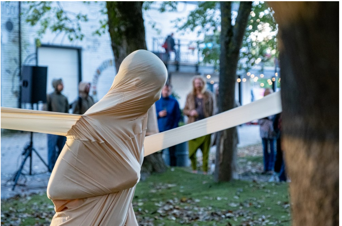
Нехай тіло говорить: відновлення громади