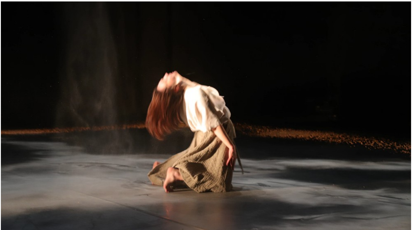
Нехай тіло говорить: відновлення громади