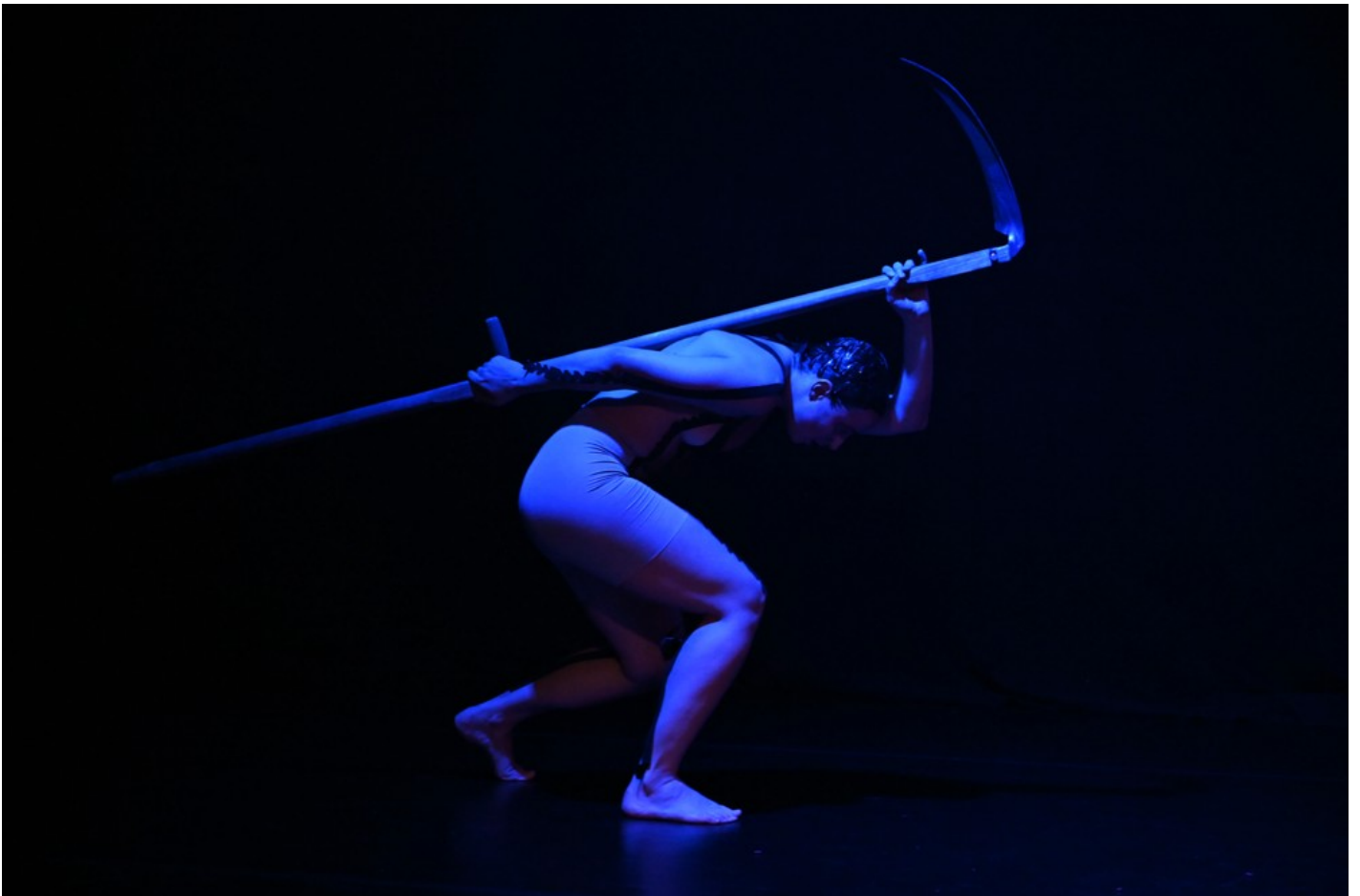
Нехай тіло говорить: відновлення громади