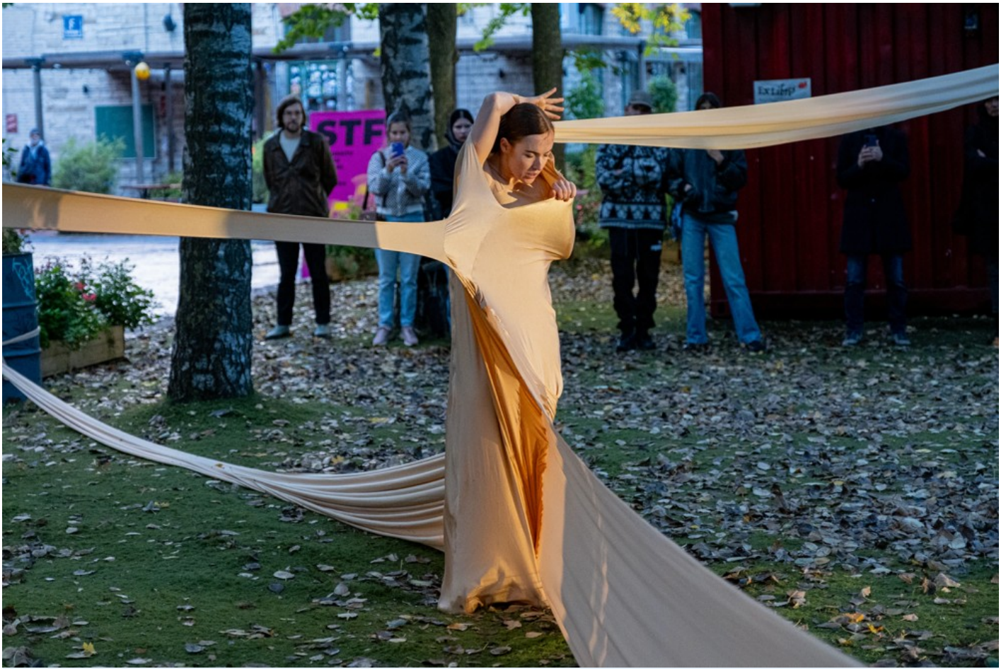
Нехай тіло говорить: відновлення громади