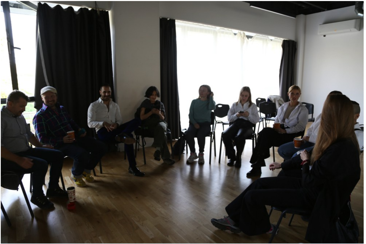
Нехай тіло говорить: відновлення громади