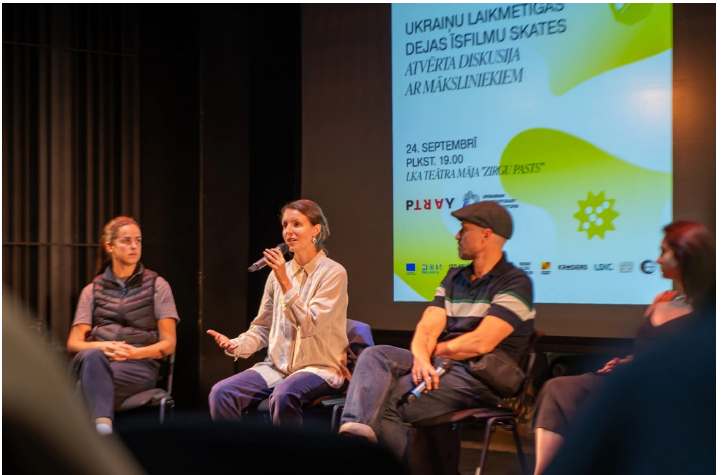
Нехай тіло говорить: відновлення громади