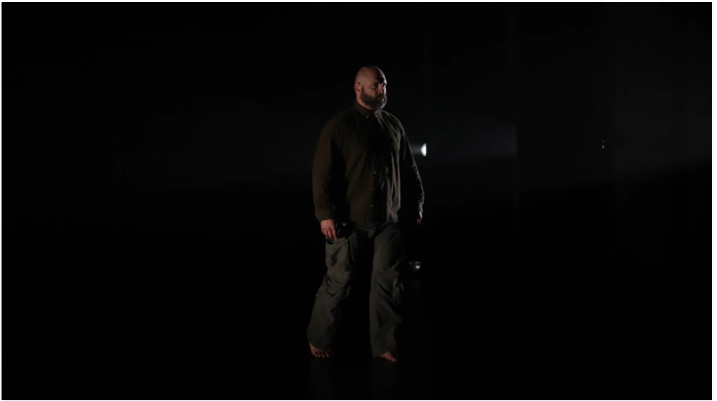
Нехай тіло говорить: відновлення громади