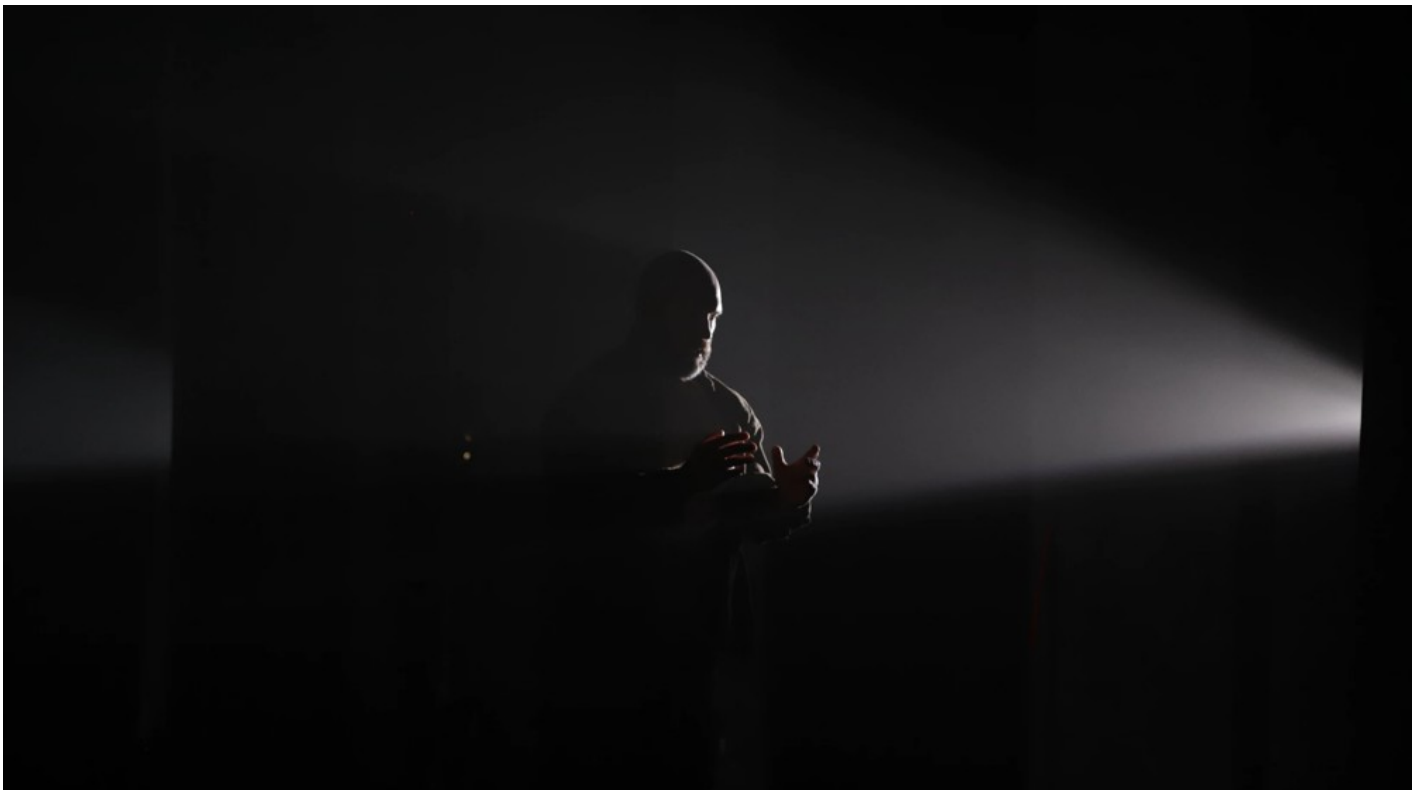
Нехай тіло говорить: відновлення громади