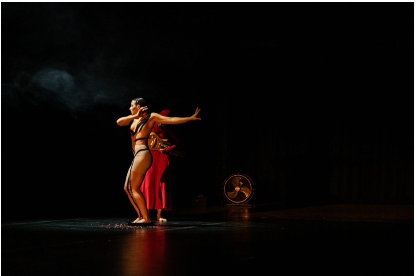
Нехай тіло говорить: відновлення громади