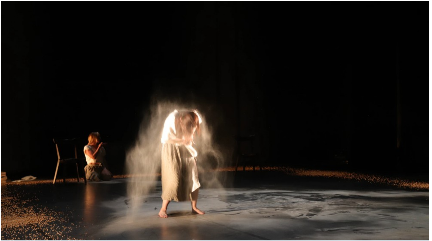
Нехай тіло говорить: відновлення громади