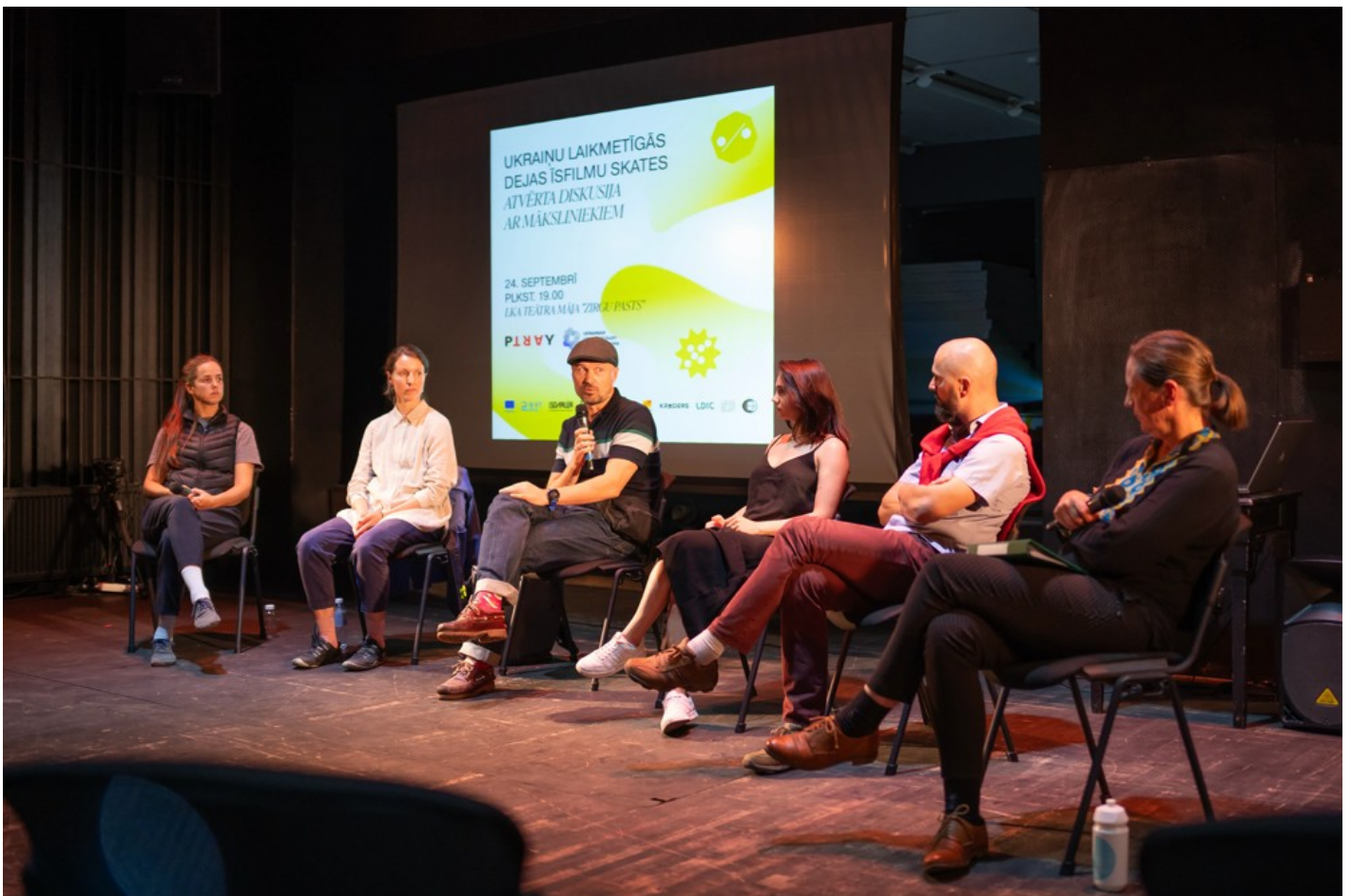
Нехай тіло говорить: відновлення громади