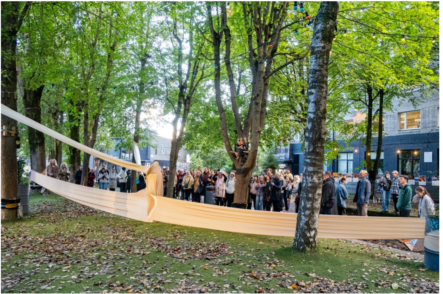
Нехай тіло говорить: відновлення громади