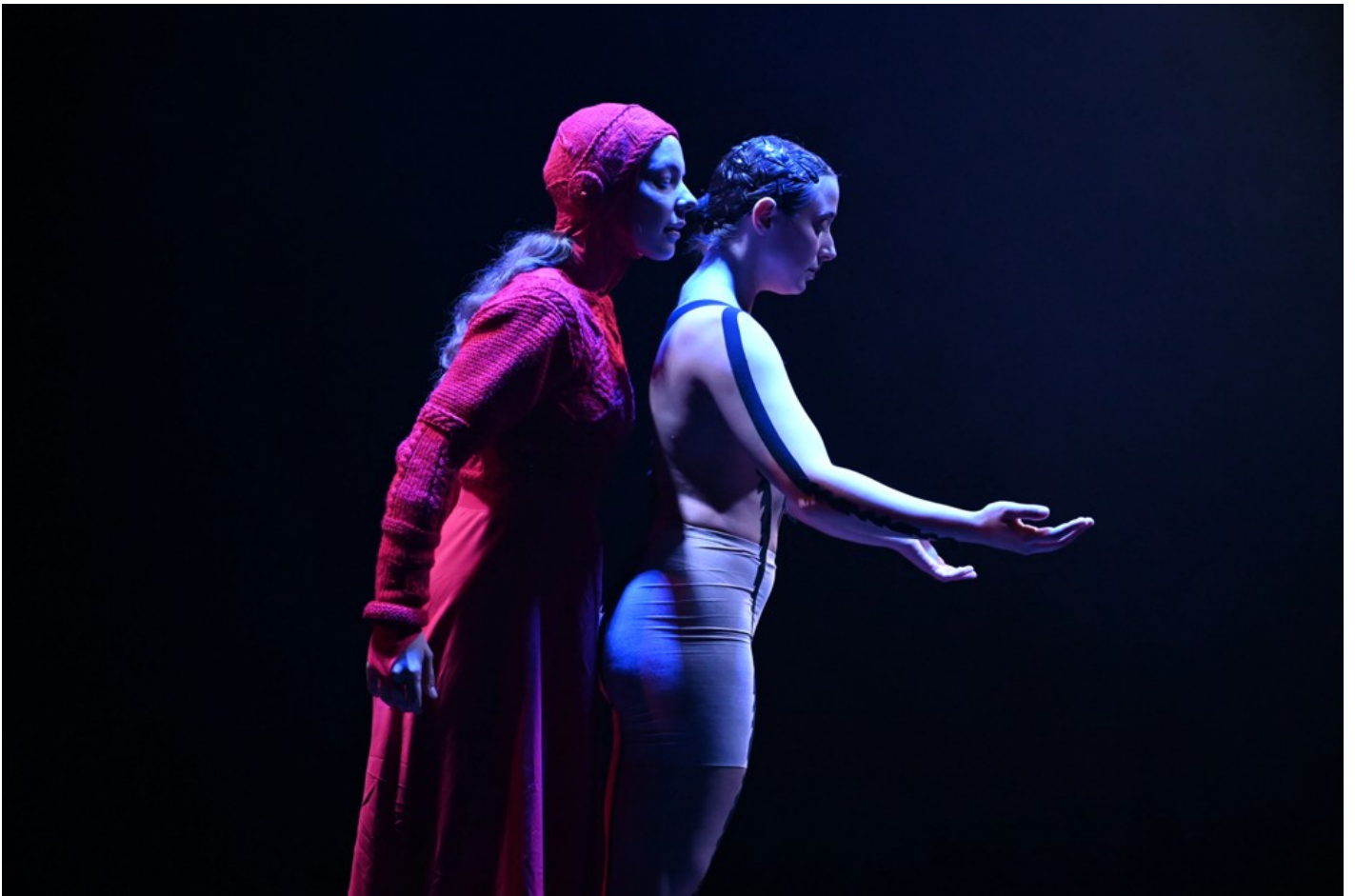
Нехай тіло говорить: відновлення громади