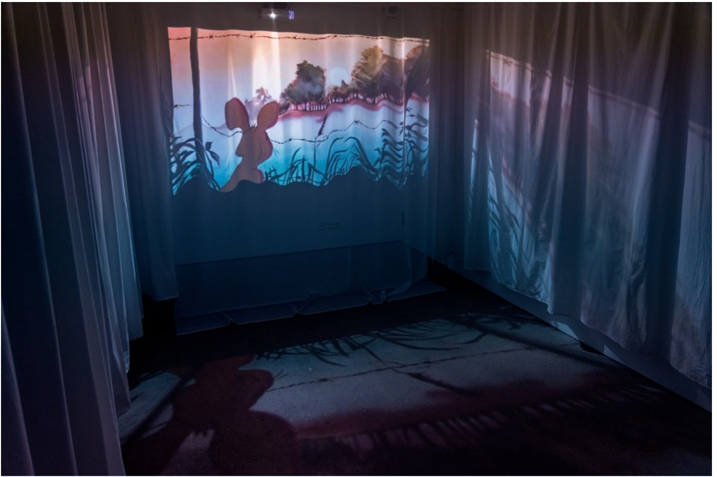
A Time in Pieces - on the occasion of Kyiv Perennial