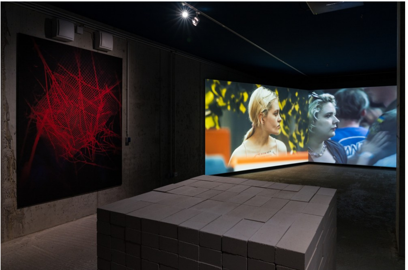
A Time in Pieces - on the occasion of Kyiv Perennial