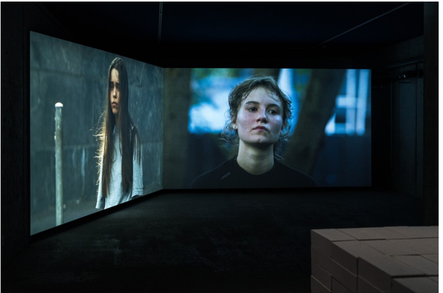
A Time in Pieces – on the occasion of Kyiv Perennial