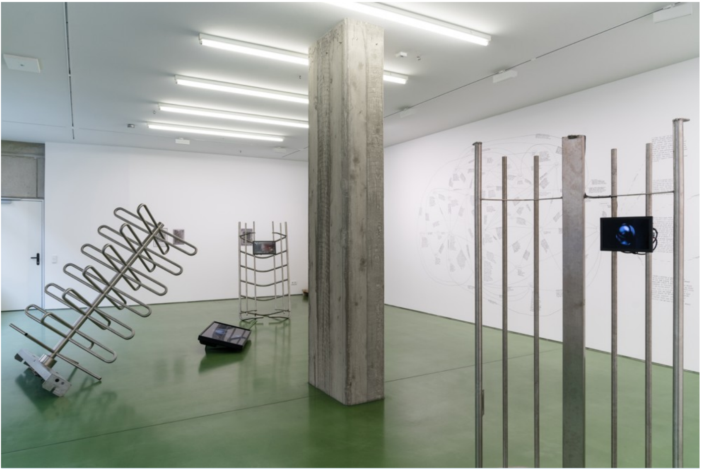
A Time in Pieces - on the occasion of Kyiv Perennial