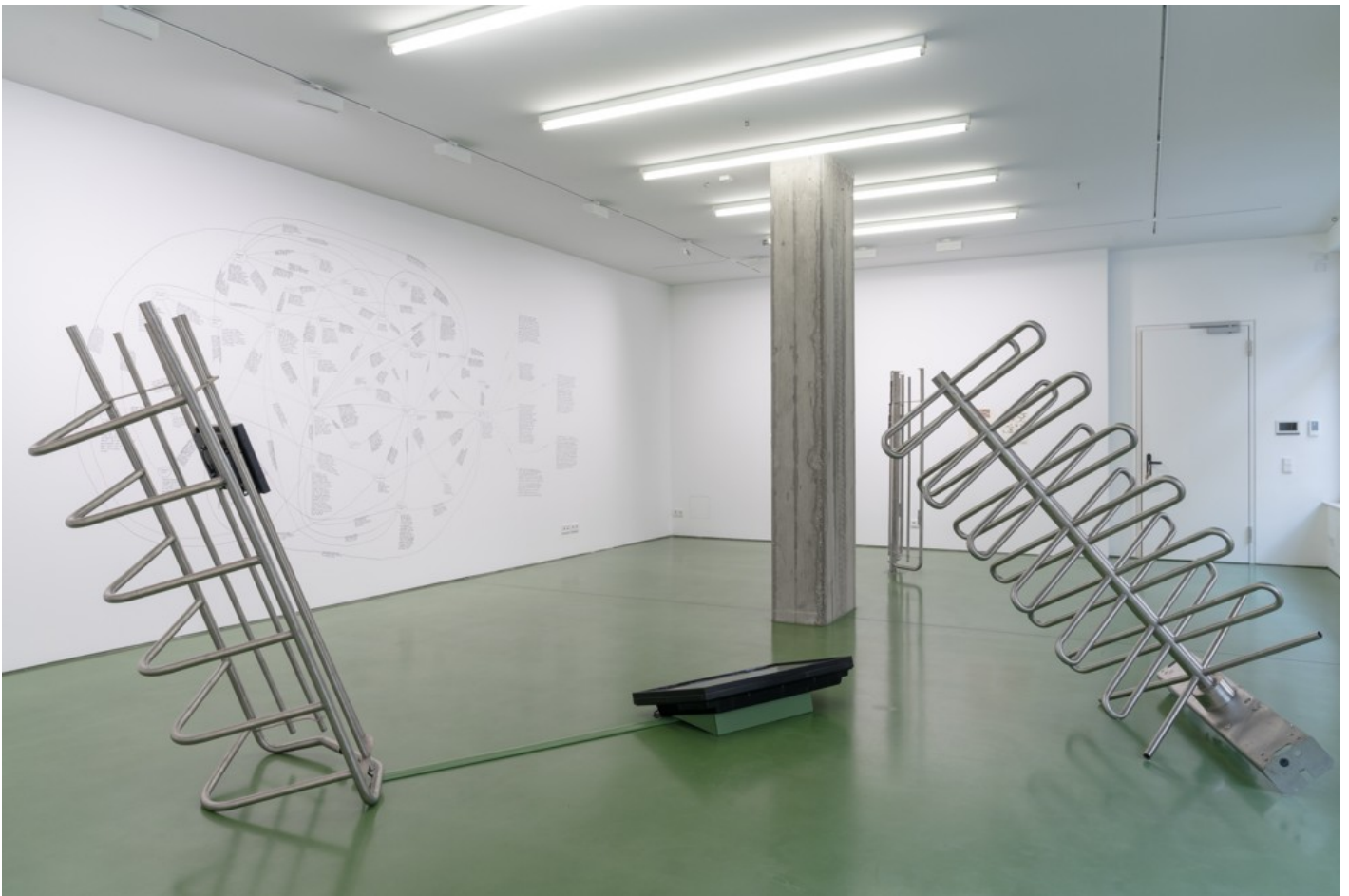
A Time in Pieces - on the occasion of Kyiv Perennial