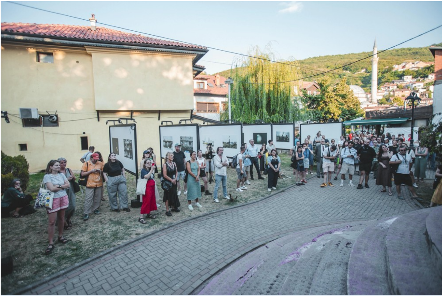
Focus Ukraine (Docudays at DokuFest)