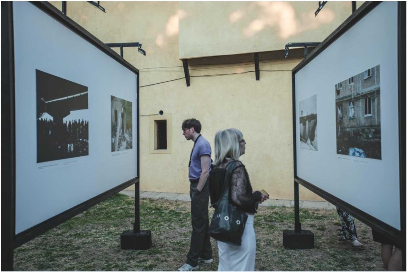
Focus Ukraine (Docudays at DokuFest)