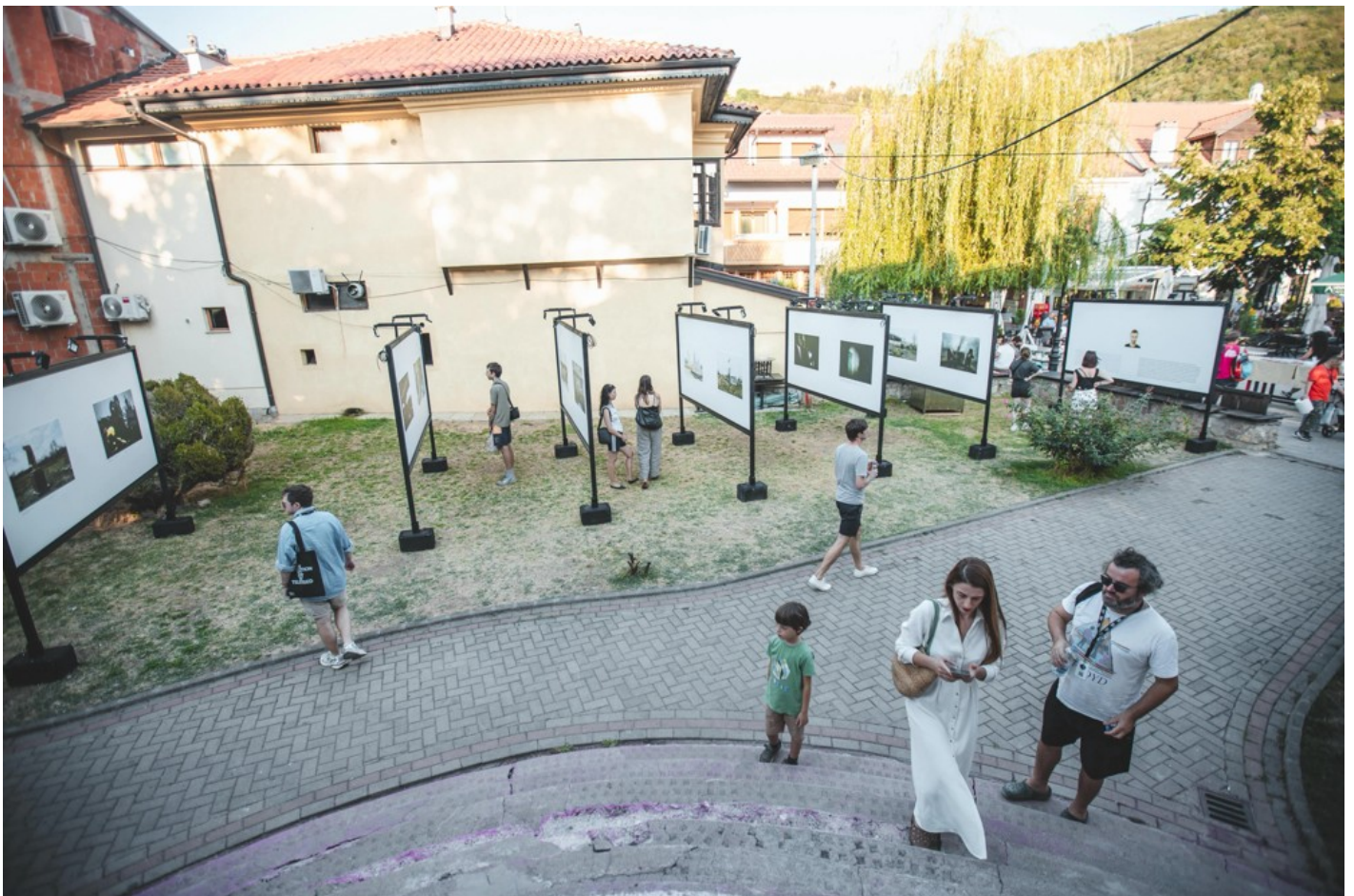
Focus Ukraine (Docudays at DokuFest)