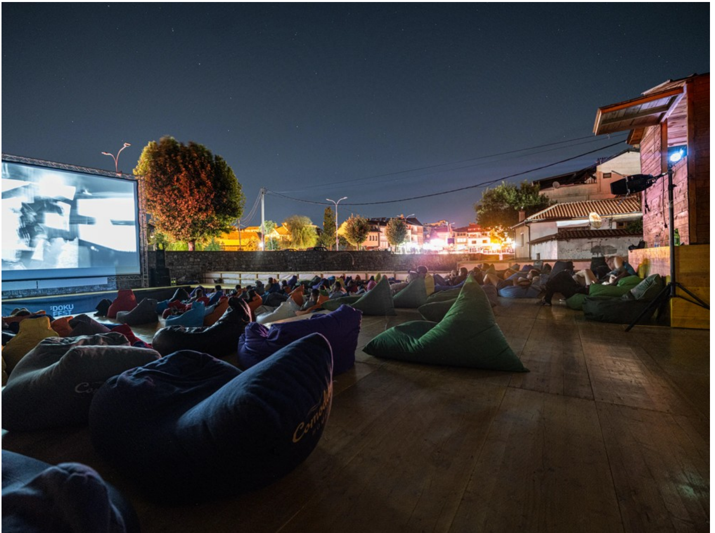
Focus Ukraine (Docudays at DokuFest)