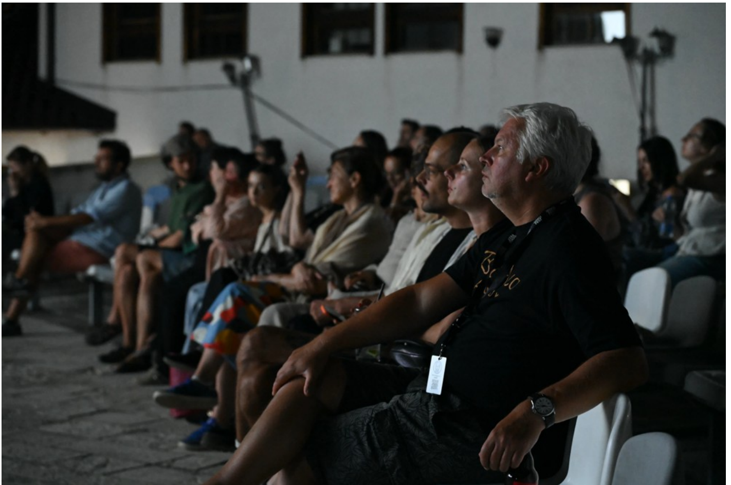
Focus Ukraine (Docudays at DokuFest)