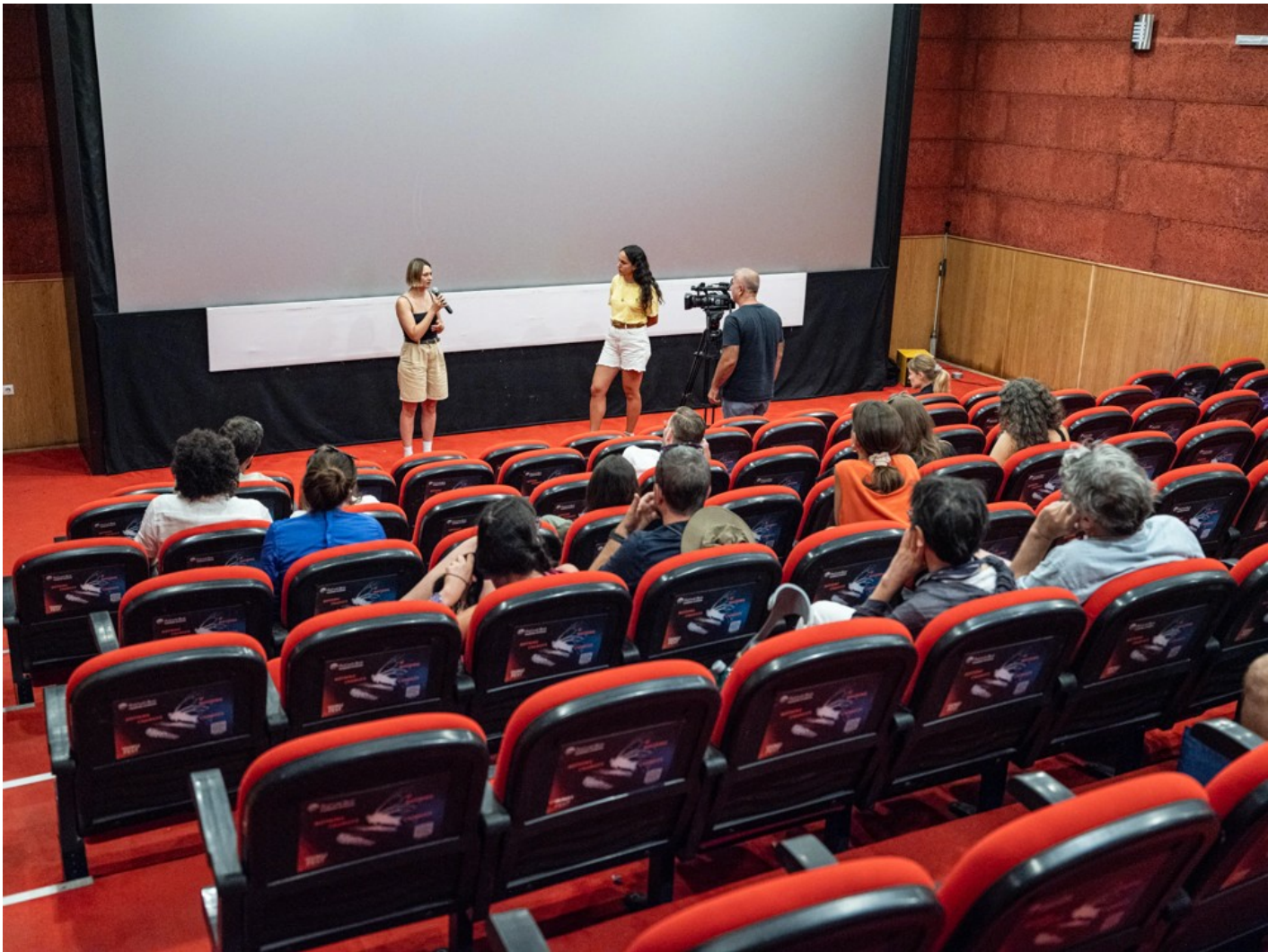
Focus Ukraine (Docudays at DokuFest)