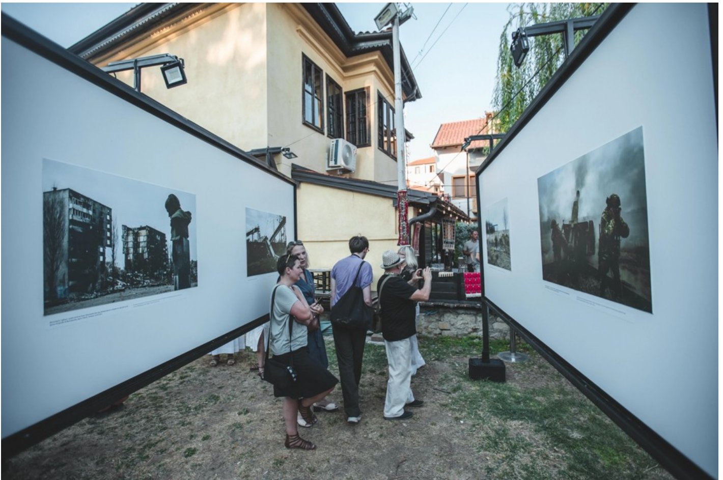
Focus Ukraine (Docudays at DokuFest)