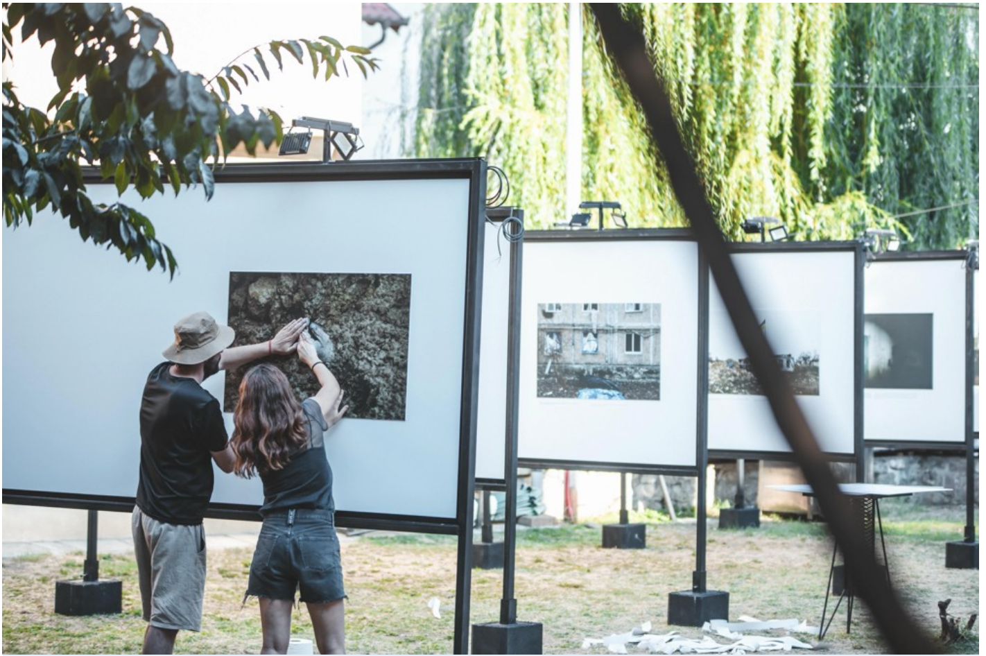
Focus Ukraine (Docudays at DokuFest)