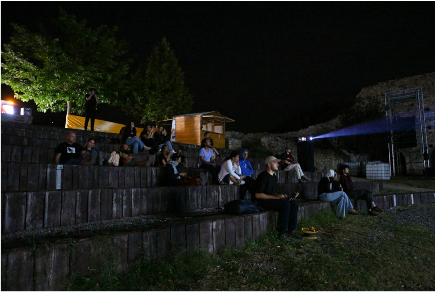
Focus Ukraine (Docudays at DokuFest)