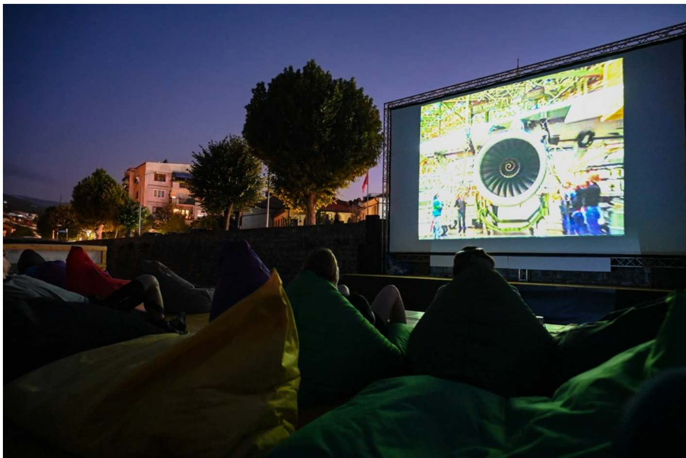
Focus Ukraine (Docudays at DokuFest)