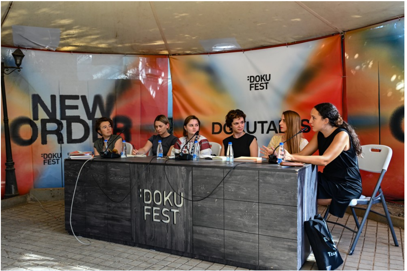
Focus Ukraine (Docudays at DokuFest)