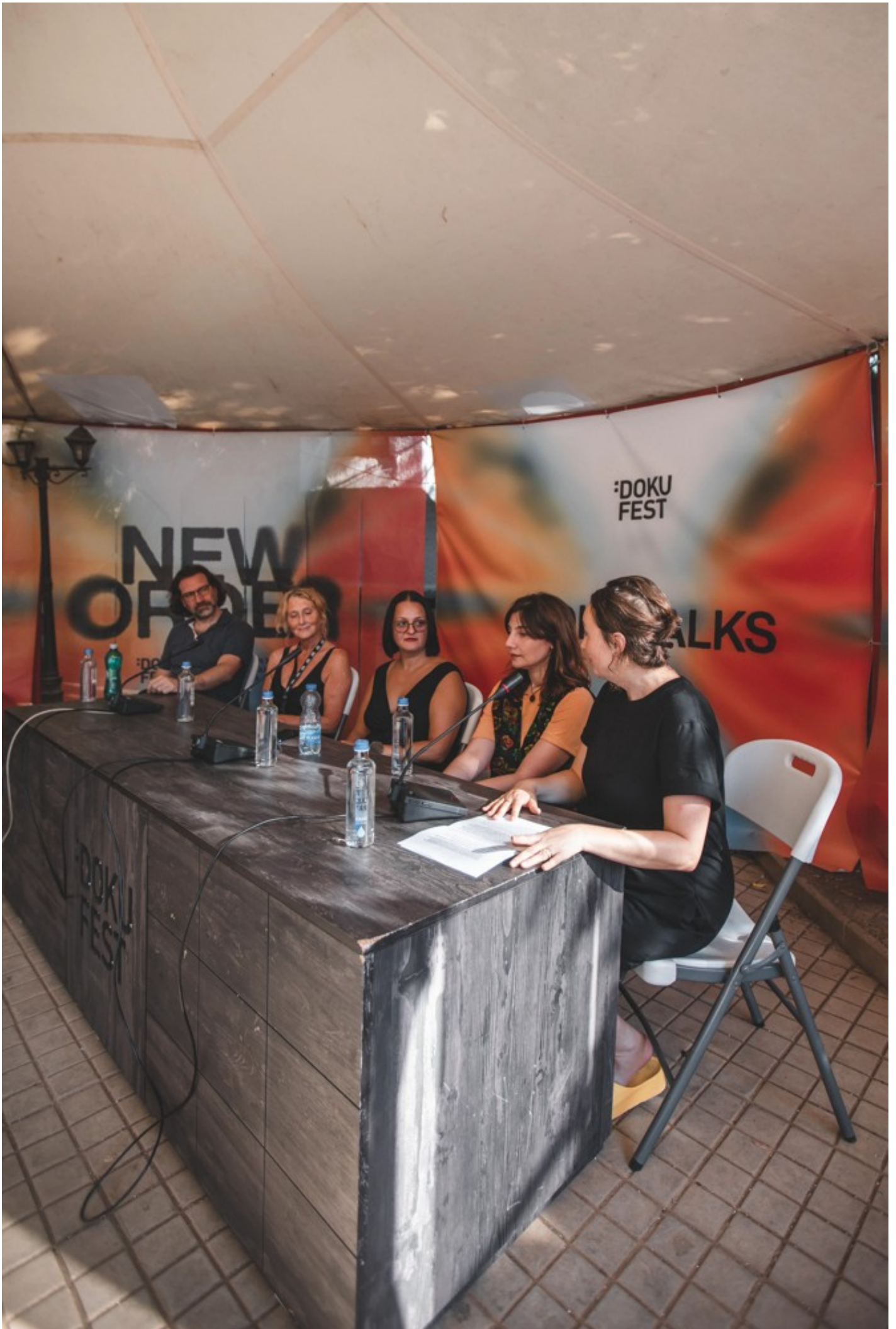
Focus Ukraine (Docudays at DokuFest)