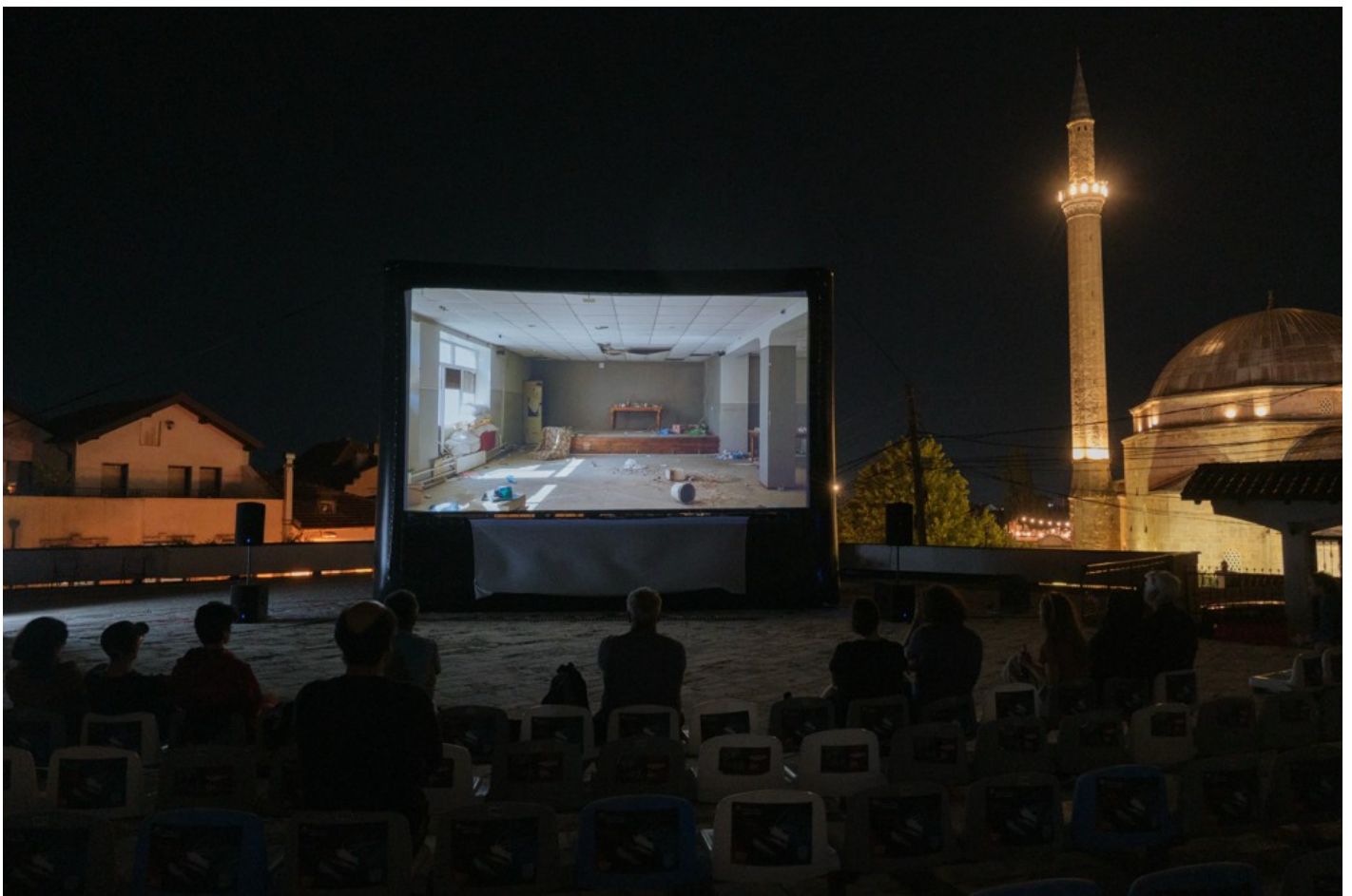
Focus Ukraine (Docudays at DokuFest)