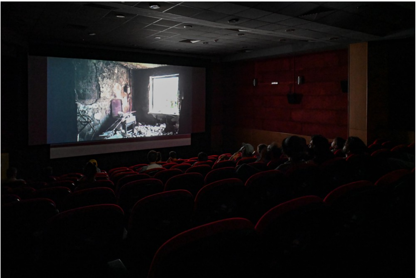
Focus Ukraine (Docudays at DokuFest)