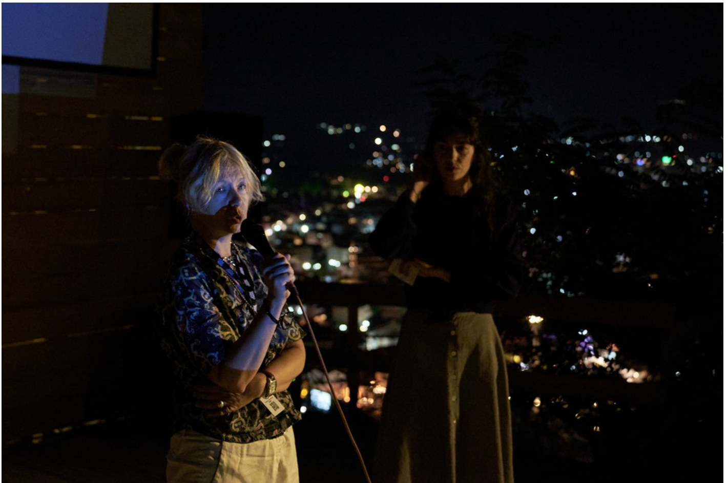
Focus Ukraine (Docudays at DokuFest)