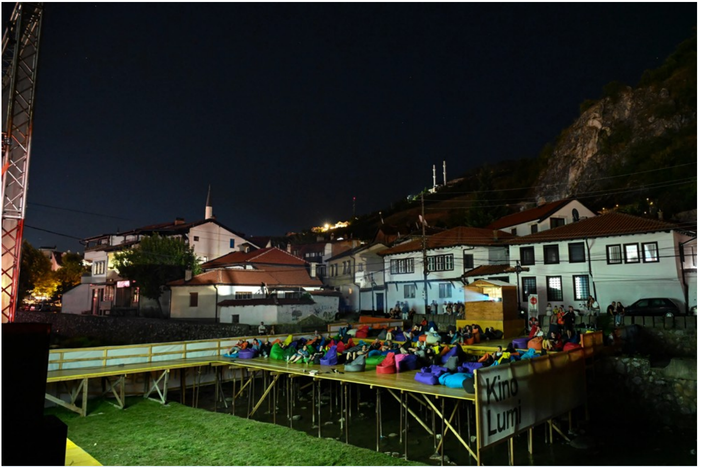
Focus Ukraine (Docudays at DokuFest)