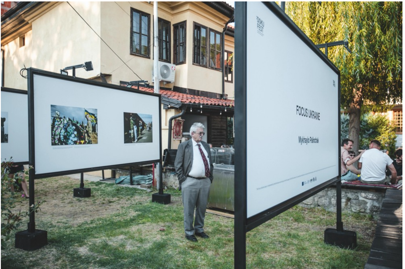
Focus Ukraine (Docudays at DokuFest)