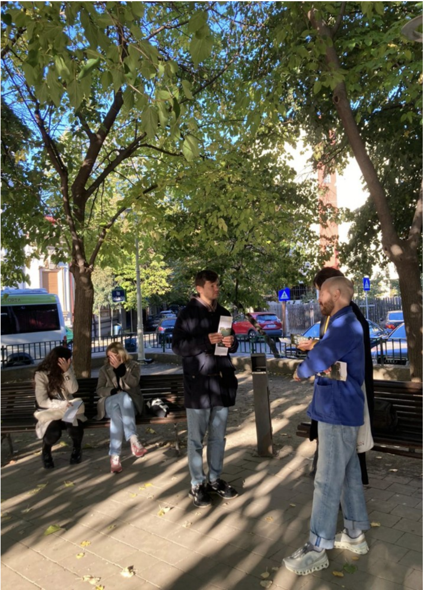
Becoming After Ruin