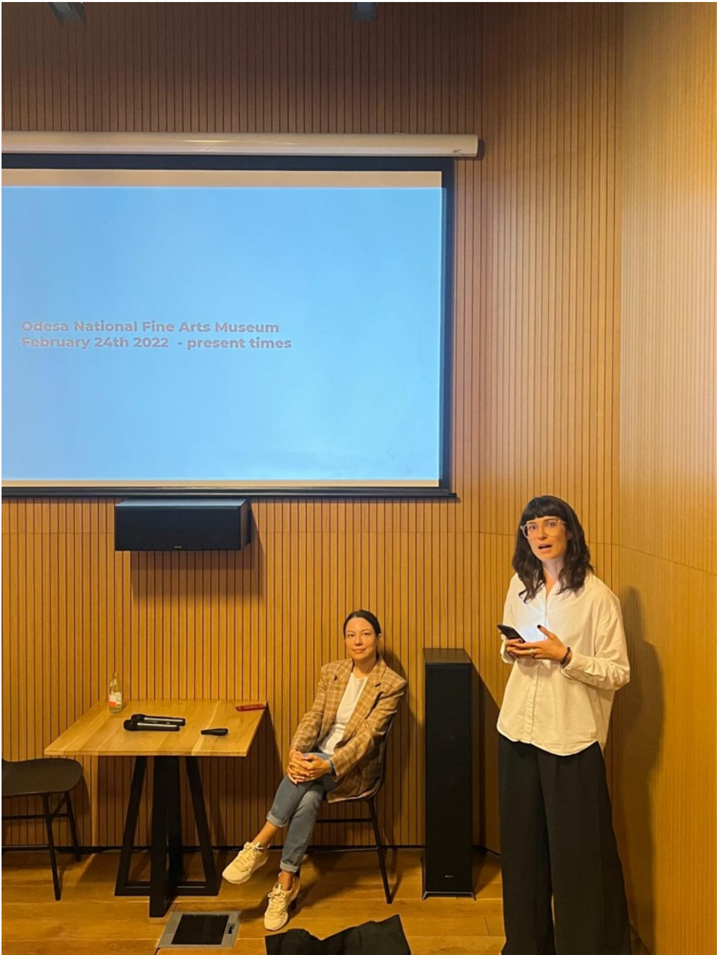
Becoming After Ruin