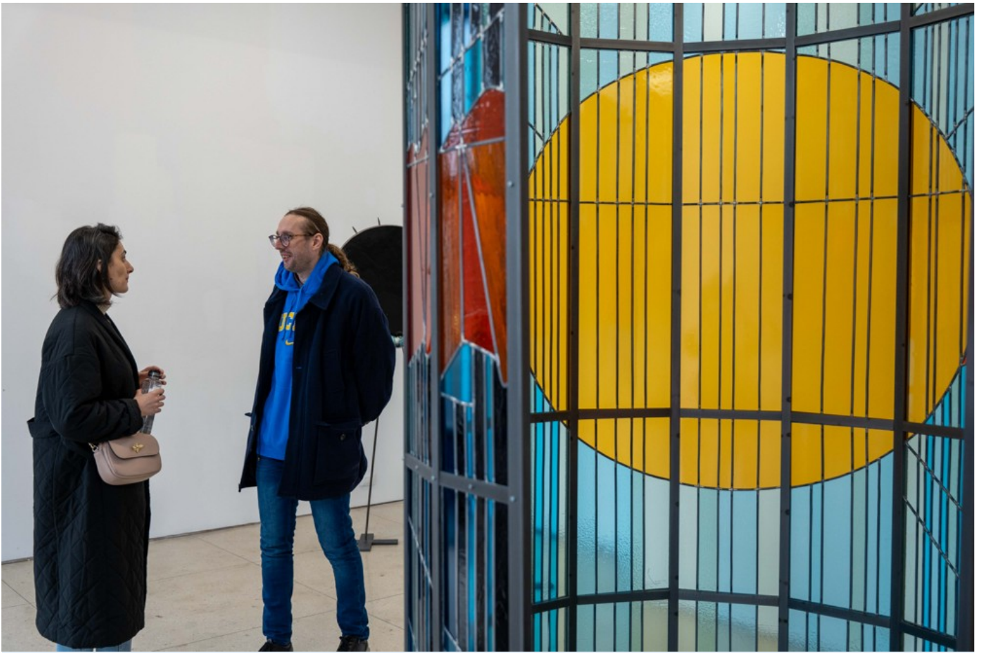
Becoming After Ruin