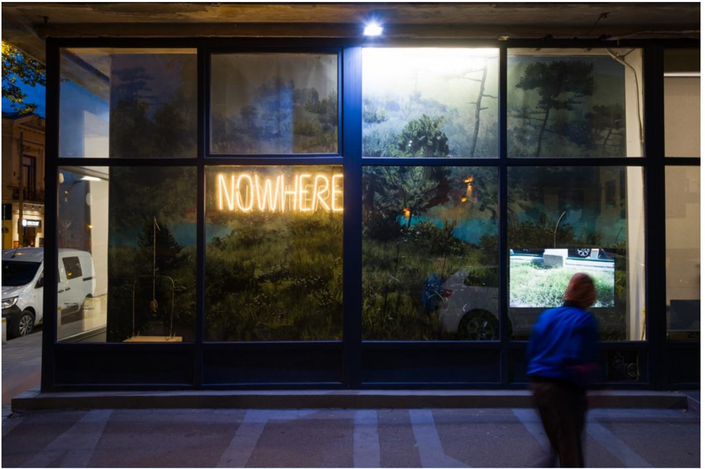
Becoming After Ruin