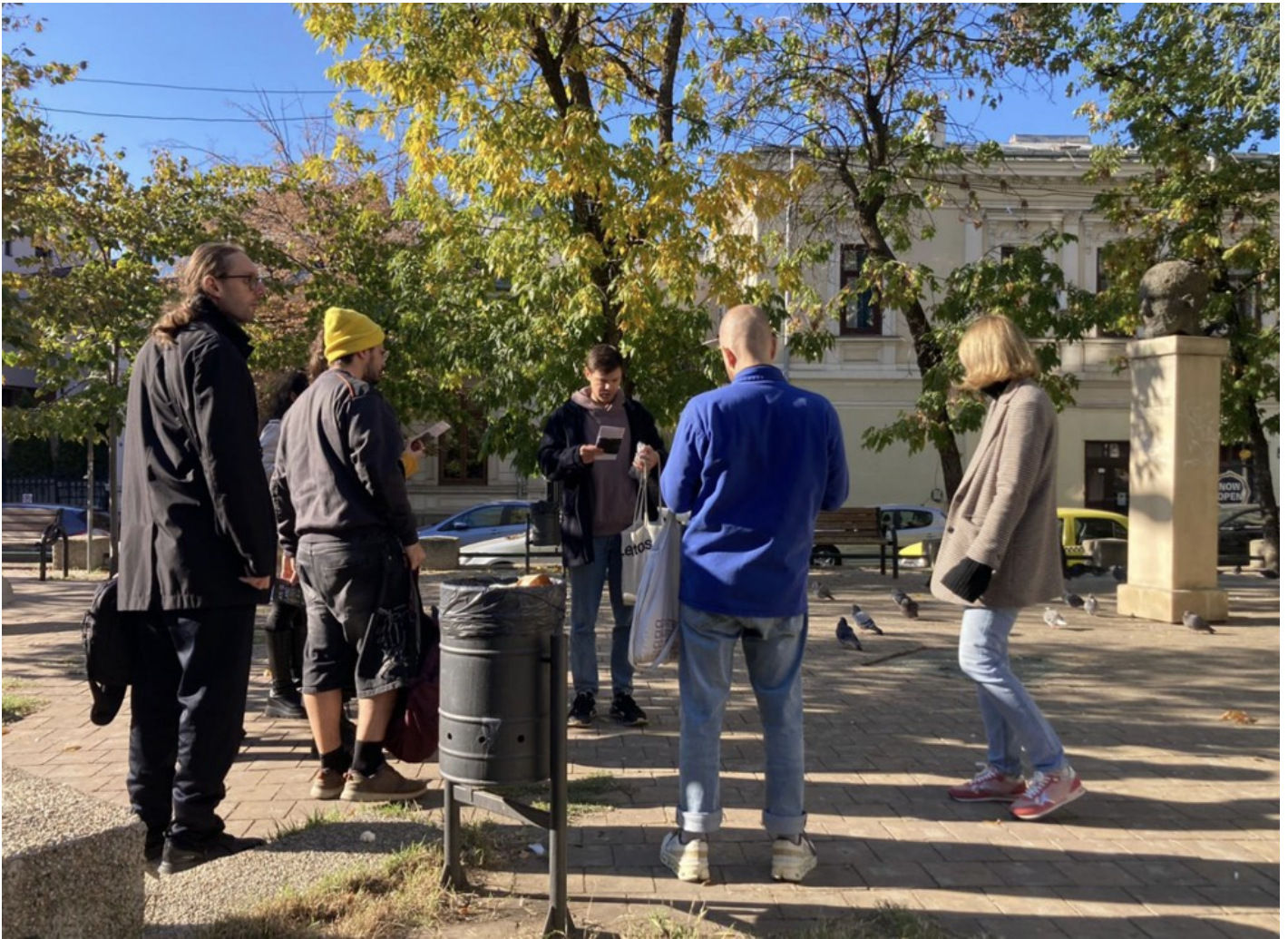
Becoming After Ruin