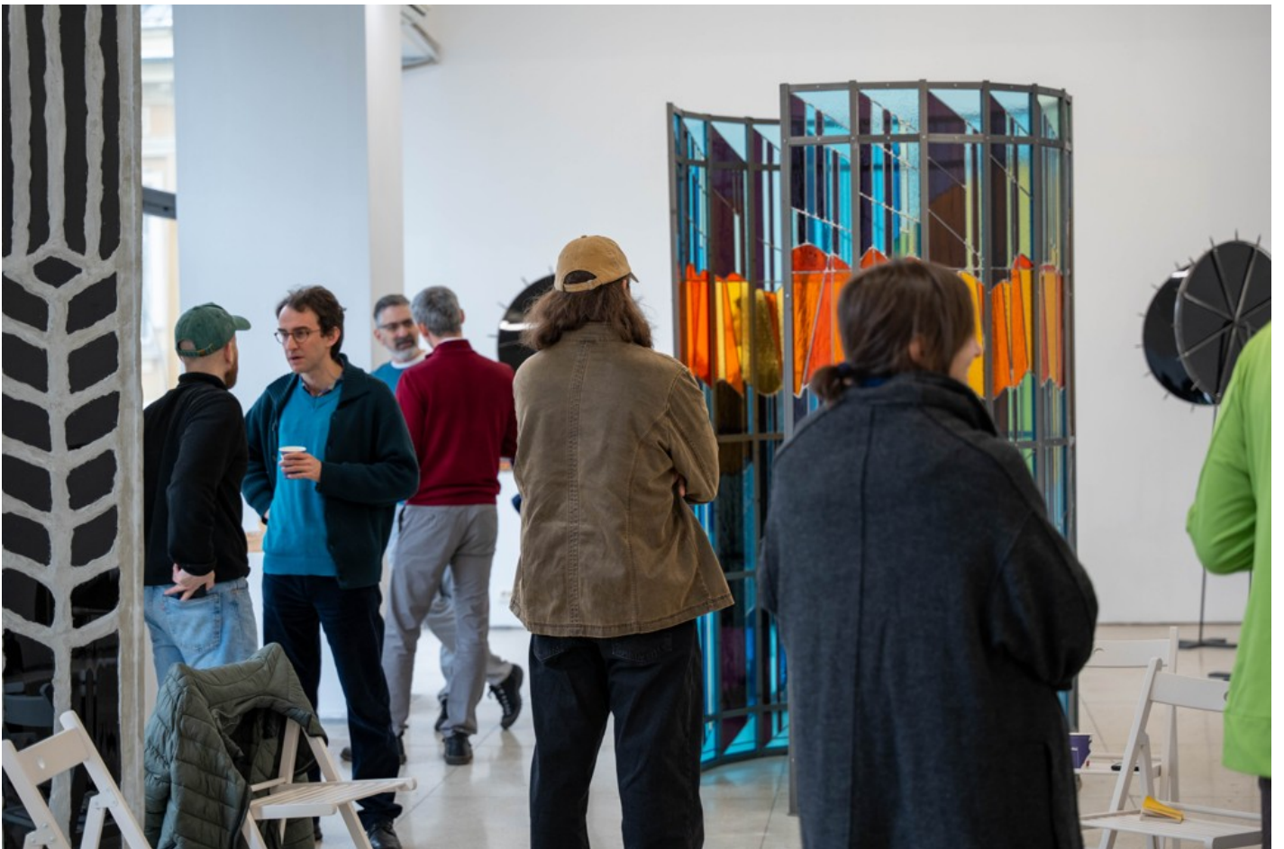
Becoming After Ruin