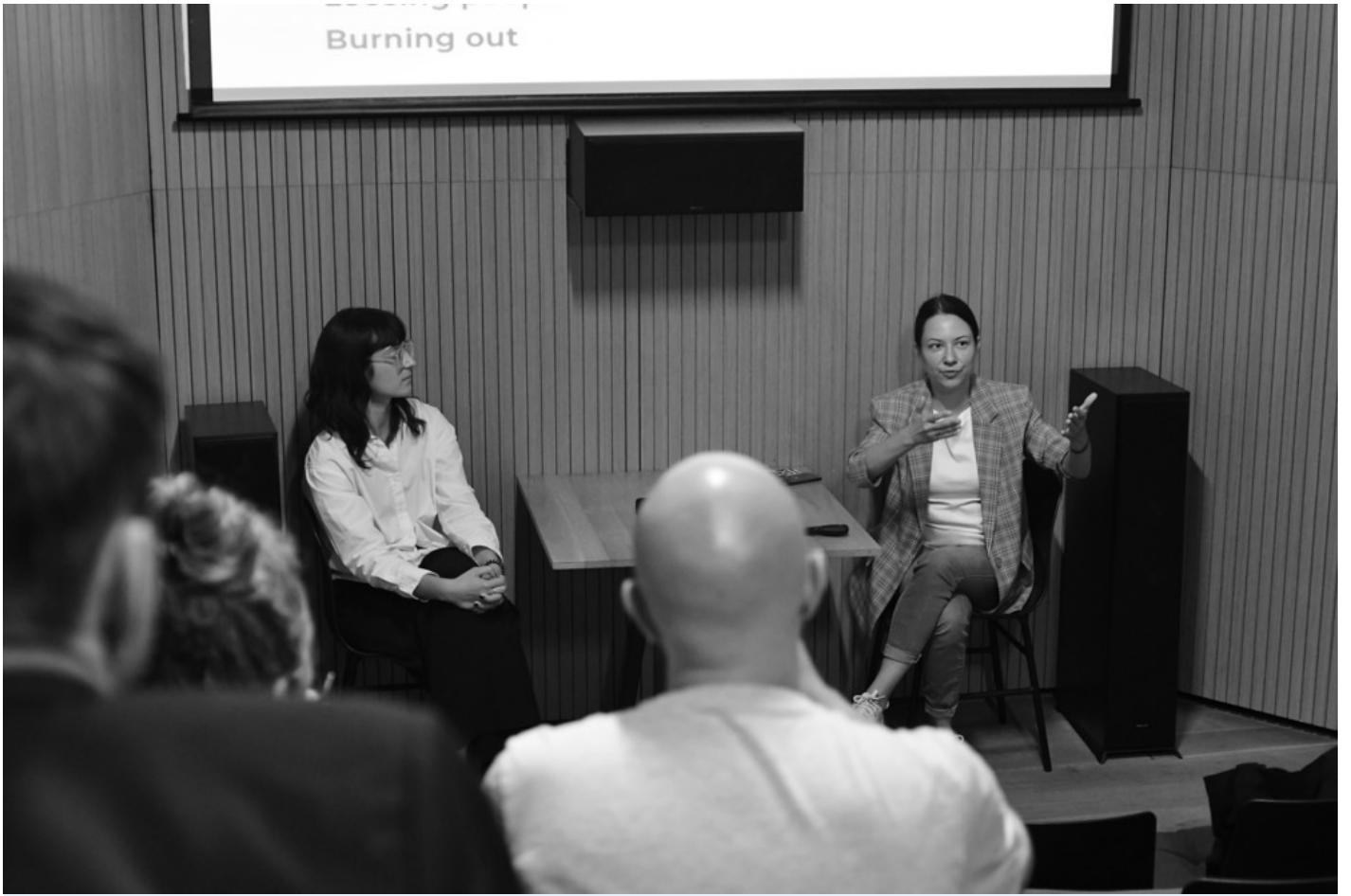
Becoming After Ruin