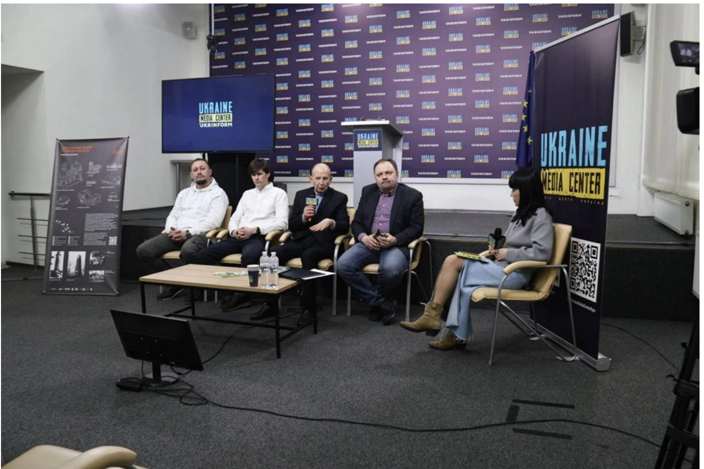
Cultural dimension of the community - Moshny village