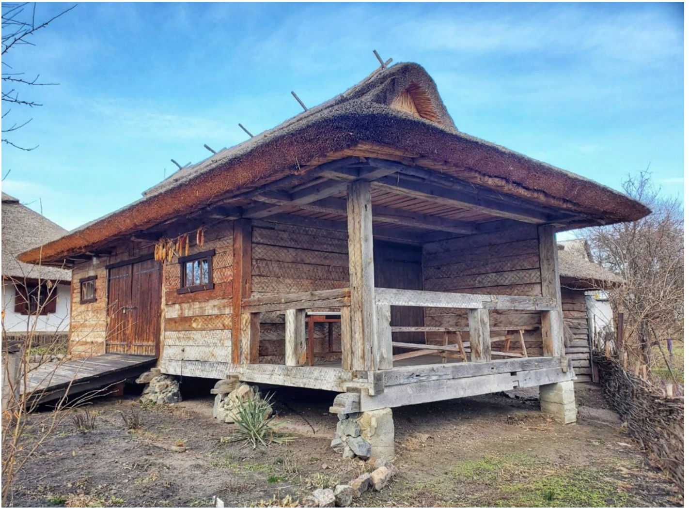
Cultural dimension of the community - Moshny village