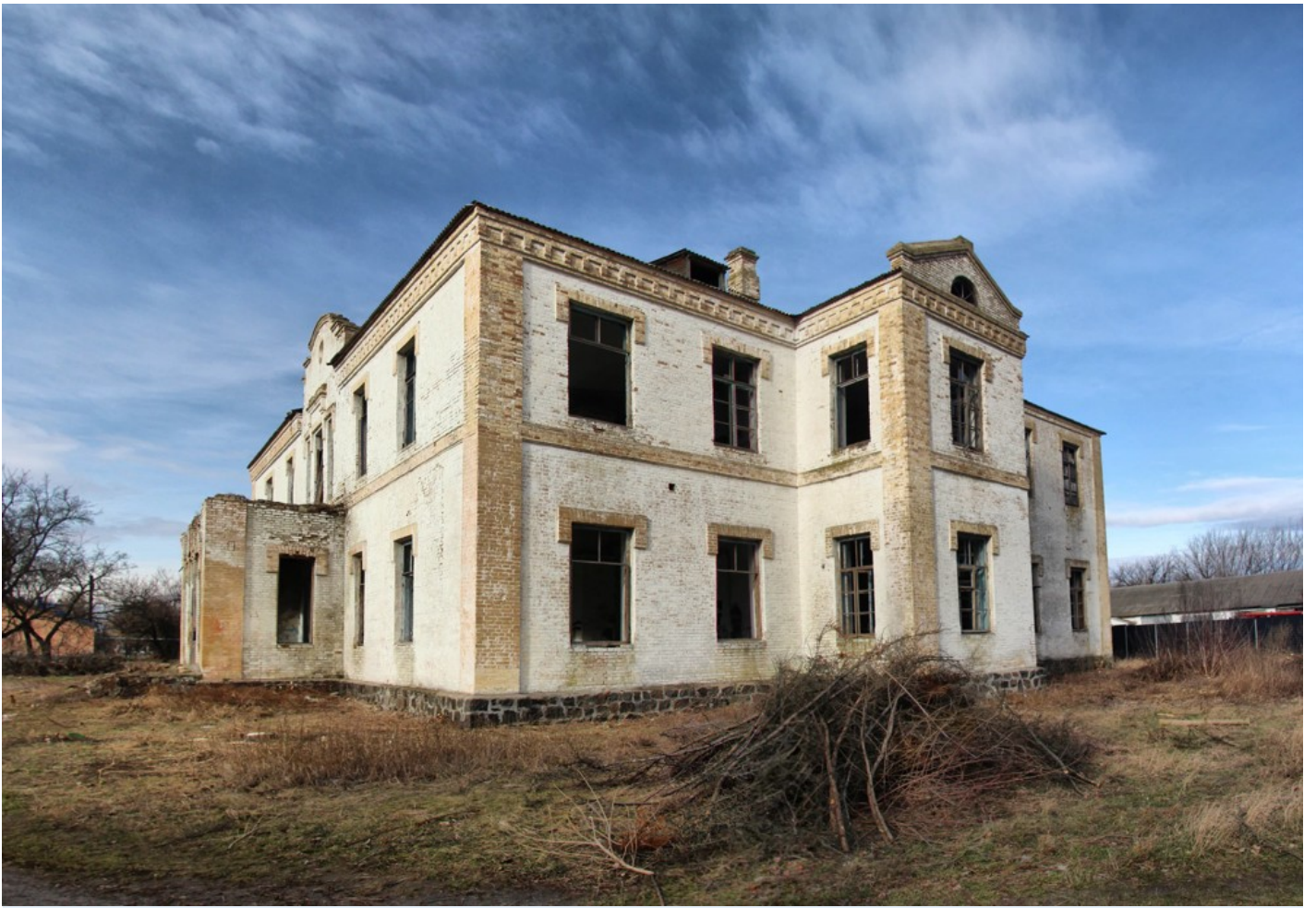
Cultural dimension of the community - Moshny village