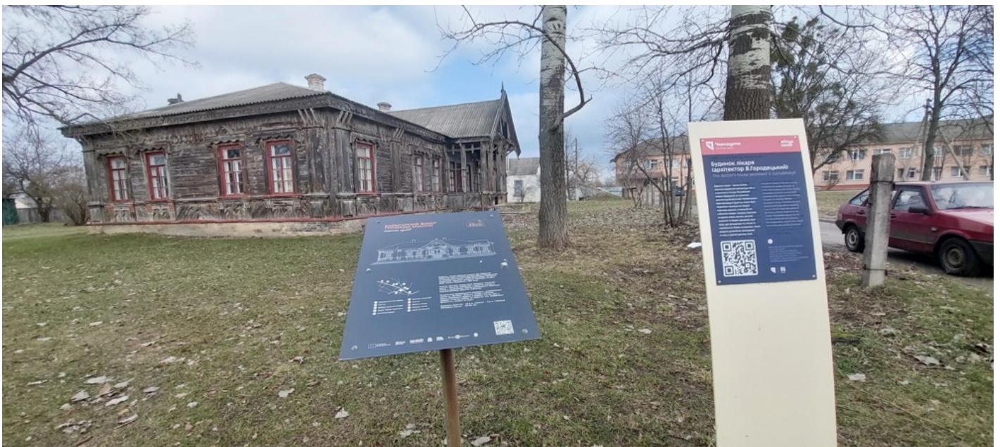
Cultural dimension of the community - Moshny village