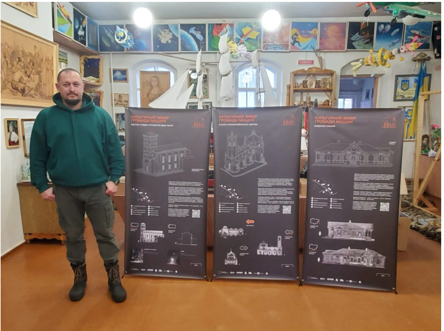
Cultural dimension of the community - Moshny village