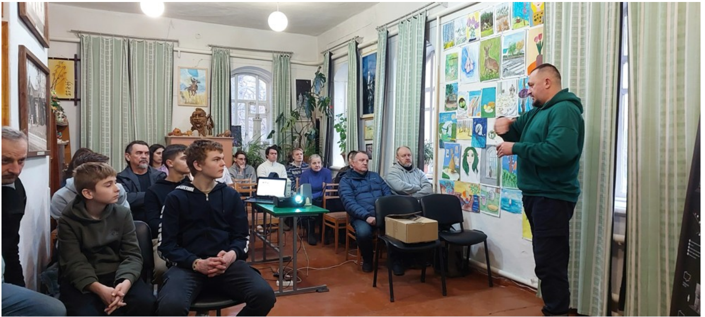
Cultural dimension of the community - Moshny village